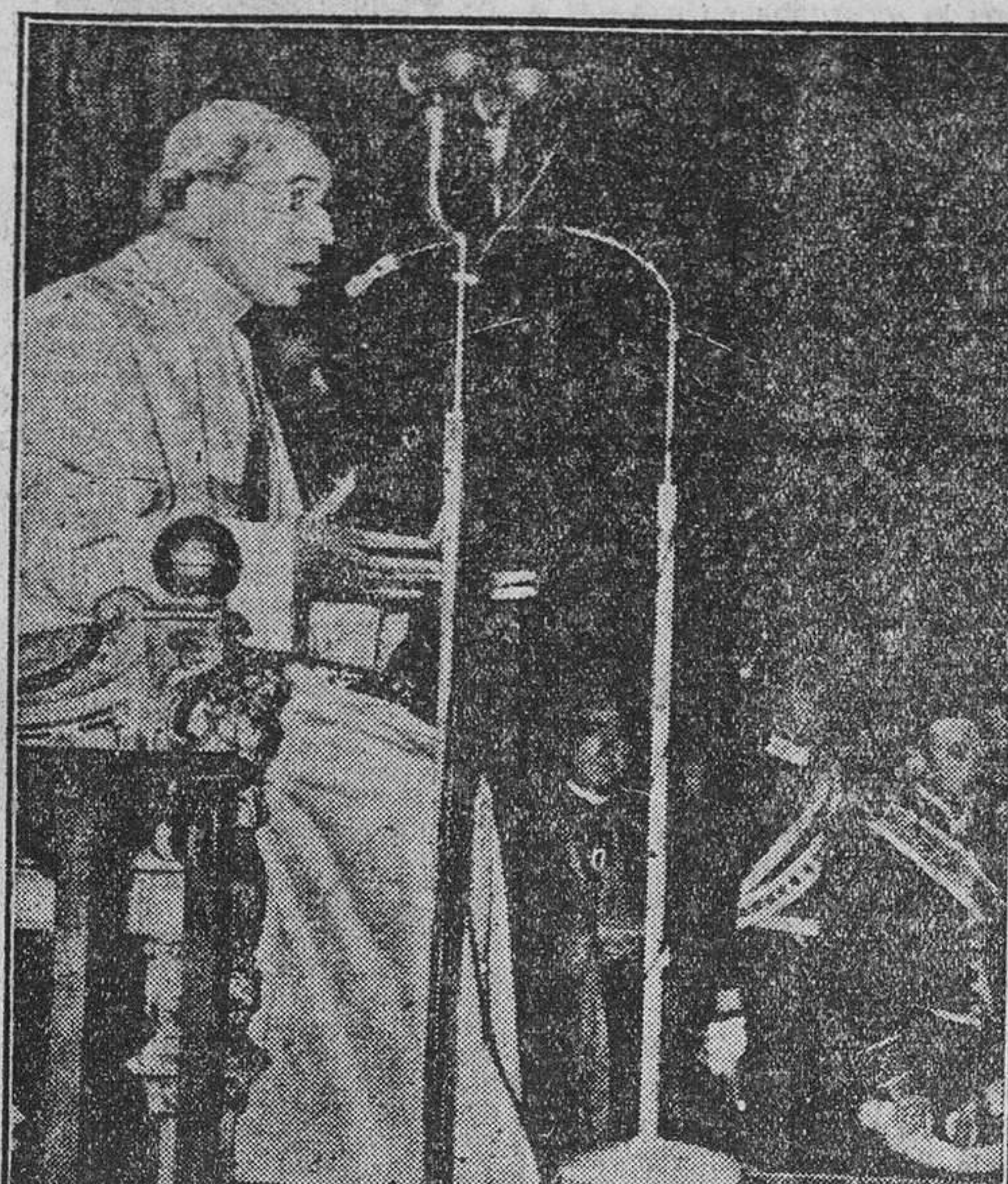
En la tradicional recepción al Colegio Cardenalicio, con motivo de la Nochebuena, Su Santidad Pio XII pronuncia su mensaje de Navidad.