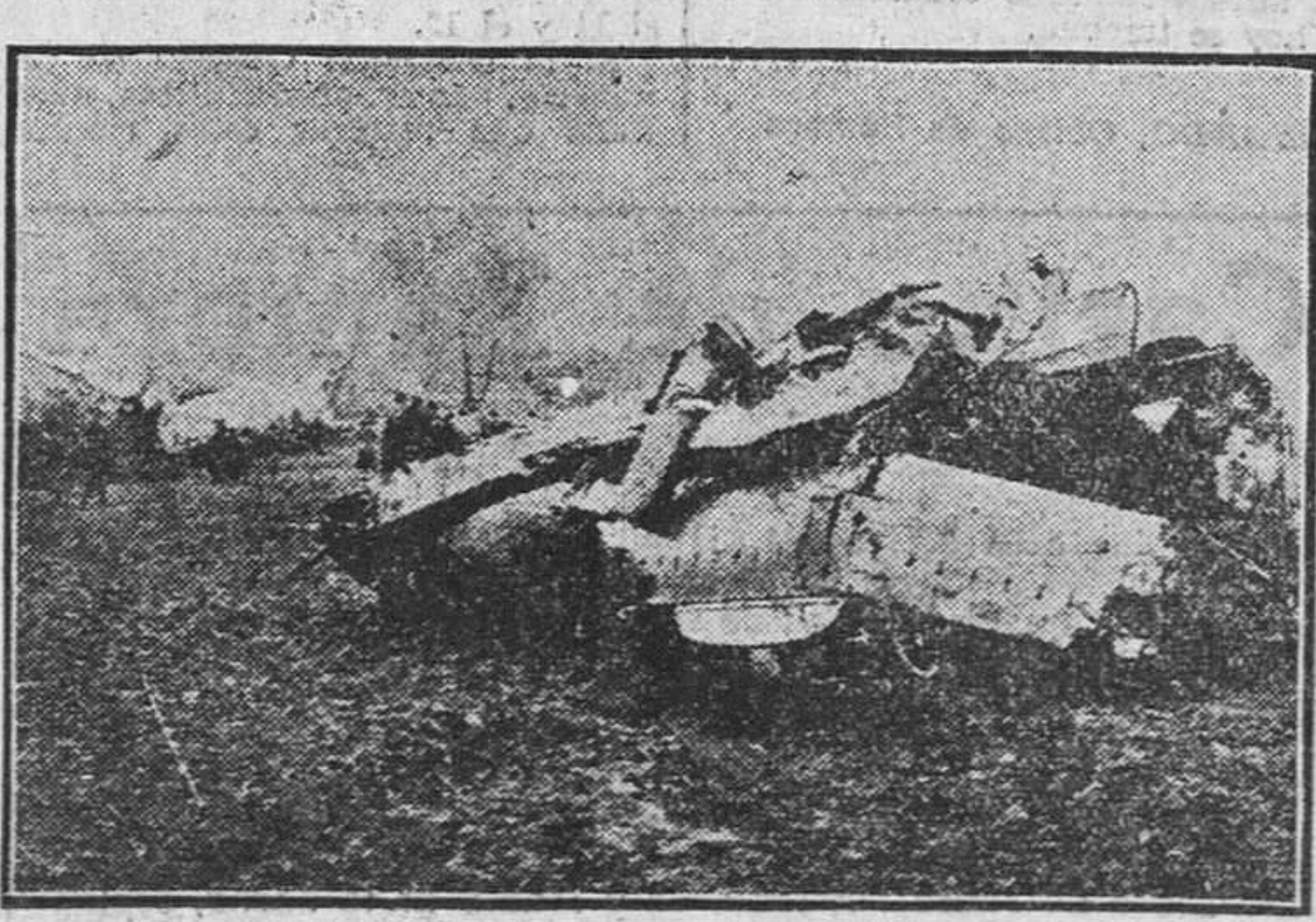
Un avión de las Líneas Belgas perdió un ala al intentar aterrizar en territorio amigo. En primer término, el ala desprendida del avión, a una considerable distancia del aparato, que se ve al fondo de la fotografía.