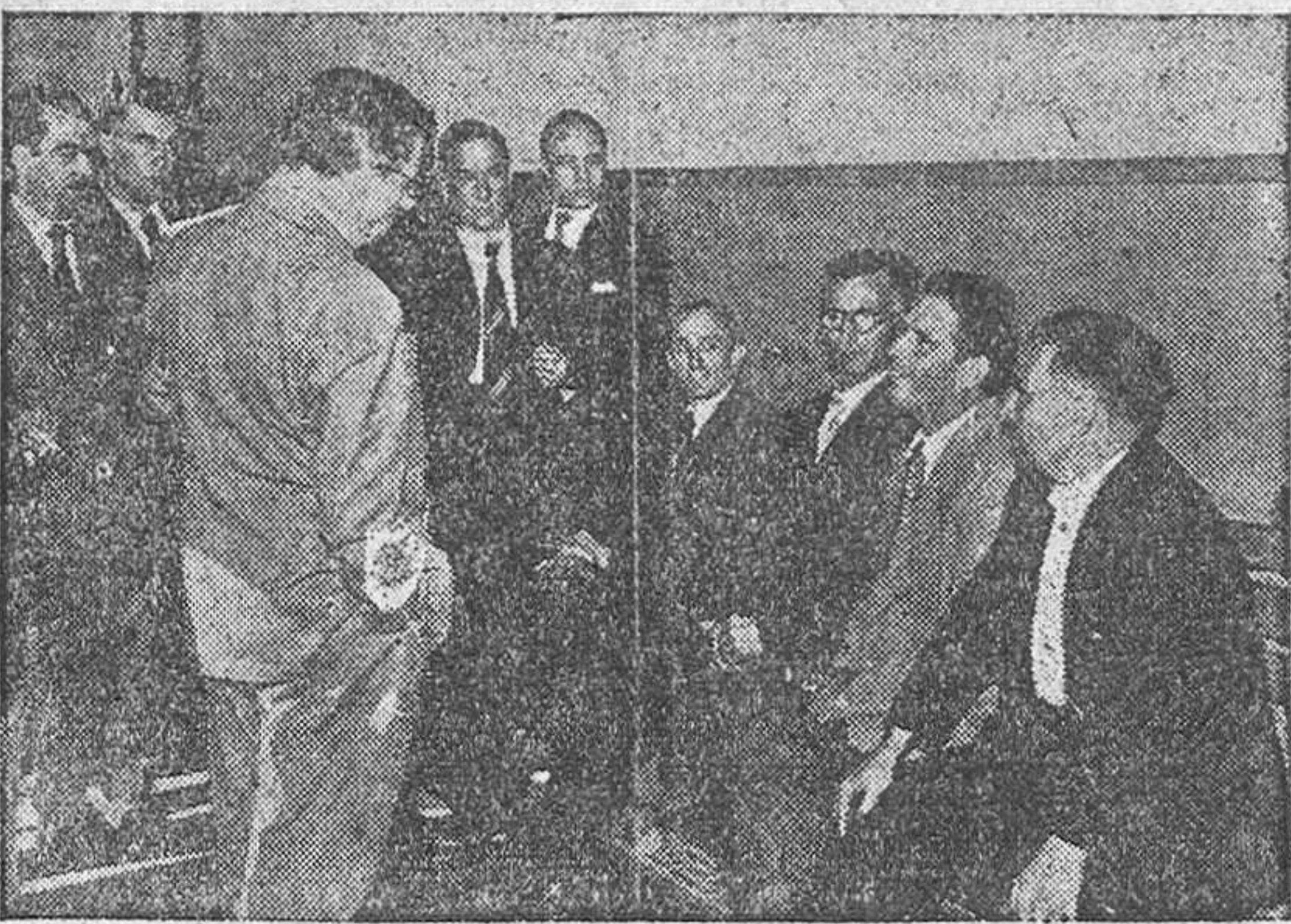
Padres negados desde los más diversos rincones españoles exponen sus esperanzas y sus inquietudes sobre el resultado de los exámenes. Sentados están los que proceden de Toledo, Jaén, Avila y Segovia, rodeados por otros de diversas provincias