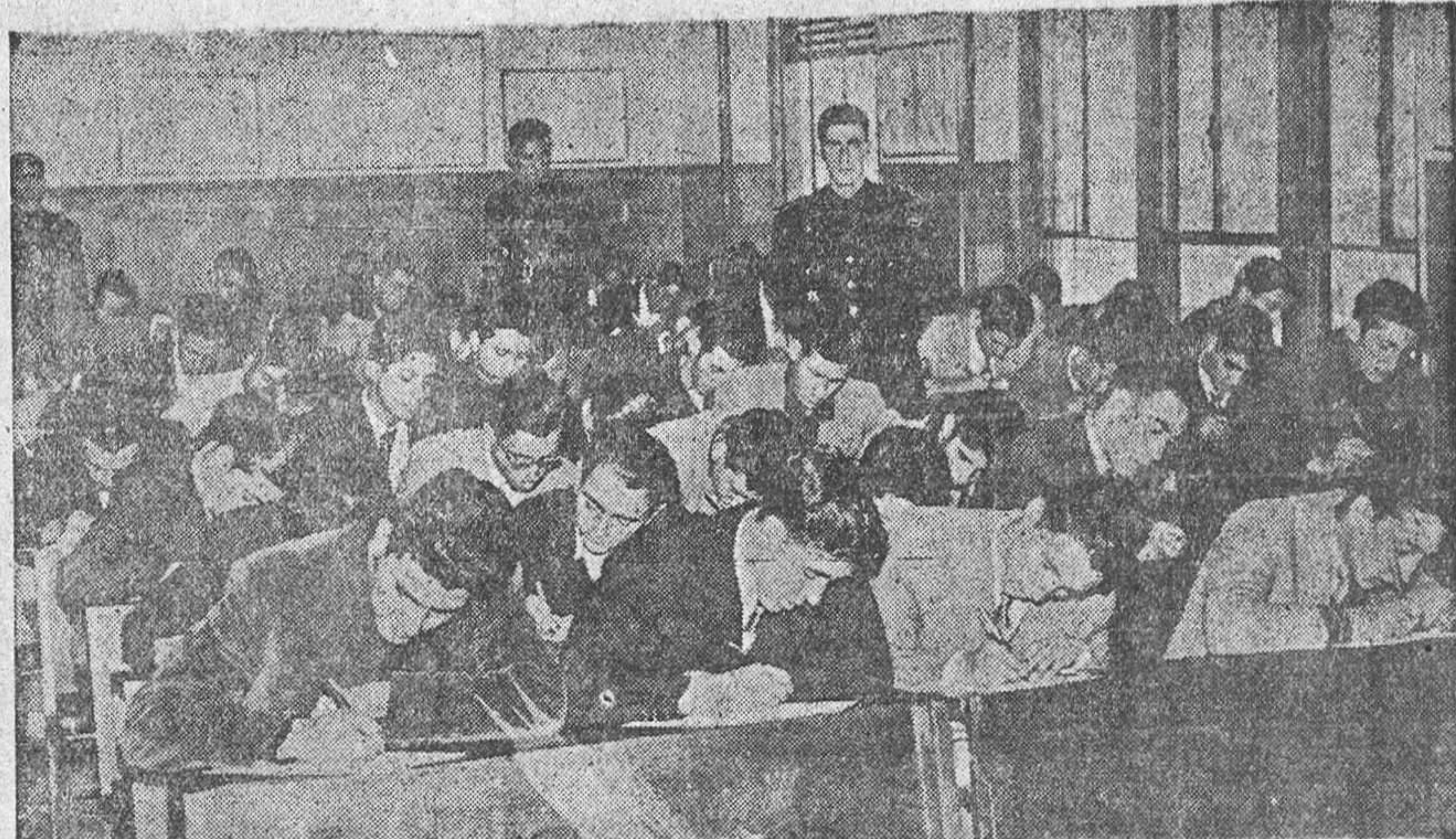
Una de las aulas donde, bajo la vigilancia de alumnos de la Academia Nacional de Mandos, los opositores a las plazas de la Escuela del Magisterio "Miguel Blasco Vilateja", realizan uno de sus ejercicios.

¿Serán pura y simplemente maestros para situarse en el escalafón y olvidar cuanto conviene como norma de vida para quienes han de tener este origen profesional? Mucho han de obligar a los