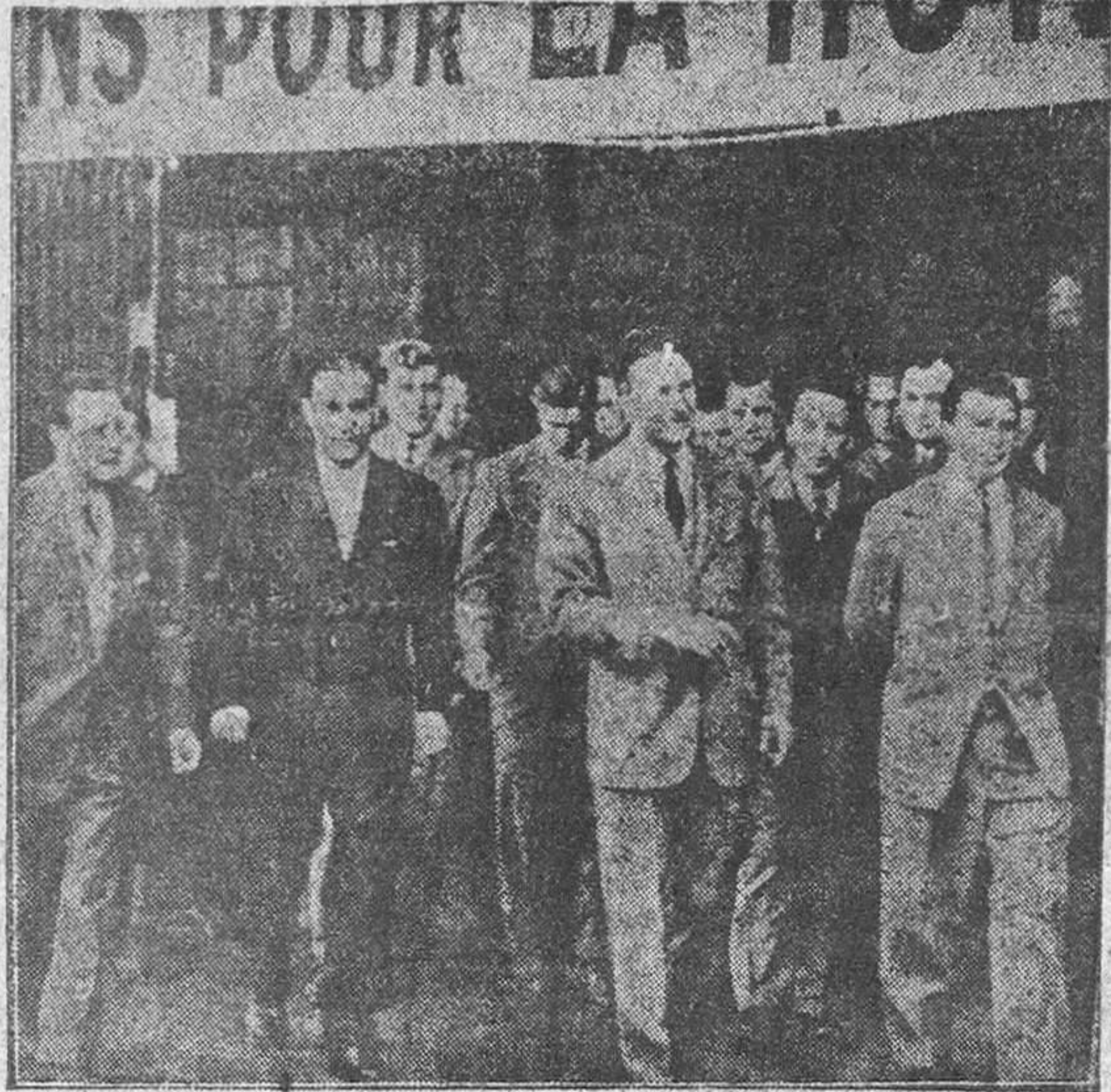
Puskas y sus compañeros al salir de una oficina de ayuda a los refugiados húngaros en Viena.

Nueva York, 15.—En una noticia fechada en Méjico la agencia de noticias «United Press» asegura que los treinta y seis jugadores húngaros de fútbol que se han negado a regresar a su país lo es por estar subyugados por los comunistas y han pedido asilo en Méjico.