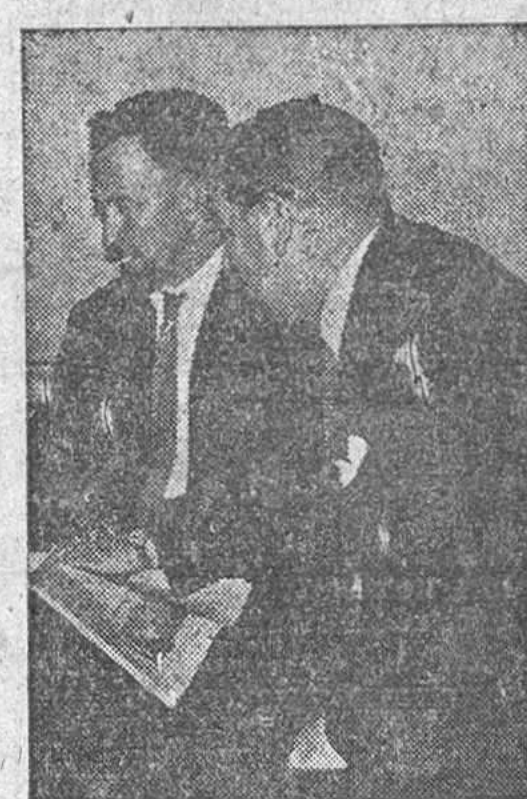
Nuestro colaborador conversa con dos maestros vallisoletanos: uno de la capital y otro de Tordesillas.

Su otra función de instructores juveniles, por la que recibirán una remuneración independiente de su asignación oficial como maestros, consistirá en el desempeño de tareas propias del Frente de Juventudes en las localidades donde residan, y tendrán posibilidades para seguir los cursos convocados para profesores de formación política y de educación física, con lo que su preparación para la enseñanza tendrá una mayor efectividad que si realizaran sólo alguna de las dos especialidades profesionales.