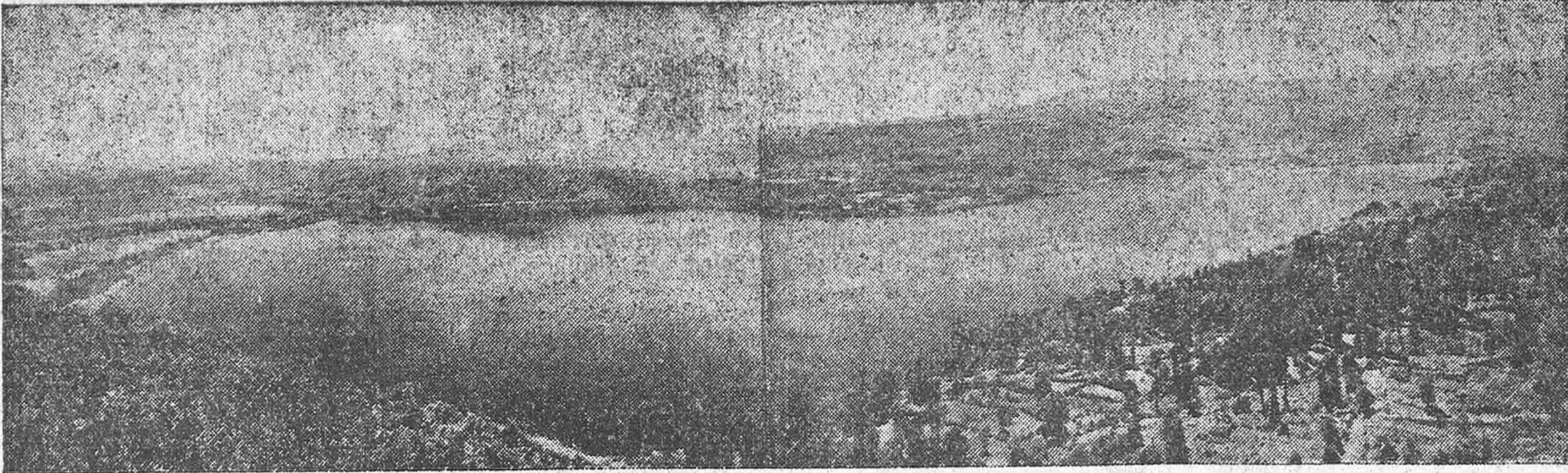
Una espléndida perspectiva del lago de Sanabria, siempre de actualidad.

lada, poderosa. Las calles del pueblo, esquinadas en hogares, construidos con la misma piedra y la misma madera de las serranías, se han cubierto de los blancos copos mensajeros de la nieve. No hay nadie por las calles. A lo lejos, como un aparecido que aravesase tupidas gasas, un hombre, desgarrado y enebrecido, apoyado en un viejo bastón de caminante, llama por las puertas.