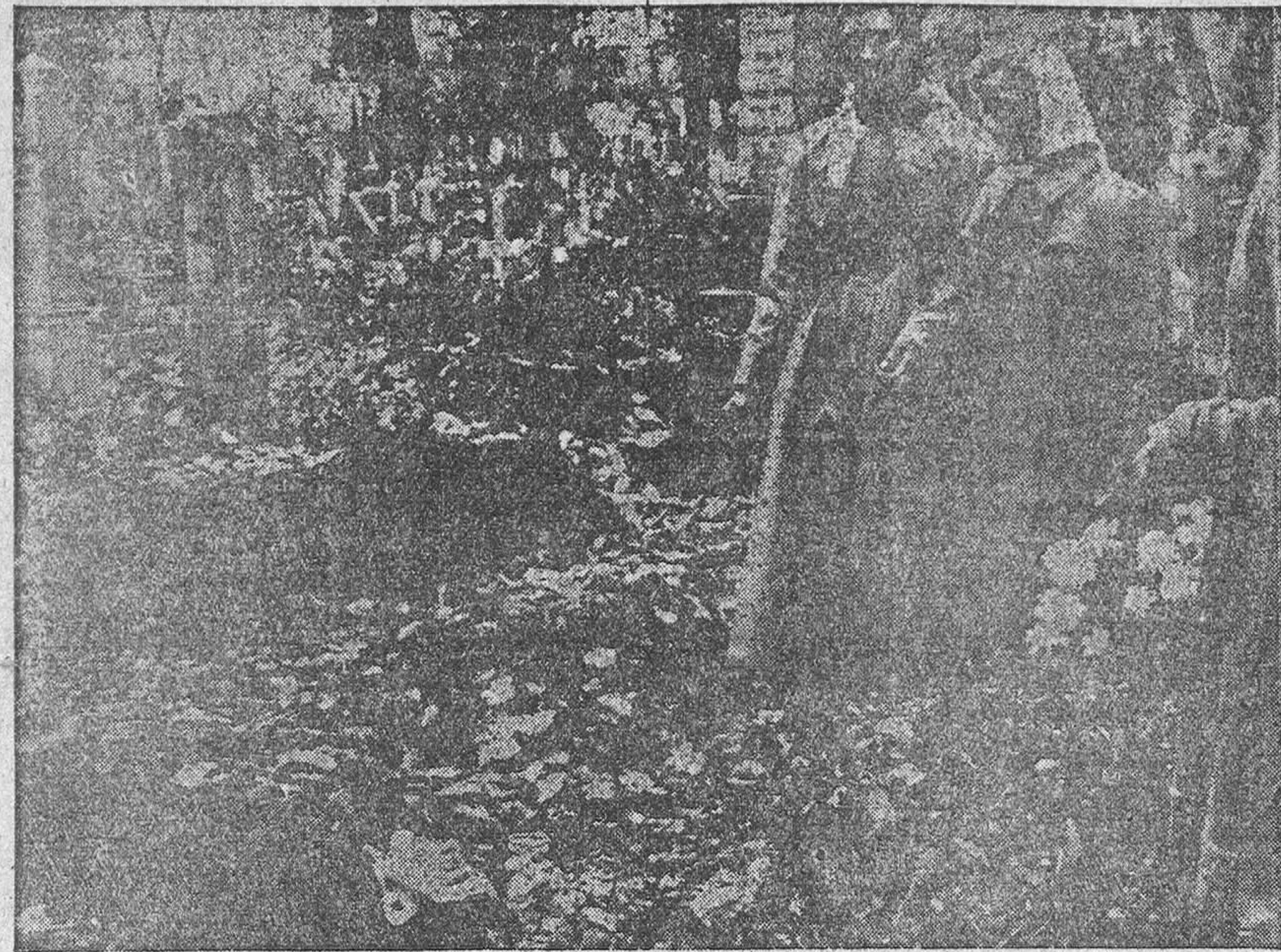
Una patética escena de la tragedia: Dos madres lloran ante los cadáveres de sus hijos que están tendidos sobre el cementerio.

No ha vuelto a llegar ningún fugitivo. Los últimos fueron un grupo de soldados y estudiantes—doscientos hombres—que defendían la carretera hacia Győr y retrocedieron cuando avanzaron hasta ellos 33 tanques soviéticos. No tenían más que algunas ametralladoras ligeras