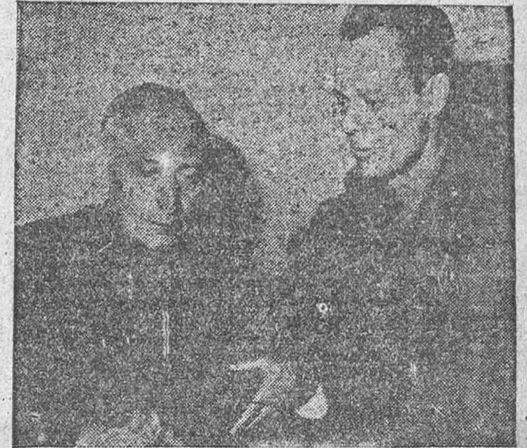
Mindszenty al ser liberado.