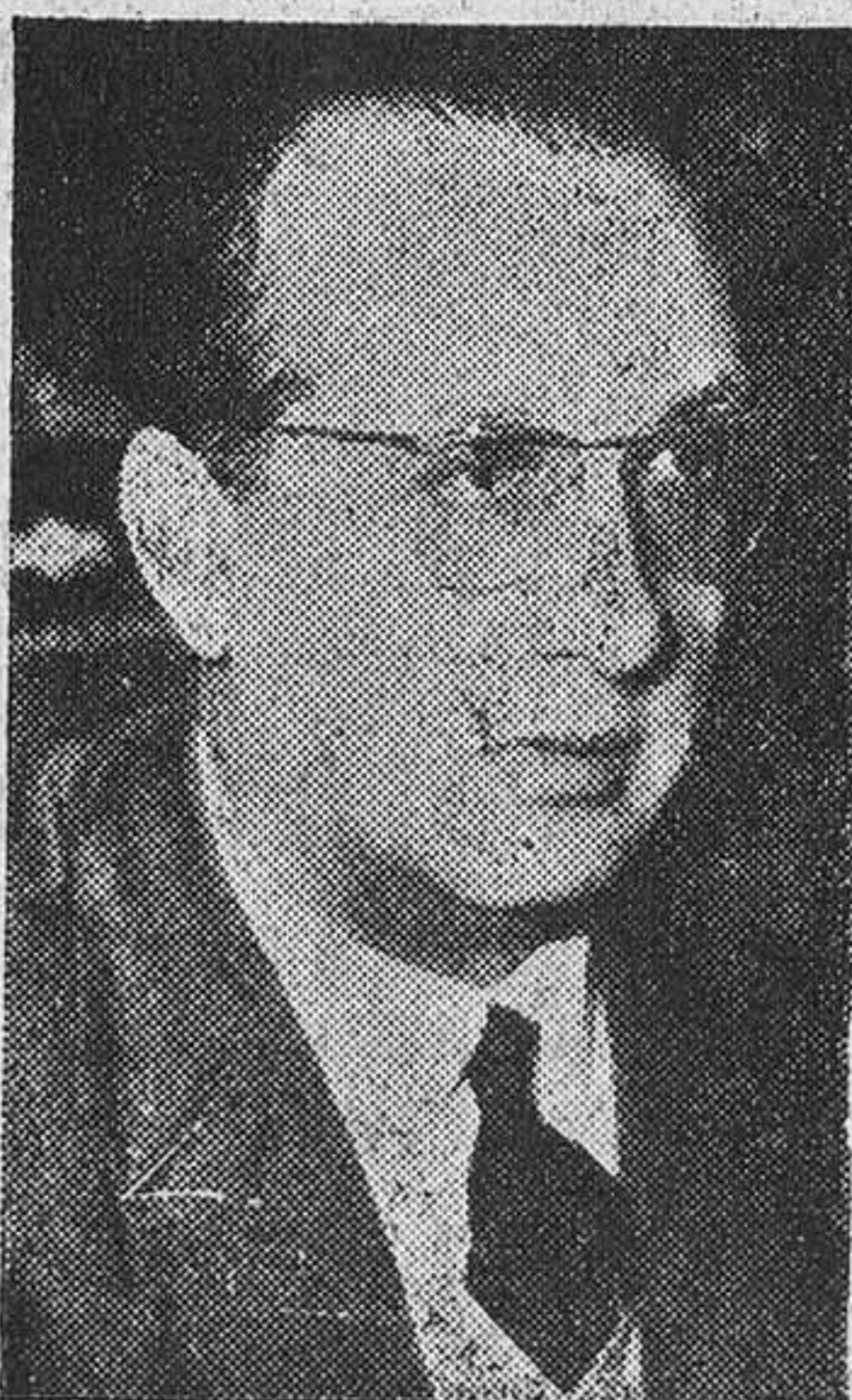
GABRIEL ARIAS SALGADO

Tres Cardenales fallecieron en 1962. El 5 de febrero falleció en Roma el cardenal Gaetano Cicognani, durante mucho tiempo Nuncio Apostólico en España. Tenía a la sazón ochenta años de edad. Con su desaparición sólo quedaba un Cicognani en el Colegio Cardenalicio, porque se daba el caso de que dos hermanos eran simultáneamente cardenales. El 7 de febrero falleció en Lourenço Marques, capital de Mozambique —la provincia ultramarina portuguesa del África sudoriental—, el cardenal Teodosio Clemente de Gouveia, a los setenta y dos años de edad. Era el único Cardenal residente en África antes de ser nombrado cardenal un obispo de