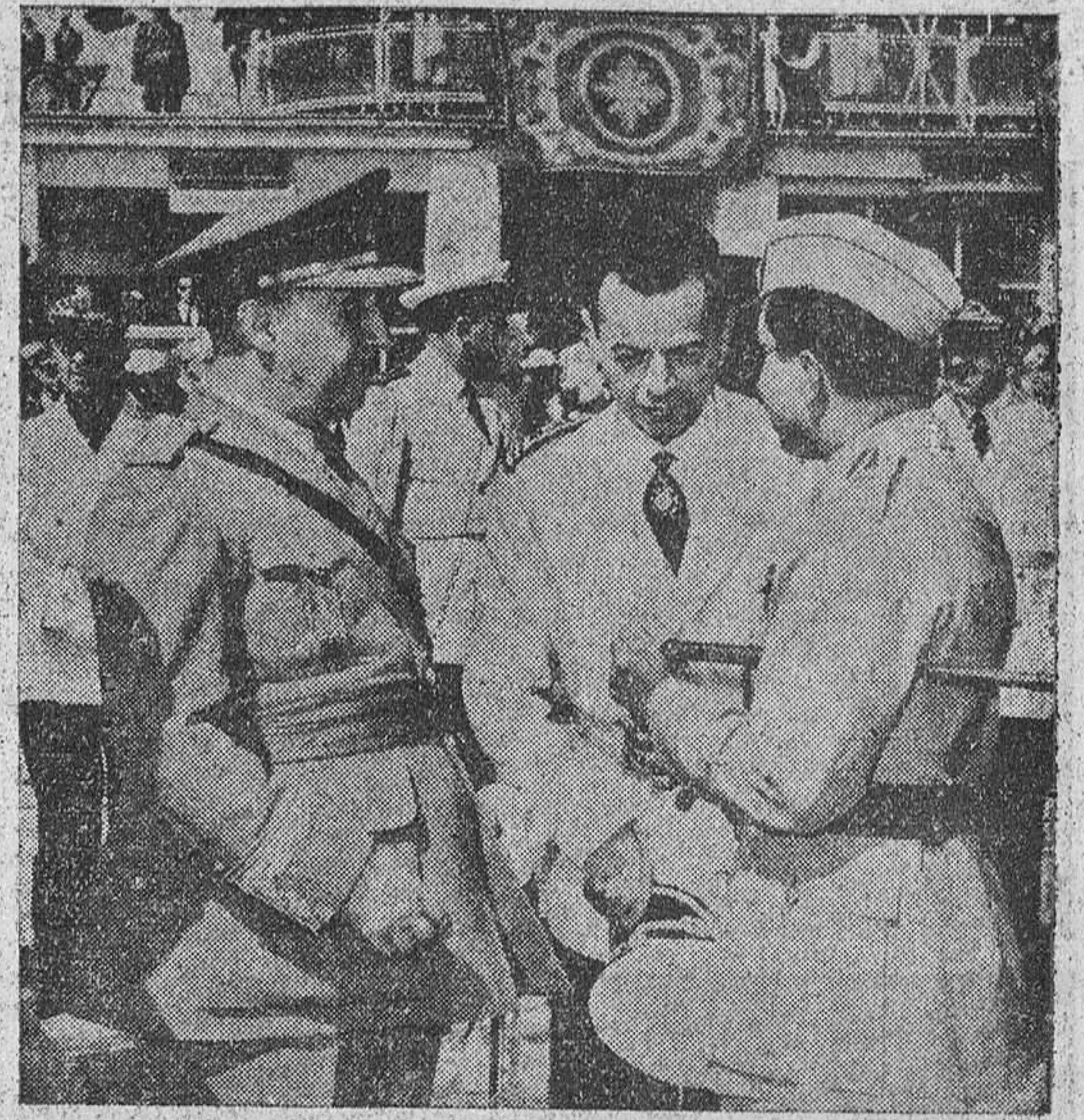
Madrid.—El rey Faisal en el momento de despedirse de Su Excelencia el Jefe del Estado momentos antes de tomar el avión que le conduciría a Granada. El monarca y su séquito también fueron despedidos por los miembros del Gobierno y otras personalidades.

Franco despidió al monarca en el aeropuerto de Barajas