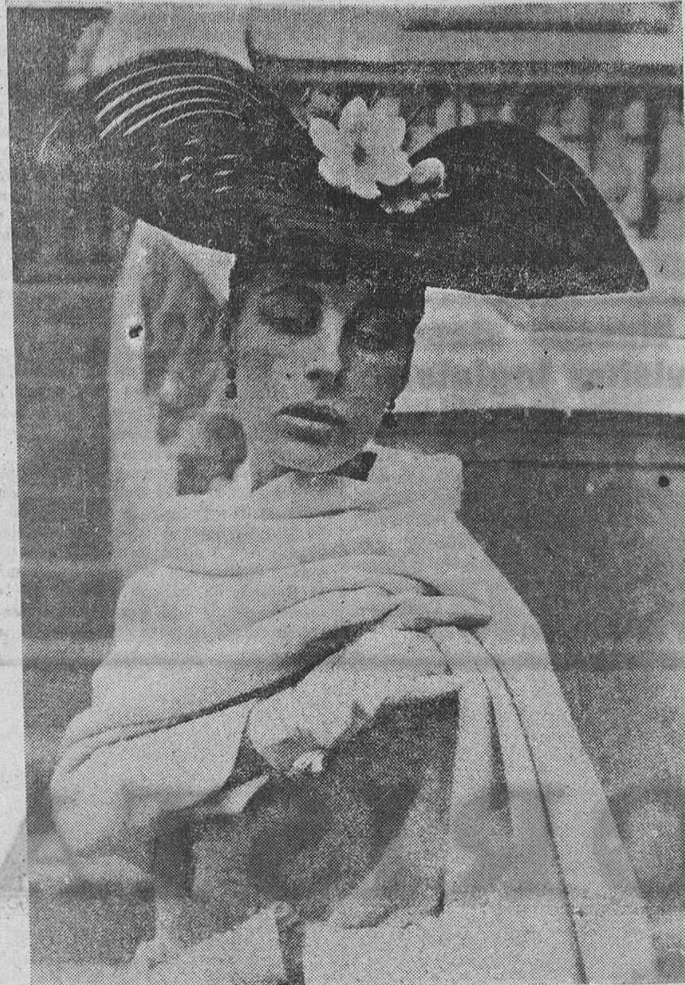
Sombrero en paja adornado de rosa roja, gran echarpe drapado y guantes blancos, es un original conjunto visto en las carreras de Auteil.