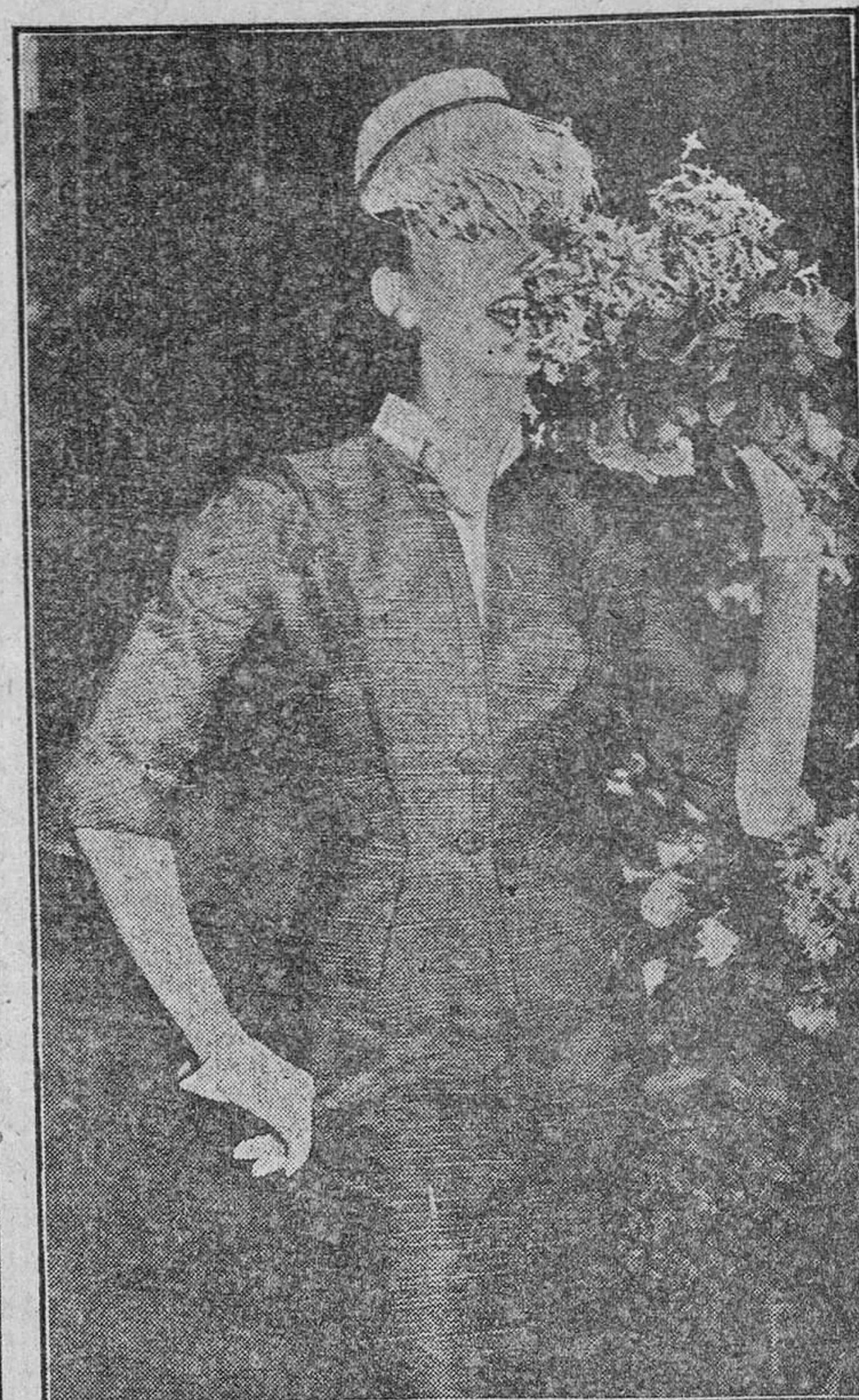
Si la Primavera la sangre altera, también con ella la moda cambia y modifica sus cánones. Este modelo, lanzado por la moda italiana, es tan bello —sin árida alguna— como la Primavera y como la modelo que lo lleva.