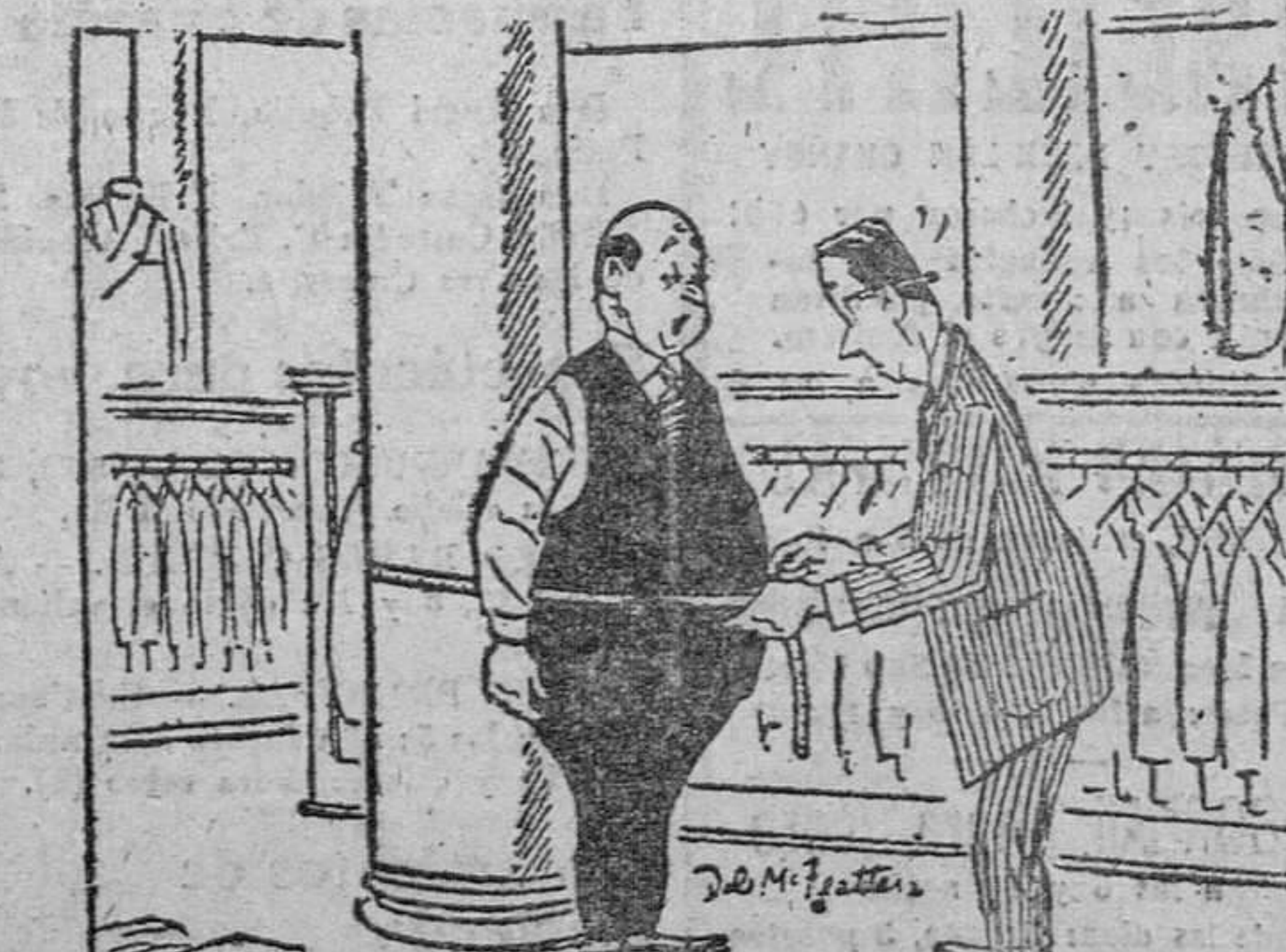
—¡Si no lo estuviera viendo, no podría creerlo!