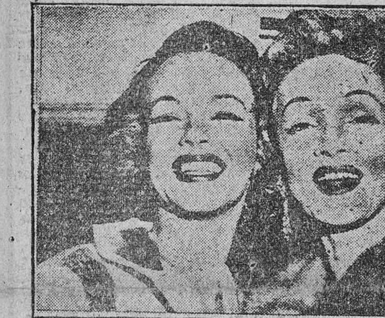
En este caso, la similitud entre las señoras, tiene completa aplicación en este caso, en el que Marlene Dietrich y su hija aparecen juntas después de haber estado en un espectáculo de televisión en el que está trabajando.