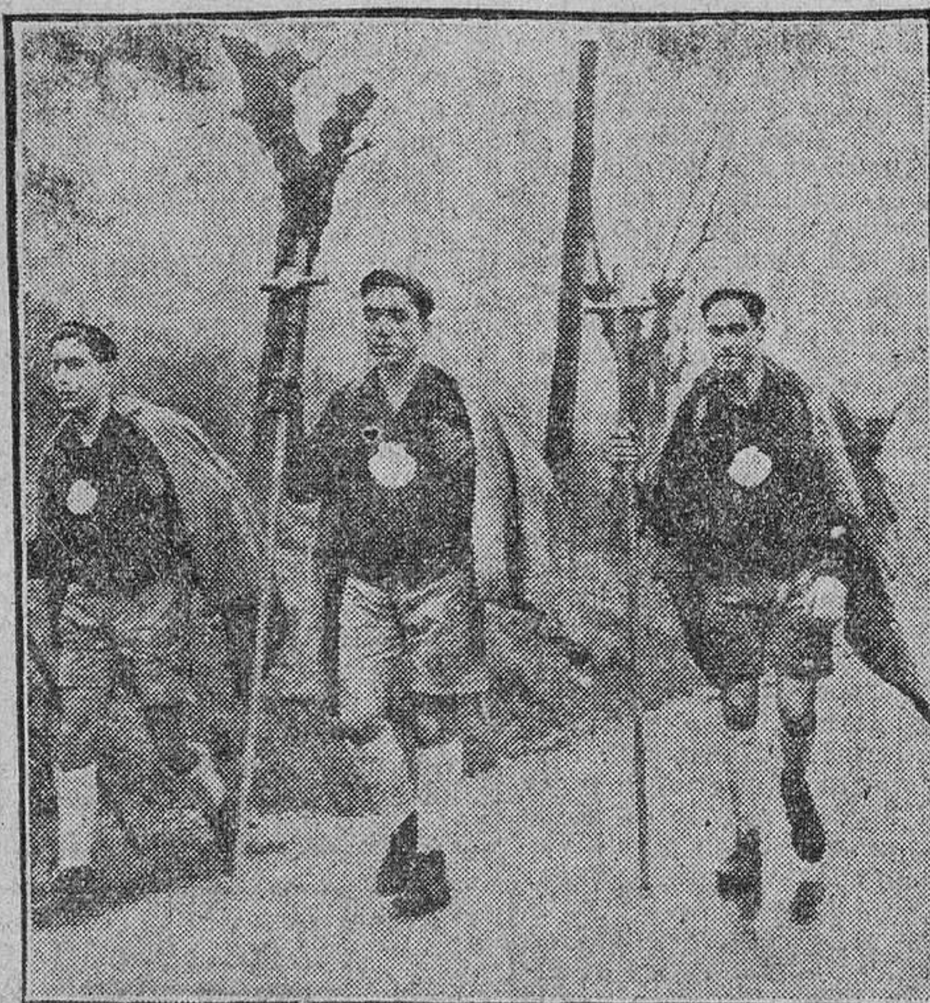
Tres muchachos del Frente de Juventudes de Bilbao han emprendido la peregrinación a pie, por la costa, a Santiago de Compostela, para ganar el Jubileo del Año Santo. El recorrido, de 660 kilómetros, lo harán en 27 etapas.