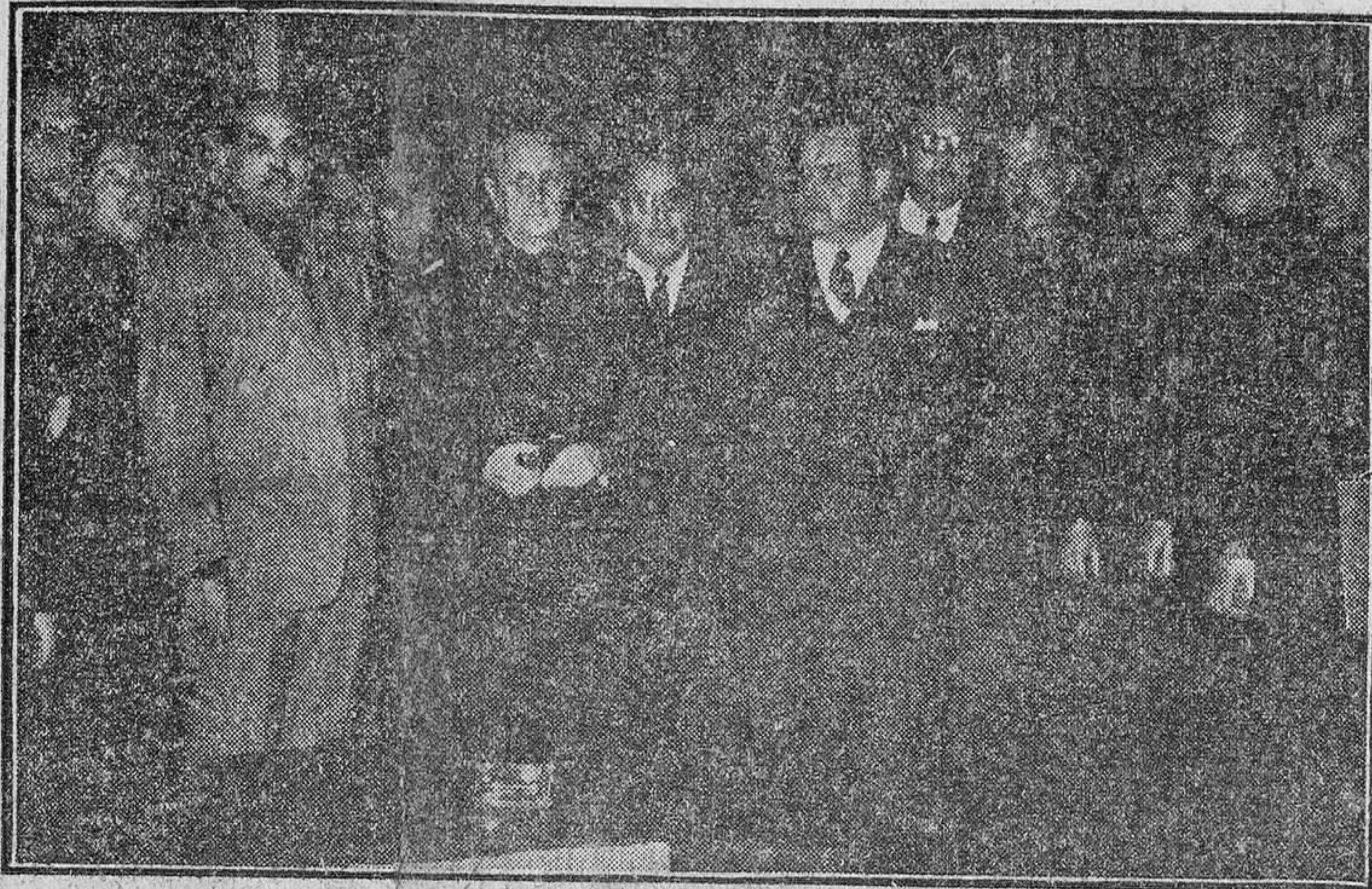
El Ministro Secretario General del Movimiento, Ramón Fernández Cuesta, con el Delegado Nacional de Sindicatos, en el acto de dar posesión a los nuevos jefes nacionales de Sindicatos, celebrado en la Delegación Nacional.

Toman posesión los nuevos mandos sindicales