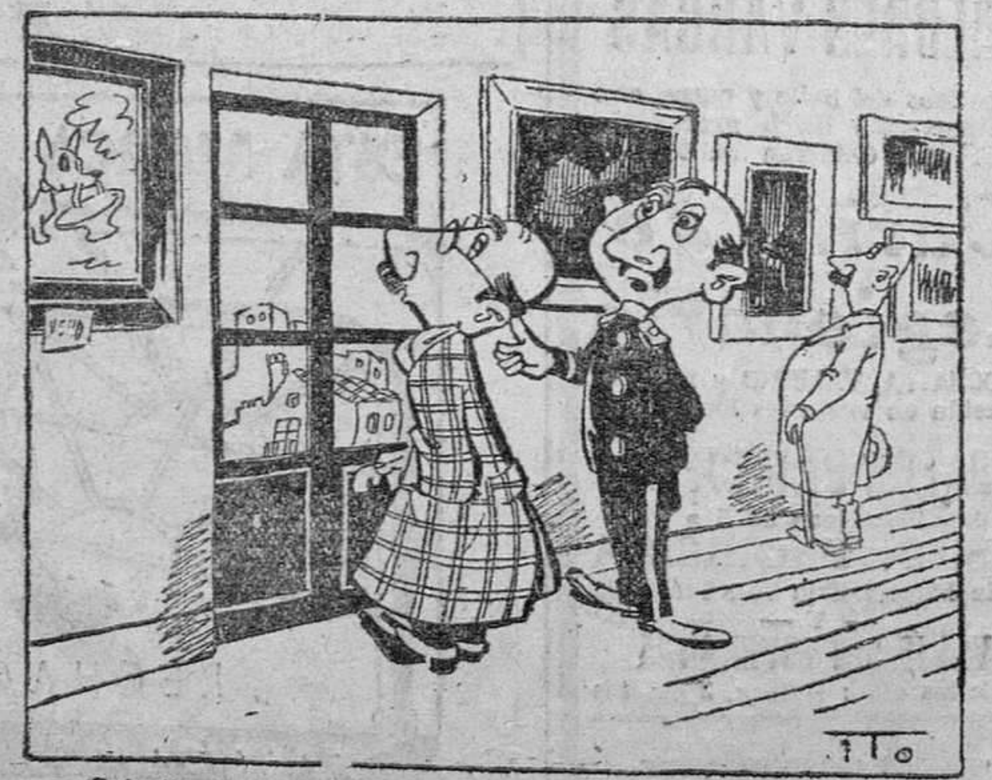
—Caballero, le advierto que esto es el balcón.