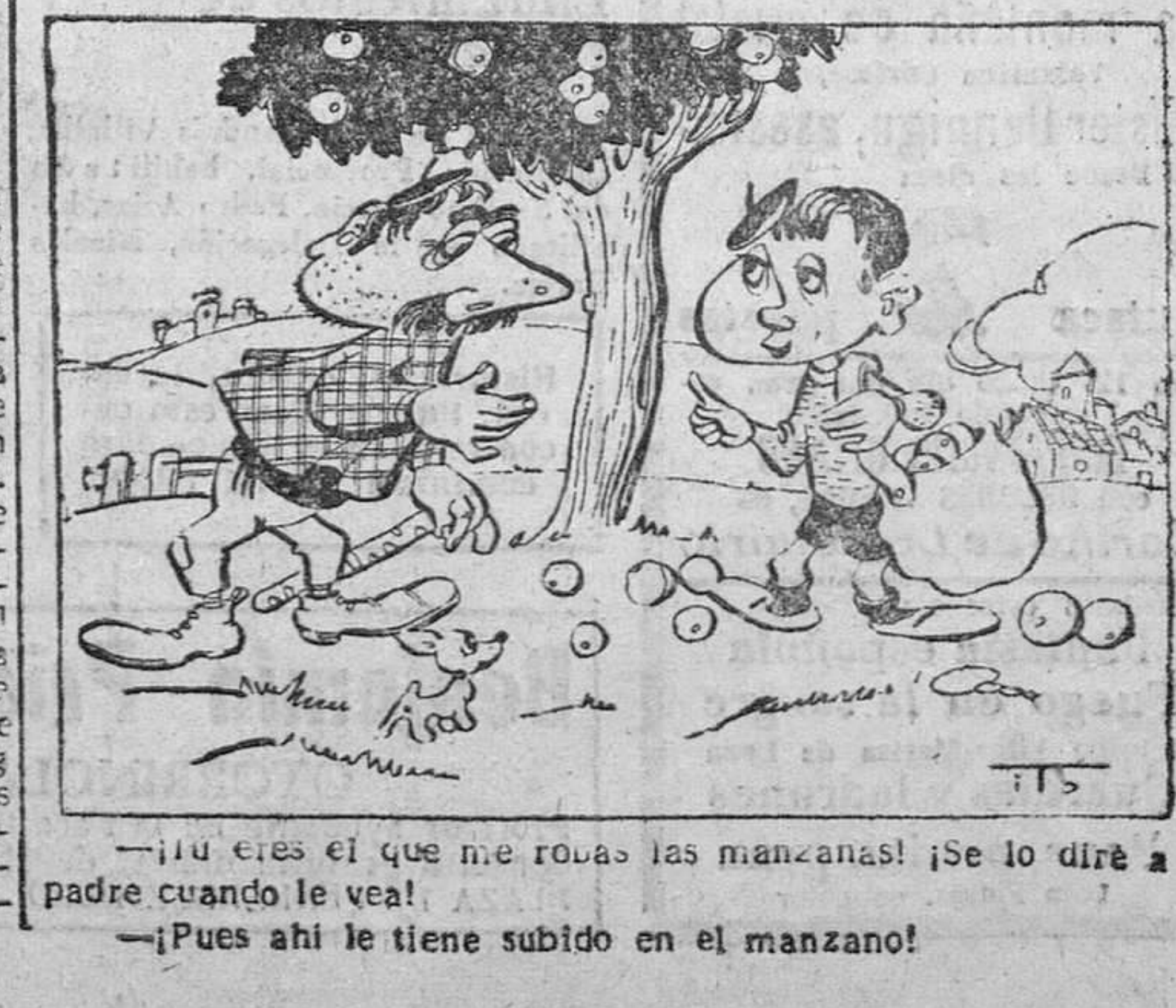
—¡Tú eres el que me robas las manzanas! ¡Se lo diré a tu padre cuando le vea! —¡Pues ahí le tiene subido en el manzano!