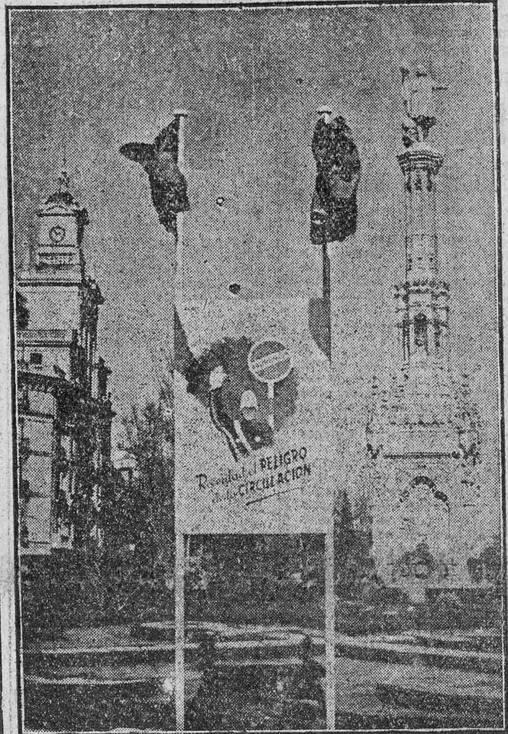
Seguindo la Campana de la Prudencia en la circulación, el Ayuntamiento, entre otras propagandas, ha colocado en las principales calles y plazas de Madrid carteles con dibujos alusivos a la Campana.