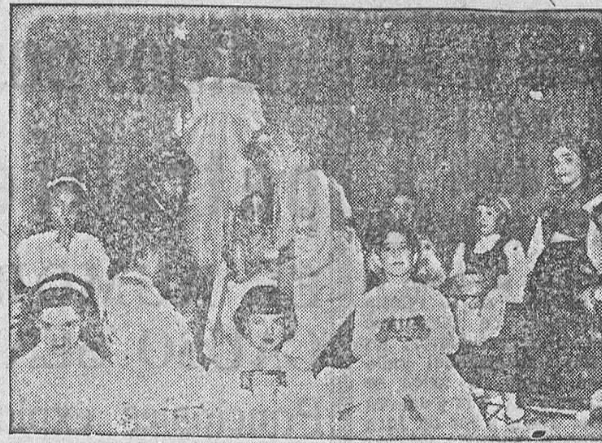
"Estampa de Navidad".

Organizado por la Rama de Mujeres de Acción Católica, y con objeto de recaudar fondos para las catequesis de adultos de nuestra ciudad, se celebró el pasado día 28, a las siete y media de la tarde, en el salón de actos del Colegio del Corazón de María, una brillante fiesta de arte en la que tomó parte activa un escogido grupo de niñas pertenecientes a distinguidas familias zamoranas.