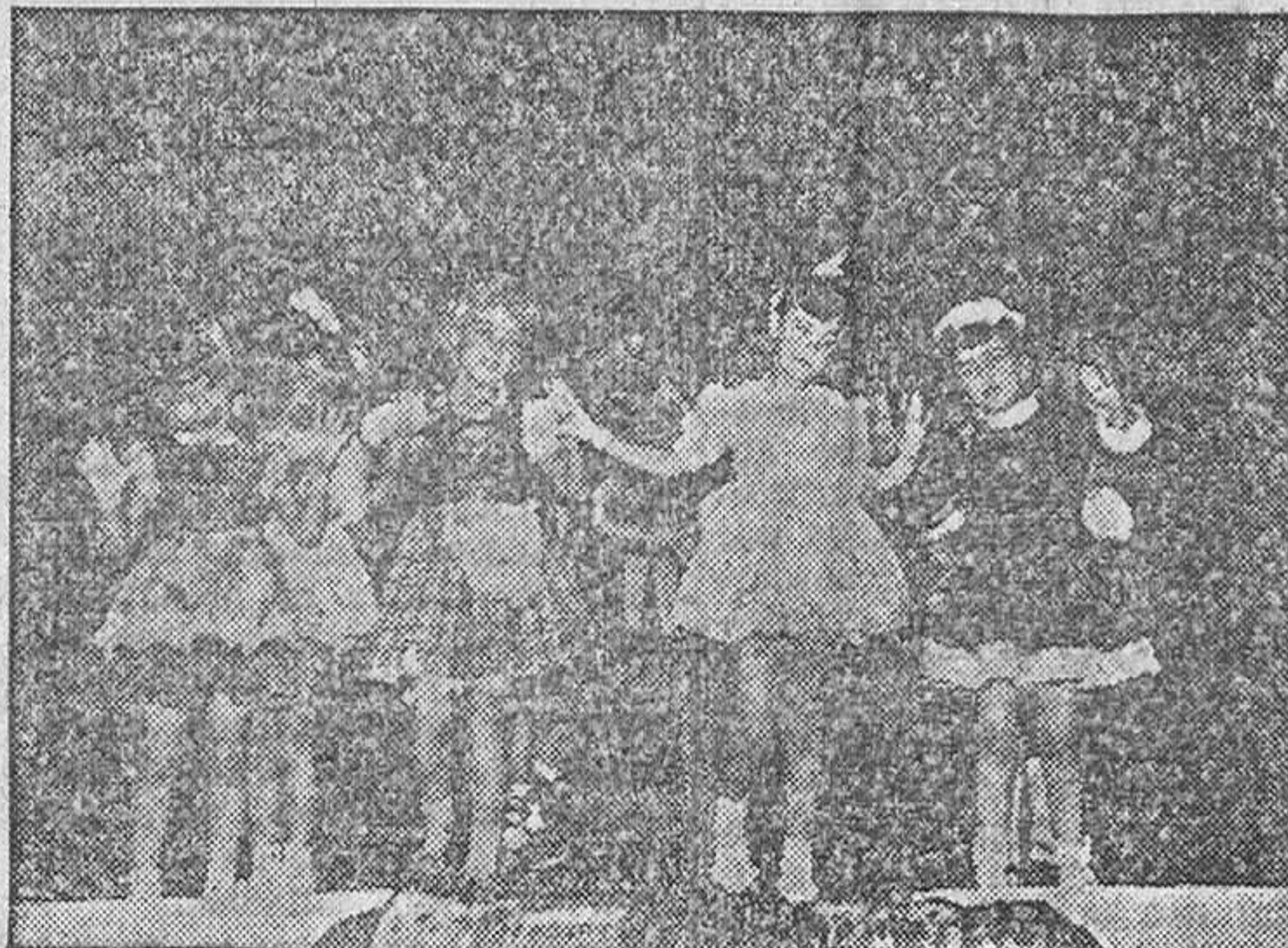
Un momento del "Baile de las muñecas".