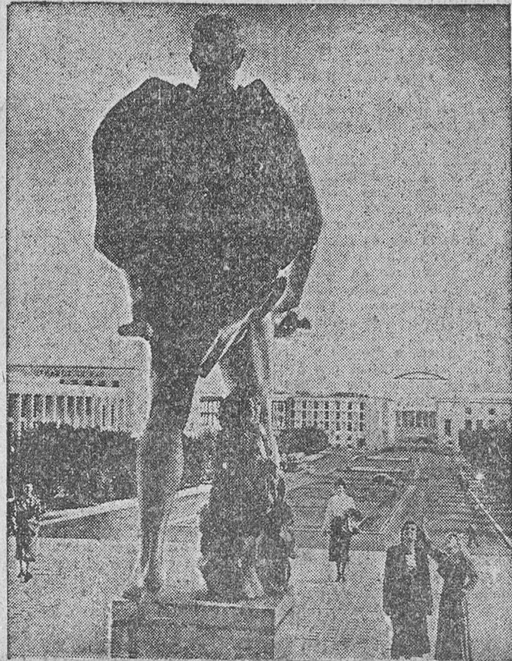
En estos últimos años han sido reparados los grandes daños que la guerra ocasionó a los espléndidos edificios destinados a acoger la Exposición Universal de Roma (EUR) y que dentro de poco constituirán el centro de uno de los barrios más importantes de la ciudad.