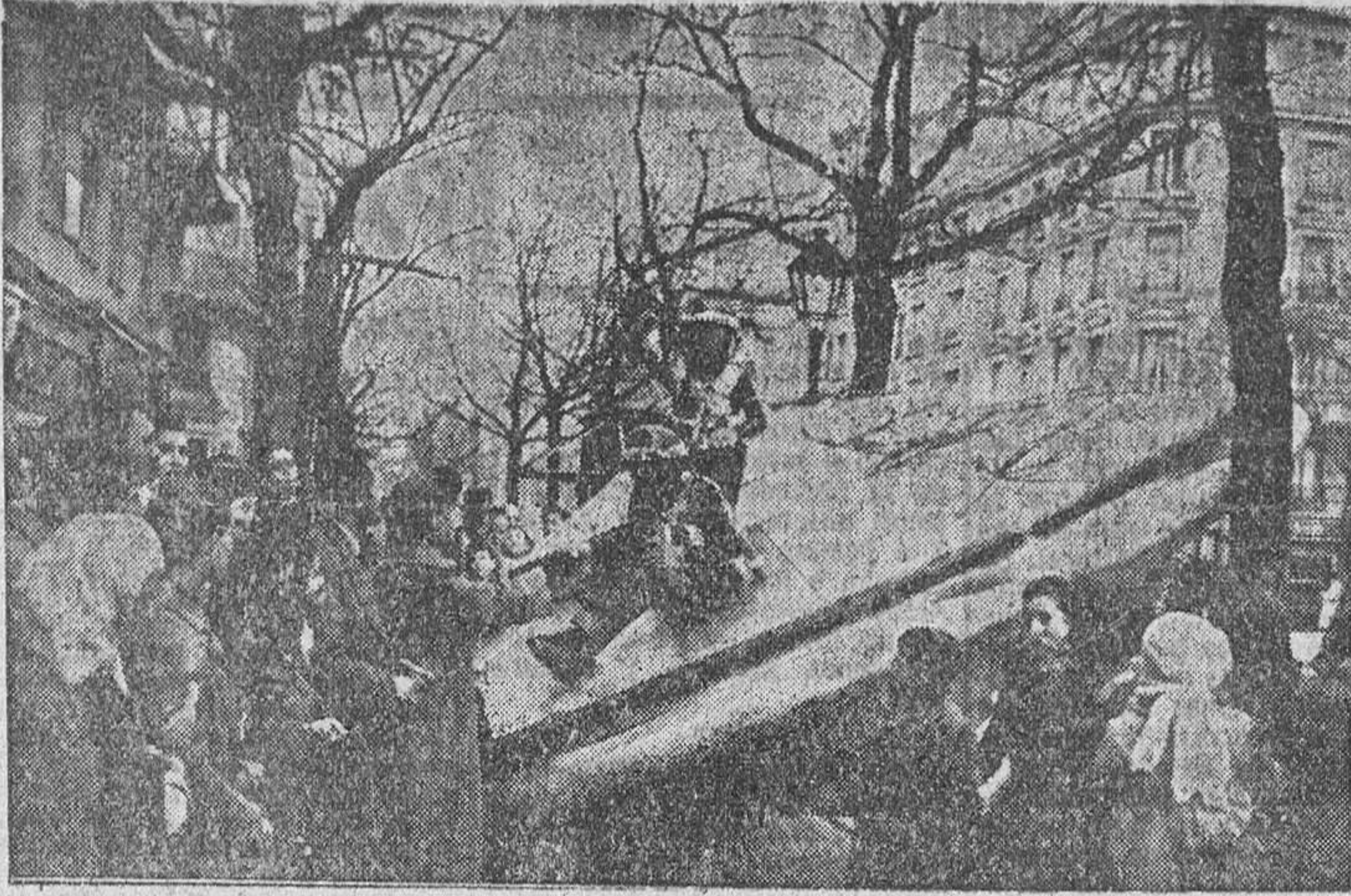
En plena calle de Narváez ha aparecido un platillo volante que con motivo de la fiesta de Inocentes contemplaron los madrileños con sus marcialos y todo.