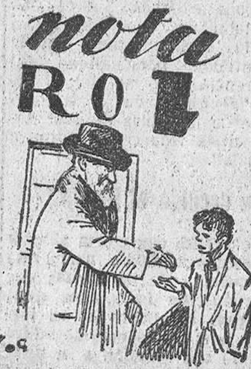
Solución al último jerooglífico: MAS TRABAJADOS

bre. 5: Letra griega. Reflexivo. Comparativo. 6: Animal salvaje parecido al bisonte. Nota musical. Dios egipcio. 7: Emperador de Rusia. Cerco de hierro. 8: Cajón de madera que recibe el agua que vierten los arcauces de la noria.