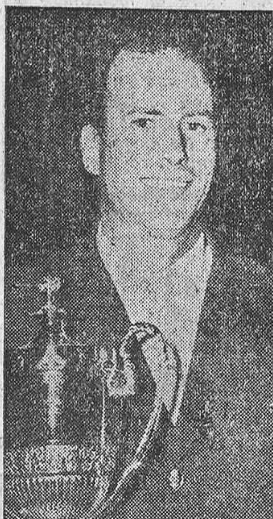
que Dennehy, pero a causa de la regla de permitir que sólo contara la mejor pareja de cada equipo, recibió solamente una mención honorífica. Montó sobre "Bohemio" en su primer recorrido y derribó dos barras, empatando con Dennehy a 16 faltas, pero el tiempo del español para ambos recorridos (1 minuto, 19 segundos y 8-10) era mejor que el del norteamericano (1'28"8-10).

Después de la puntuación de la última prueba, España va en cabeza con sólo cuatro faltas; segundo, Méjico, con 12 3/4; Es-tados Unidos, 16; Alemania, 28, y Canadá, 31.—Añfil.