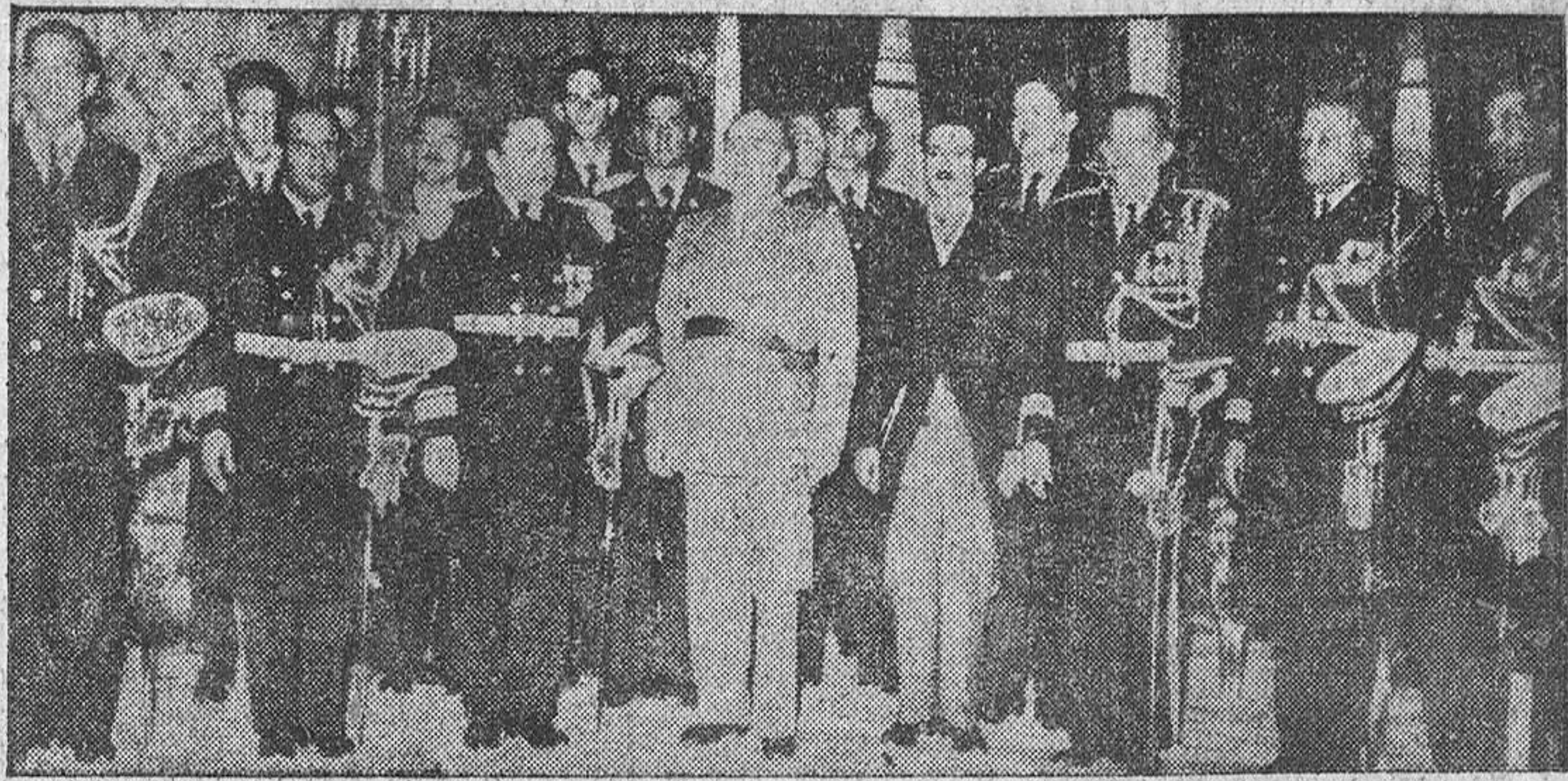
Su Excelencia el Jefe del Estado, Generalísimo Franco, recibe en el Palacio de El Pardo al contralmirante Lajara con los marinos de la Escuadra dominicana que han visitado los puertos españoles en viaje de "buena voluntad".