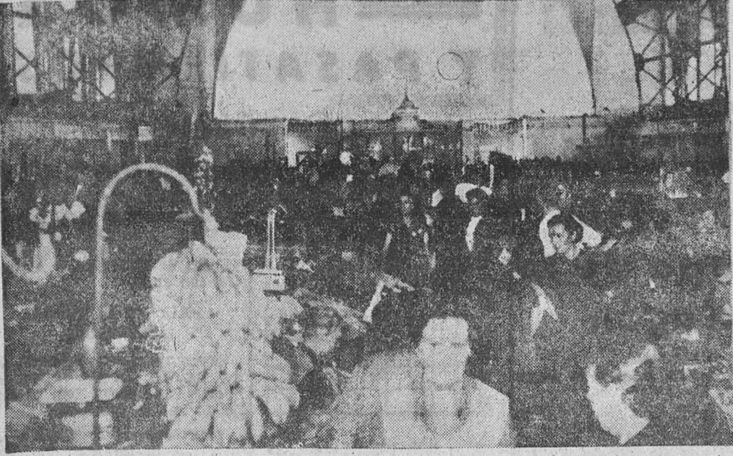
Ahora que se habla de que Zamora necesita un nuevo Mercado de Abastos, tiene actualidad traer aquí la necesidad que existe de reparar el que actualmente hay, a falta de un mejor piso, continúa en uno de los principales ventanales, limpieza de techo y otras muchas cosas más.