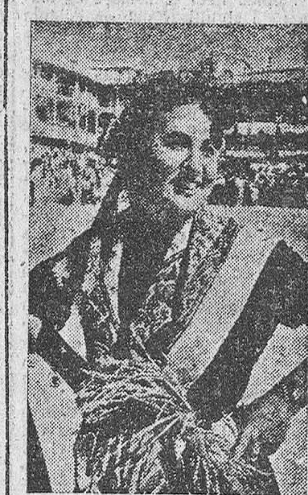
Una guapa muchacha de la villa de Chinchón posa para el fotógrafo en un momento de las fiestas allí celebradas con motivo del "Día de la Provincia" y organizadas por la Diputación madrileña.