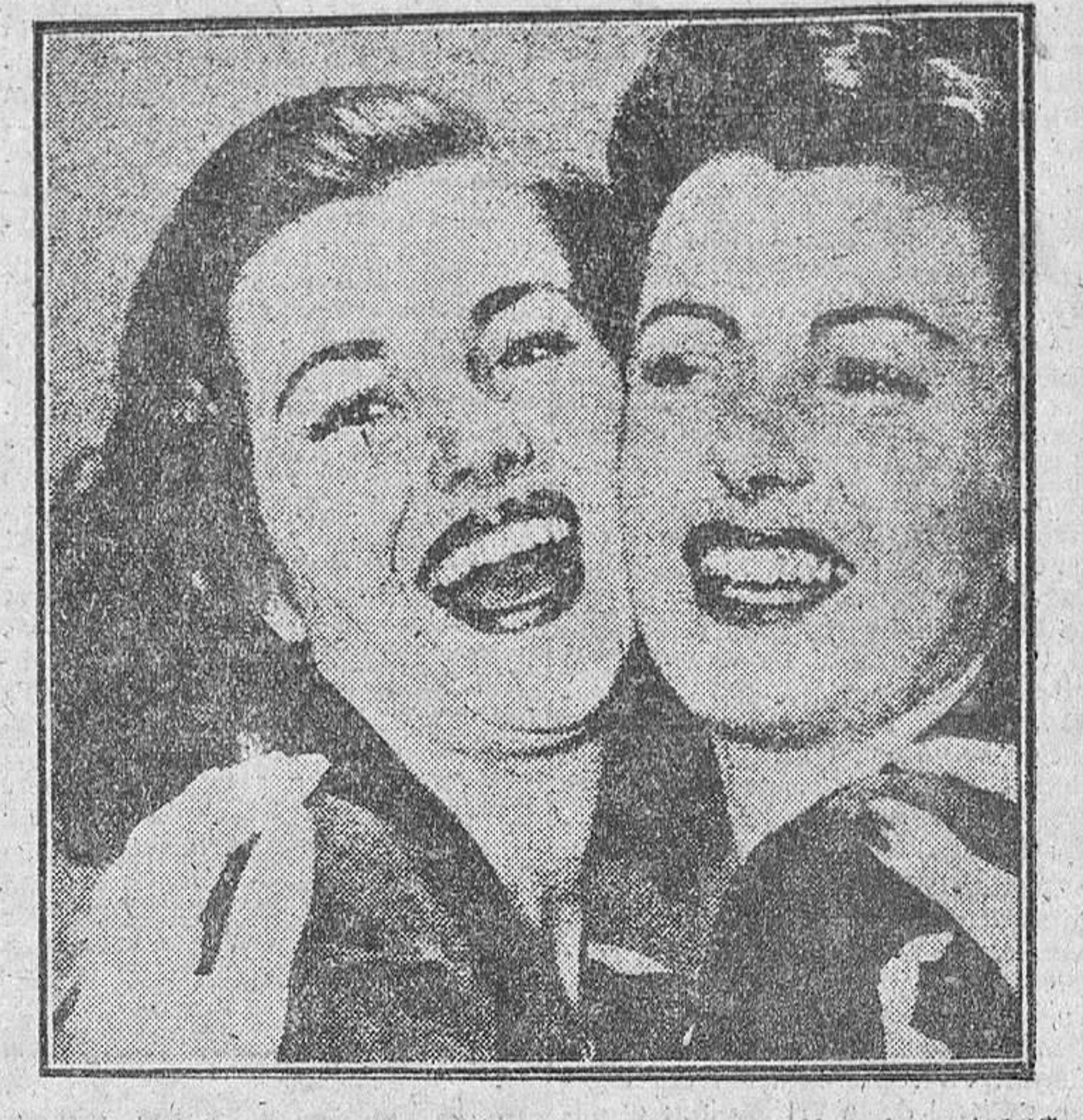
Relieve de guapas. La más guapa de Europa 1953 cede el trono a su sucesora en este abrazo con anchas sonrisas propias para anunciar el último dentífico. Sylviane Carpenier ha puesto ahora un dichoso final a su romance de amor.

Este es el final feliz de un romance de amor.