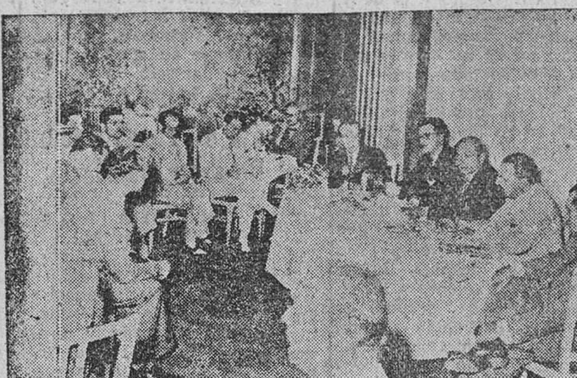
Ha llegado a Madrid el vicepresidente del Parlamento de la Alemania Occidental en Bonn, Richard Jaeger, quien recibió a los periodistas madrileños y celebró con ellos una conferencia de Prensa, en la que hizo importantes declaraciones.