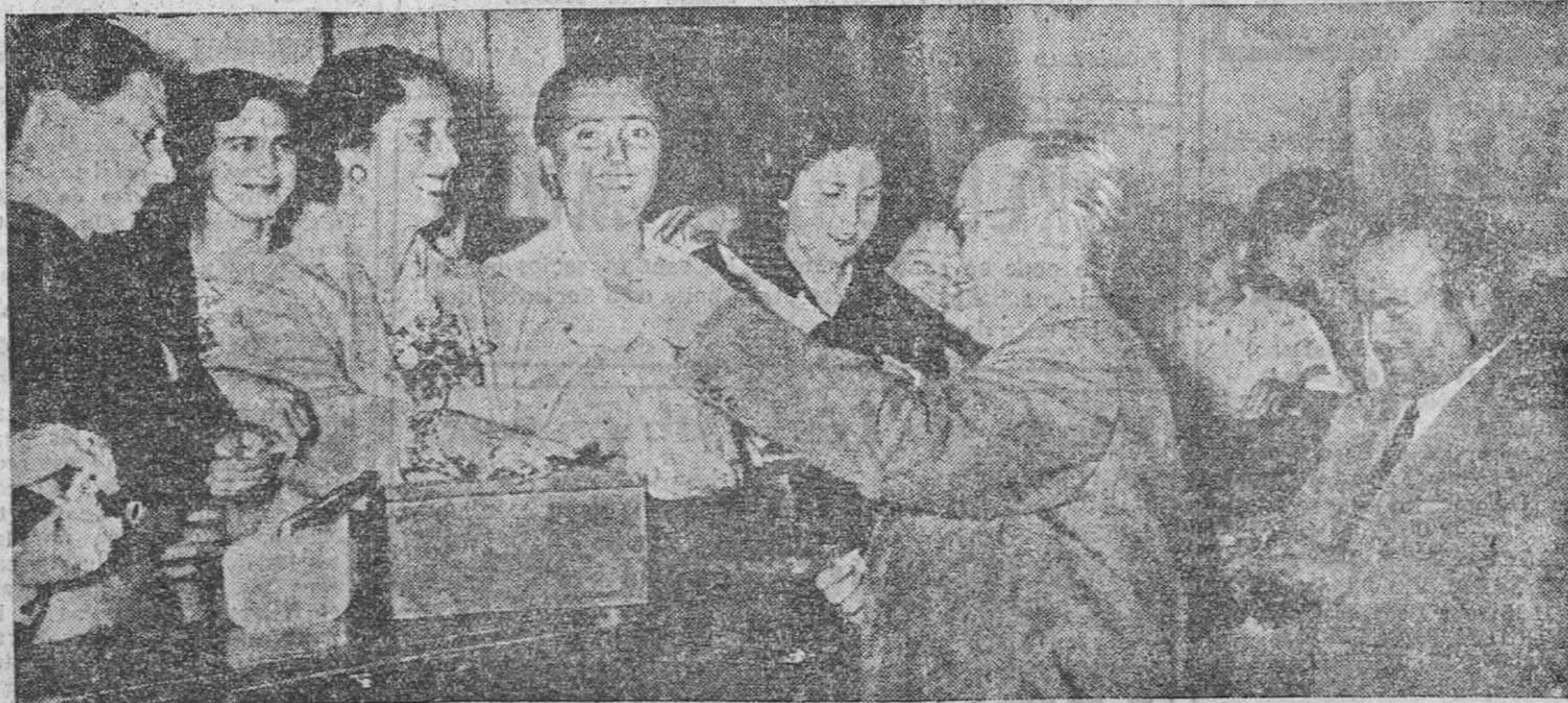
El gobernador civil y el alcalde de La Coruña adquieren boletos en la rúmbola de caridad de manos de la Excm. señora Doña Carmen Polo de Franco, que honró con su presencia dicha instalación benéfica.