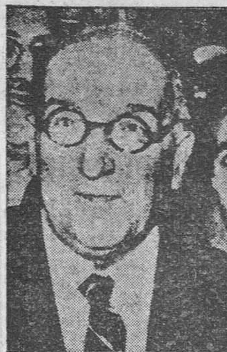
ADONE ZOLI, exministro de Justicia italiano, que ha sido nombrado presidente del partido cristiano-demócrata, en sustitución de Alcide de Gasperi, recientemente fallecido, que ostentaba, además, la jefatura del Gobierno de Italia.