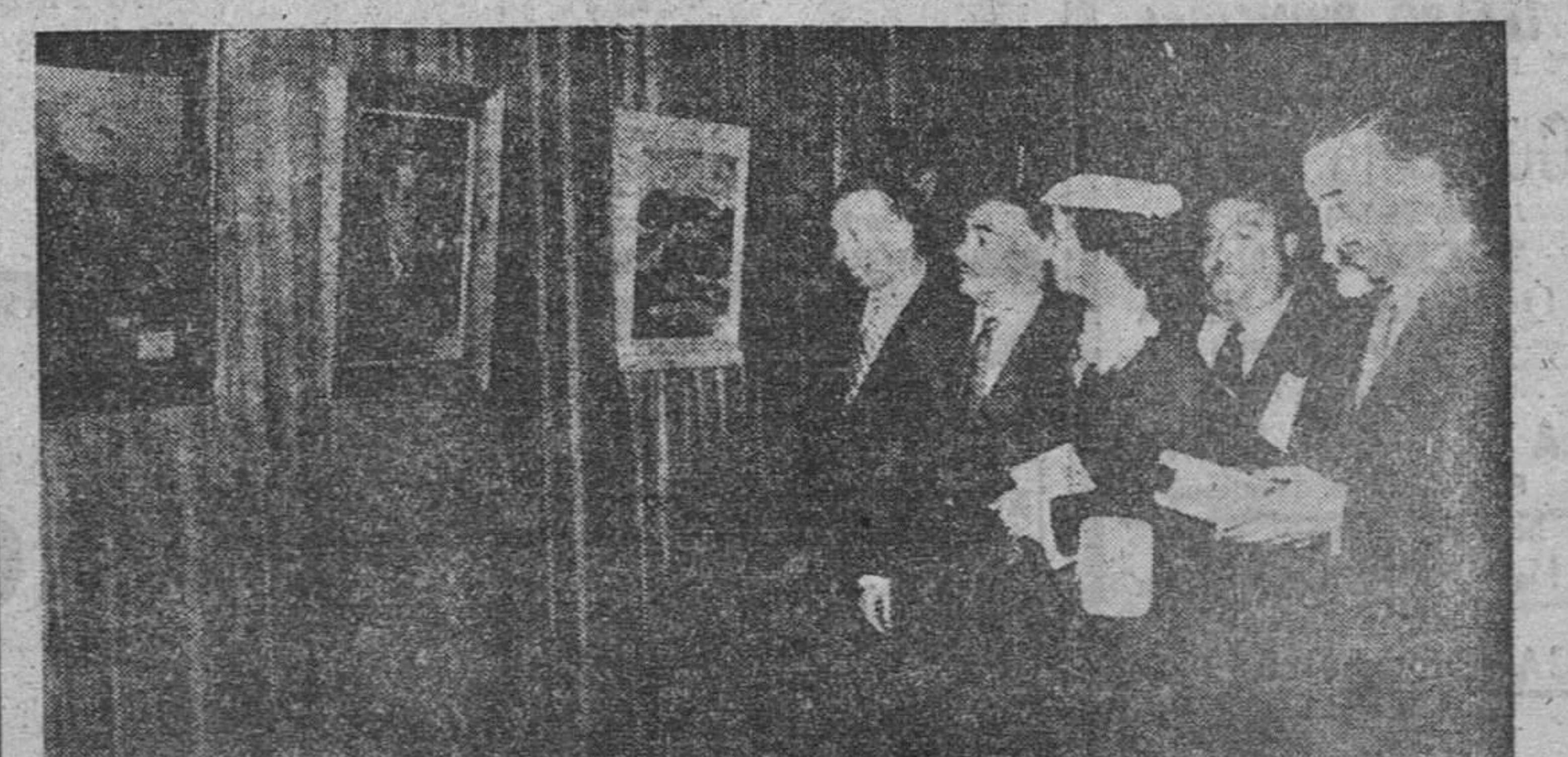
La esposa de Su Excelencia el Jefe del Estado, doña Carmen Polo de Franco, con el gobernador civil, alcalde de la ciudad y jefe nacional de Educación y Descanso, en una visita a la exposición que esta Obra ha organizado en San Sebastián.