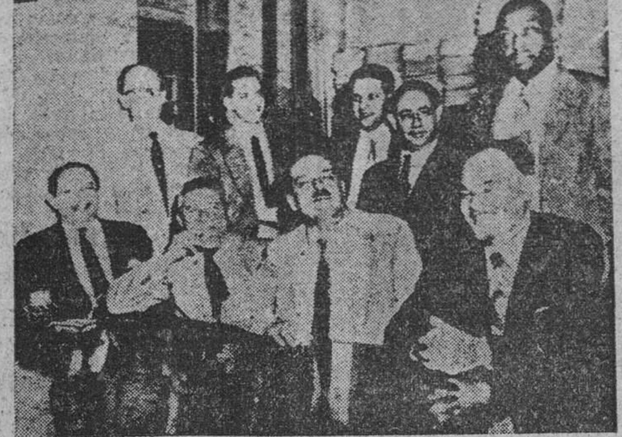
Estos son los comunistas declarados culpables por el Tribunal Federal de Filadelfia, de enseñar y fomentar el derrocamiento del Gobierno por la violencia. Tras la sonrisa, to da una teoría del terror.