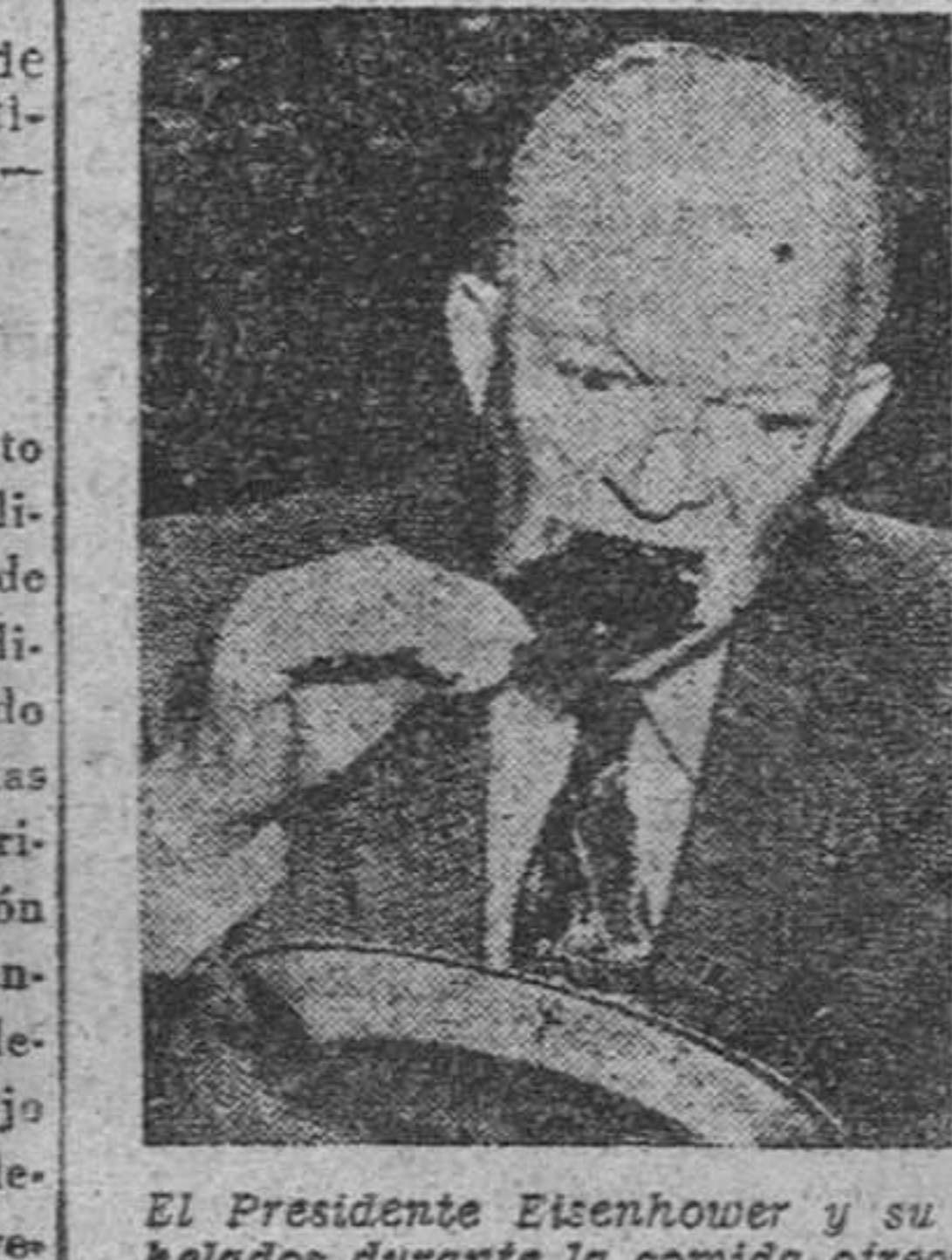
El Presidente Eisenhower y su esposa saborean sendos bombones helados durante la comita ofrecida a los ministros en Camp David (Maryland), en la montaña, lejos de Washington.