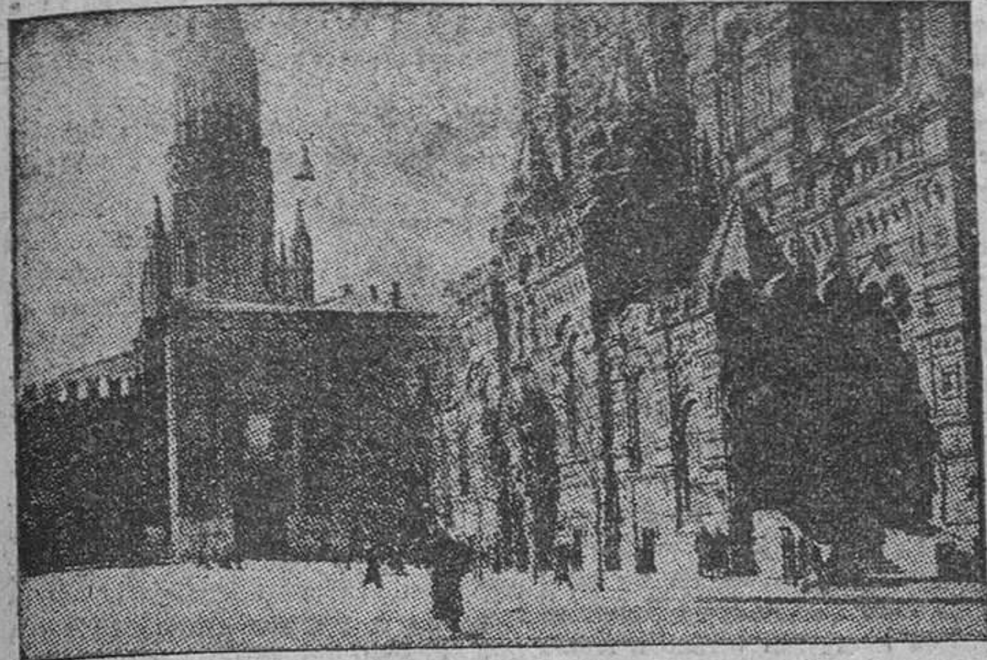
Una de las puertas del Kremlin.

Gozan de los mismos privilegios que en los países capitalistas no asequibles al proletariado ruso