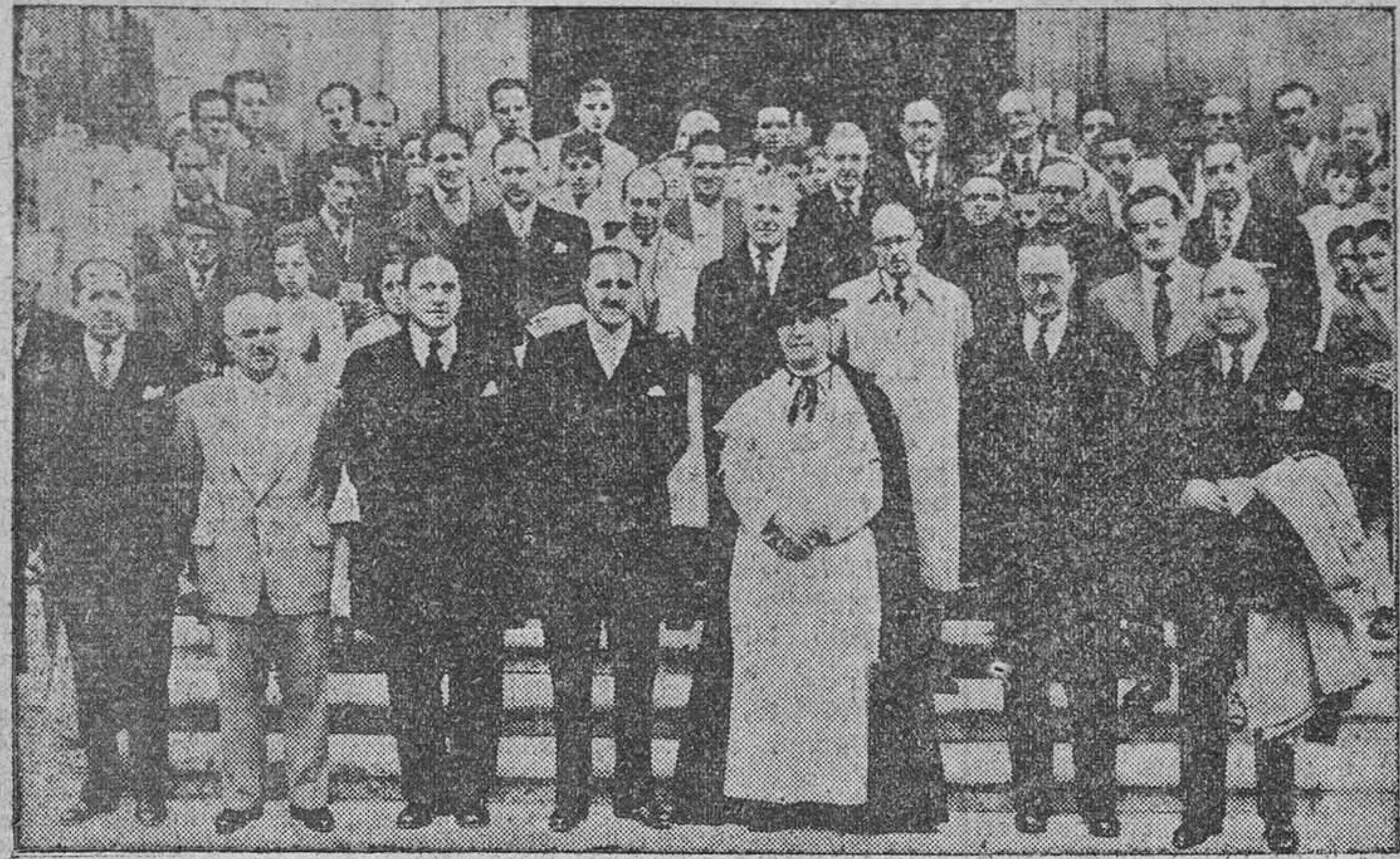
Autoridades que presidieron el acto.

En el acto final se dió lectura al mensaje de la Santa Sede