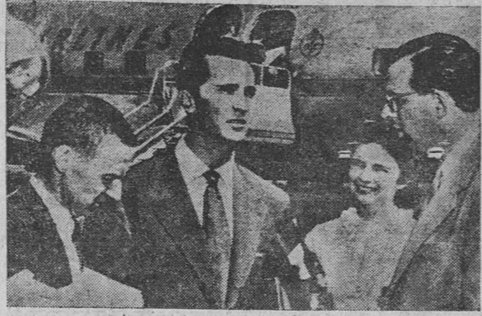
Esto es lo que Luis Miguel ha dicho en Nueva York respecto a Ava Gardner, con quien piensa reunirse...