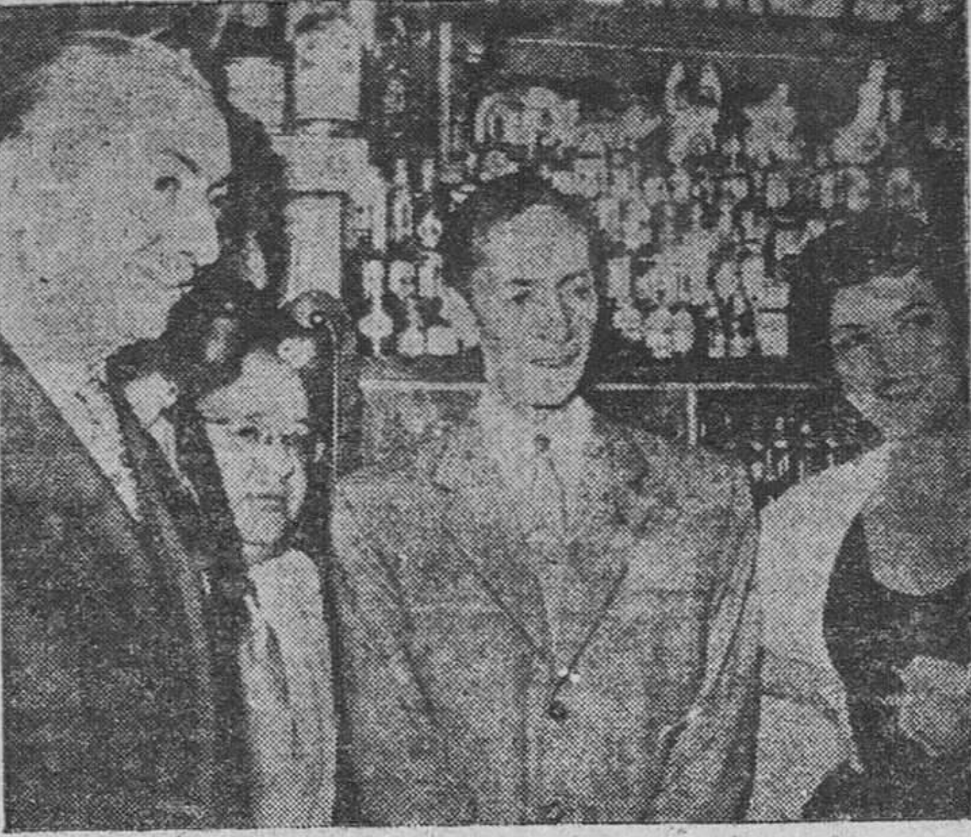
El popular compositor mejicano Agustín Lara visita el Museo de Bebidas de Chicote. Si esa visita es casi obligada a todo viajero importante, con más razón en el caso del autor del famoso cholito.