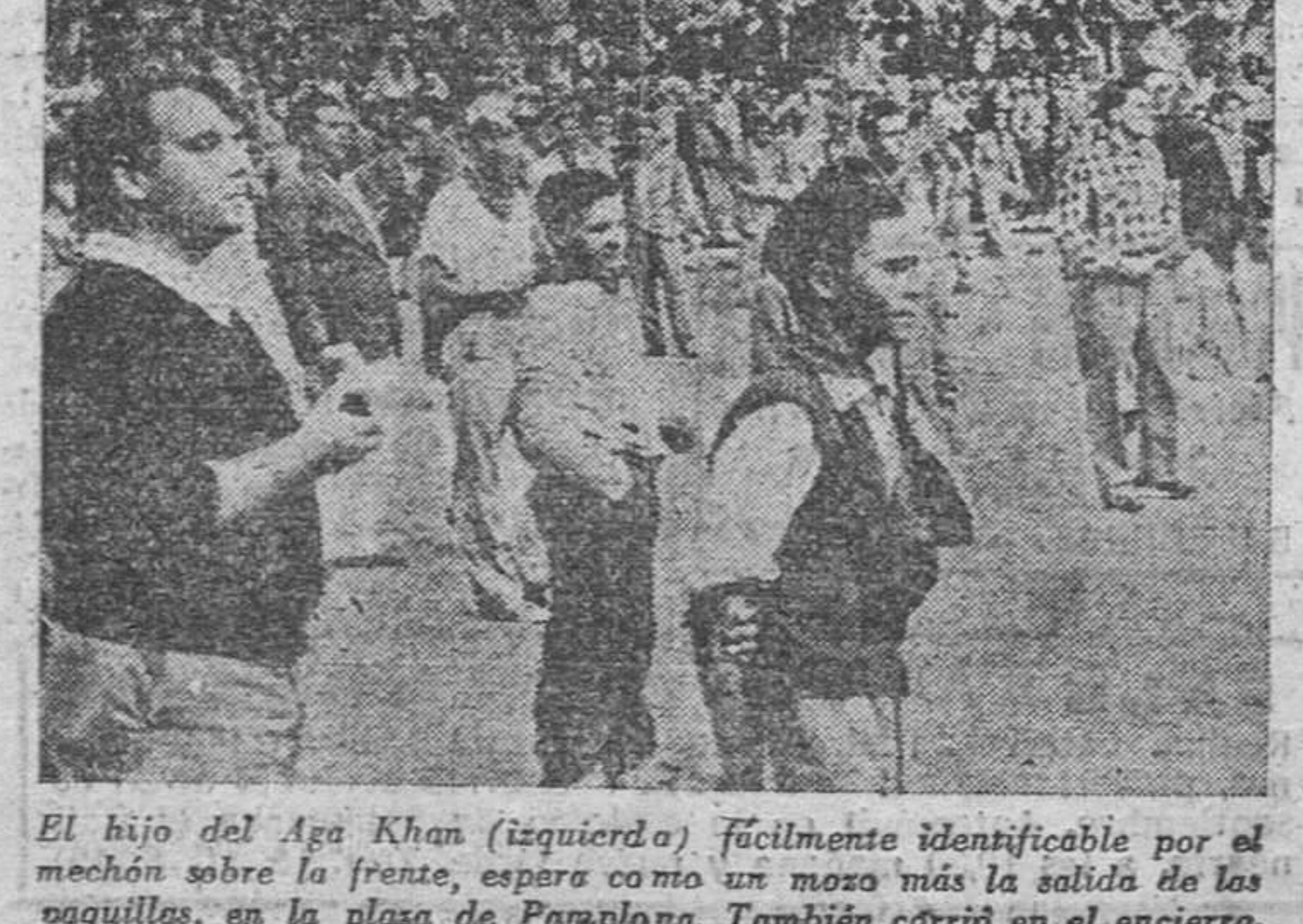
El hijo del Aga Khan (izquierda) fácilmente identificable por el mechón sobre la frente, espera como un mozo más la salida de los vaquillas, en la plaza de Parapón. También corrió en el encierro.