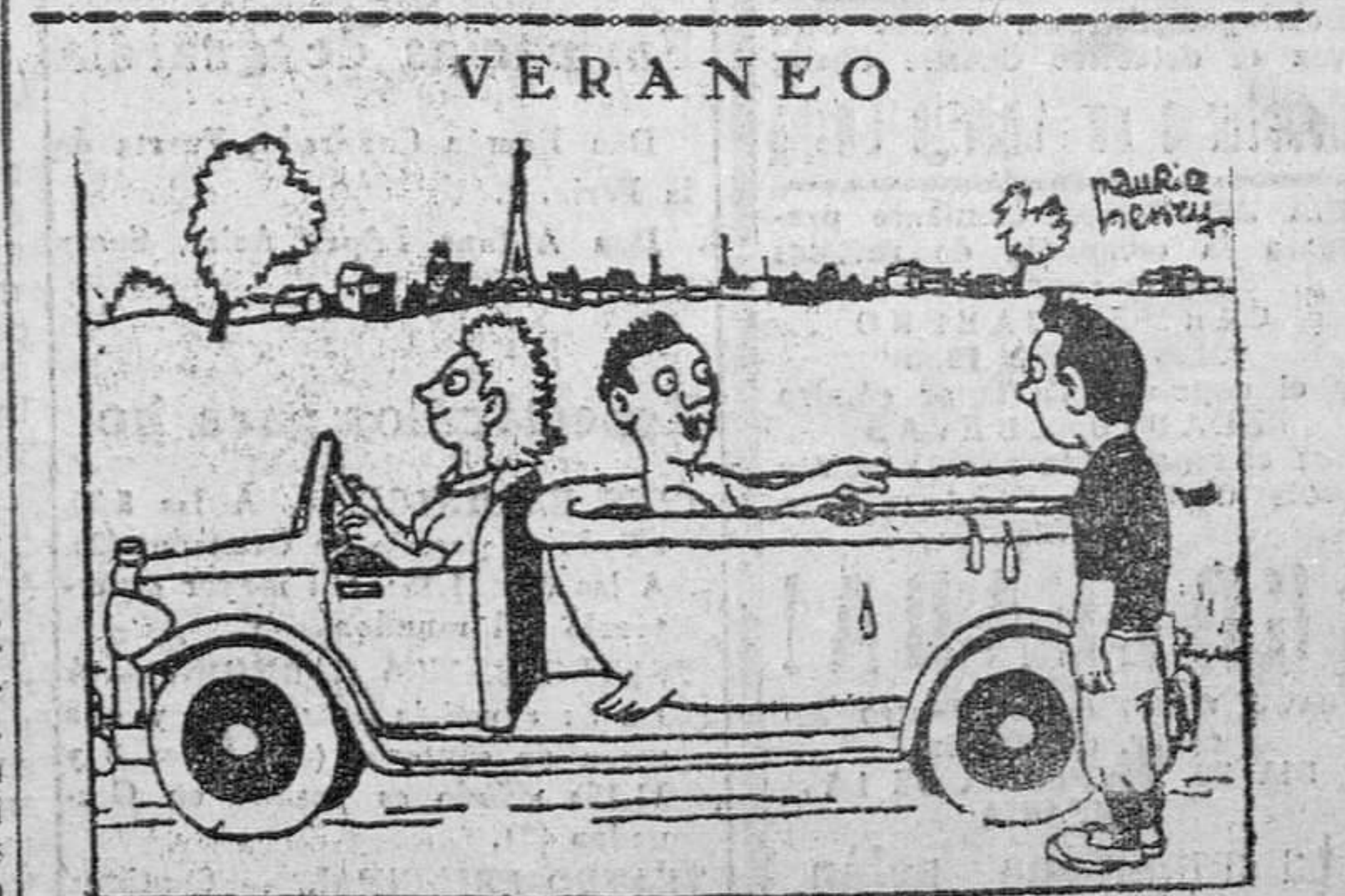
—Así, en cualquier sitio nos podemos bañar.

Londres, 24.—En el avión "Canopus" han salido en viaje a Washington el primer ministro británico, sir Winston Churchill, y el secretario del Foreign Office, Anthony Eden. Se espera lleguen a la capital norteamericana a las nueve de la mañana del viernes.—Efe.