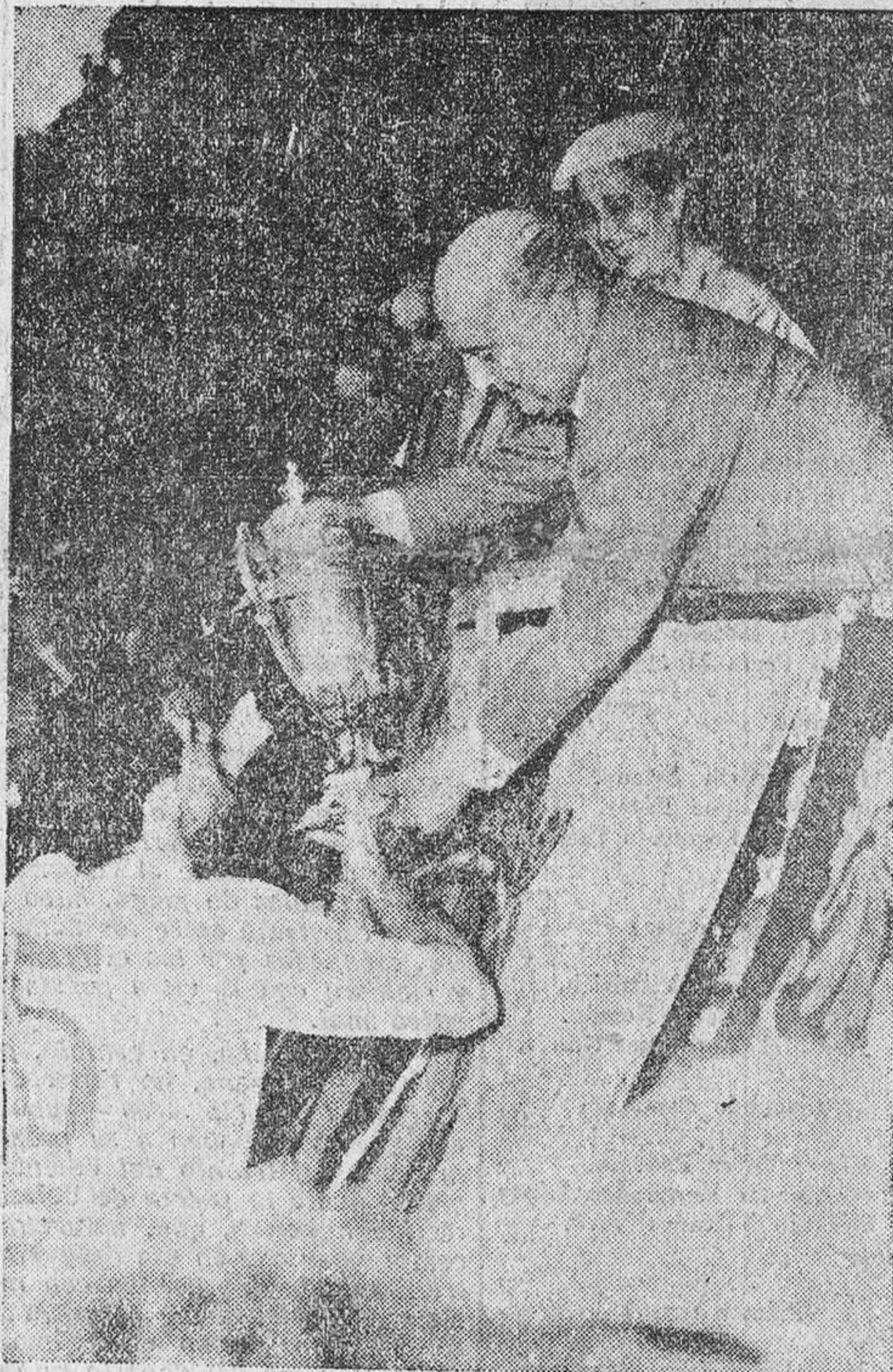
S. E. el Jefe del Estado entrega al capitán del Valencia el Trofeo conquistado brillantemente frente al Barcelona.

Madrid.—(Crónica de RAMON MELCON).—Cuando S. E. el Jefe del Estado hacia entrega a Monzó, capitán del equipo del Valencia, del trofeo ganado en el partido final del Campeonato, y el público, que casi abarrotaba el magnífico recinto deportivo, hacia objeto de una crujida ovación a los vencedores, no era sólo al Valencia a quien se rendía tal homenaje; con el gran conjunto levantino podía decirse que lo recibía también el fútbol recio, práctico, eficaz y brillante a la vez, que el grupo de Mestalla había realizado sobre el terreno, y que era claro contraste del otro: flojo, negativo, sin alma ni entusiasmo, que había exhibido el Barcelona.