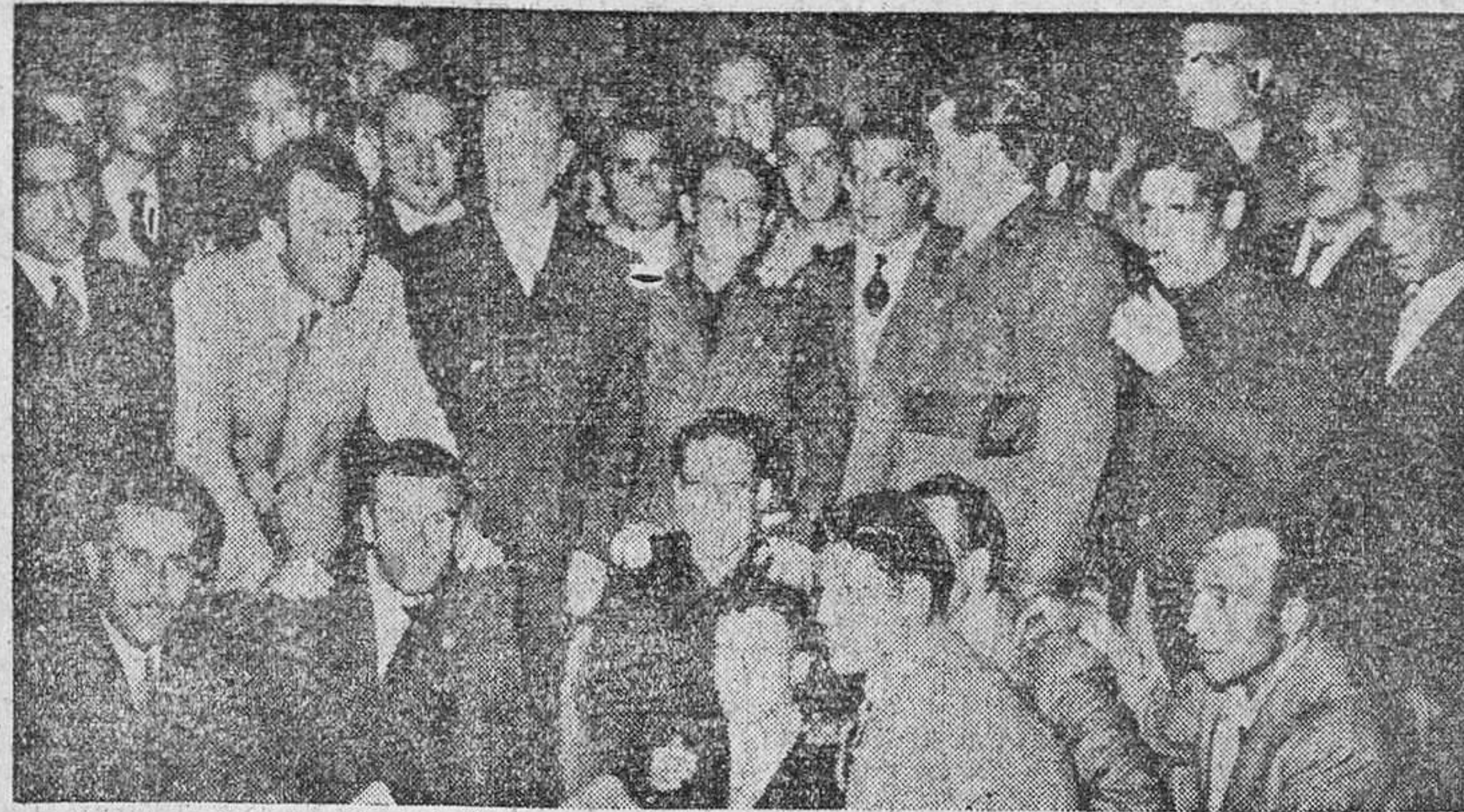
MADRID.—Con asistencia de los ministros Secretario General del Movimiento, Ejército, Asuntos Exteriores y Educación Nacional, el Ayuntamiento rinde homenaje a los camaradas de la División Azul ex prisioneros de Rusia. Los ministros, rodeados de los camaradas de la División Azul, durante la recepción celebrada en su honor en el Ayuntamiento.