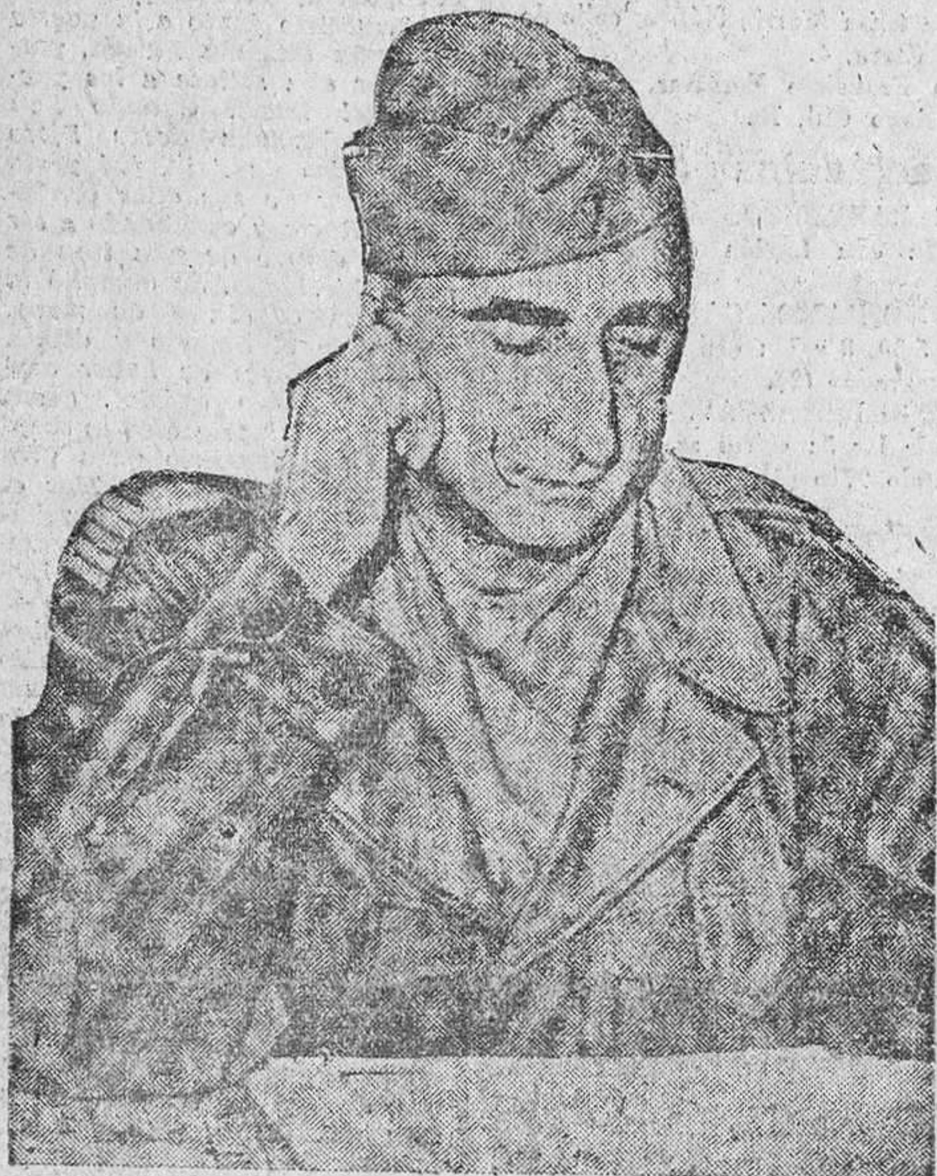
El héroe defensor de Dien Bien Fu, general De Costries.

Hanoi, 5. — Los rebeldes han reforzado durante la noche sus posiciones conquistadas ayer, y su radio dice que se encuentran, como ya se ha anunciado, a menos de 350 metros del puesto de mando de De Costries. Los proyectiles rojos han llegado esporádicamente a Dien Bien Fu durante la noche, dicen los funcionarios franceses para mantener a los defensores desconcertados. Un comunicado francés dice que los comunistas no han renovado su asalto durante la noche.—Efe.