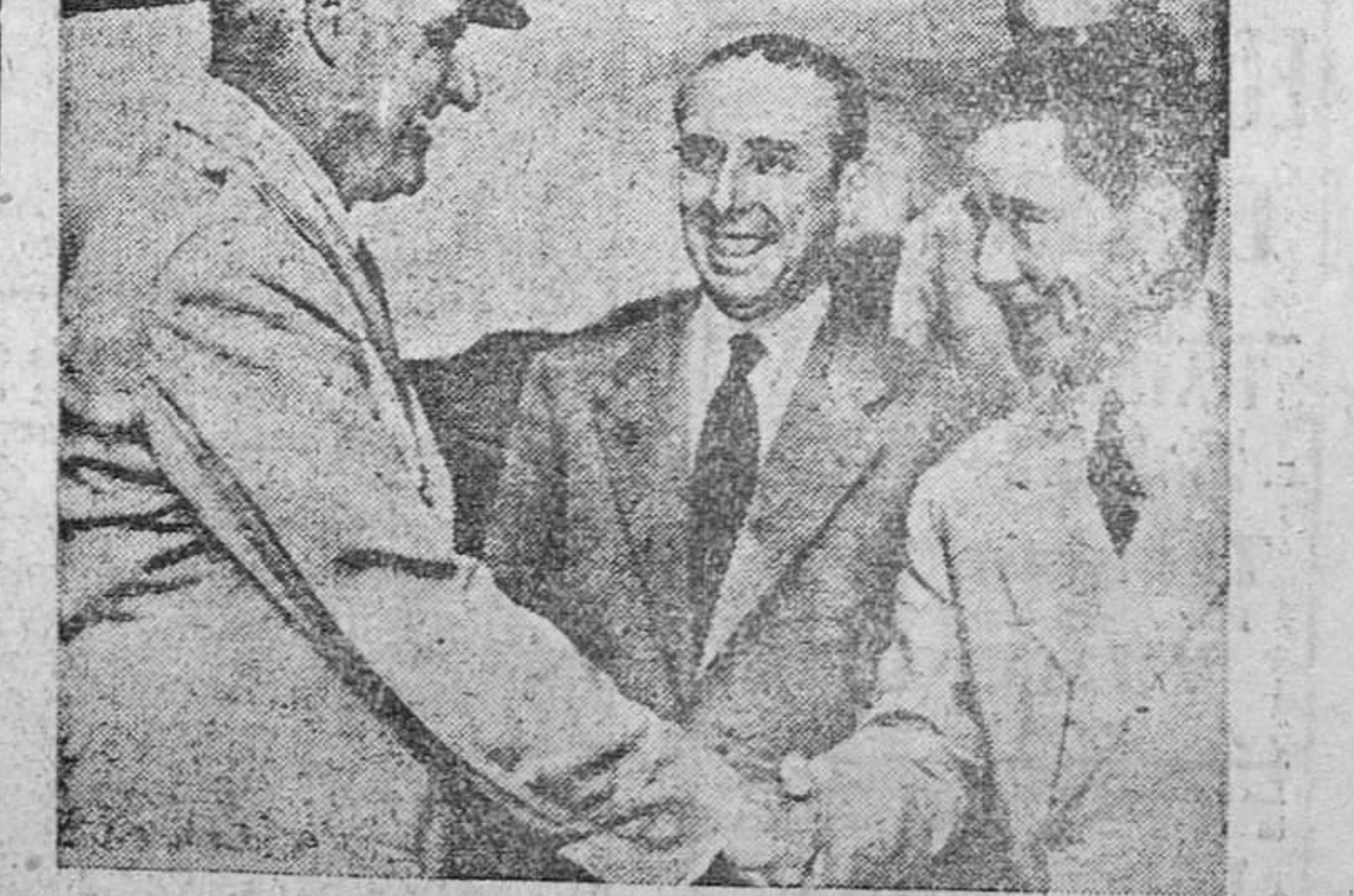
El general Twining, jefe del Estado Mayor de las Fuerzas Armadas americanas, estrecha cordialmente a mano del ministro español del Aire, que, acompañado del general Fernández Longoria, desembarca en el aeropuerto militar de Washington.