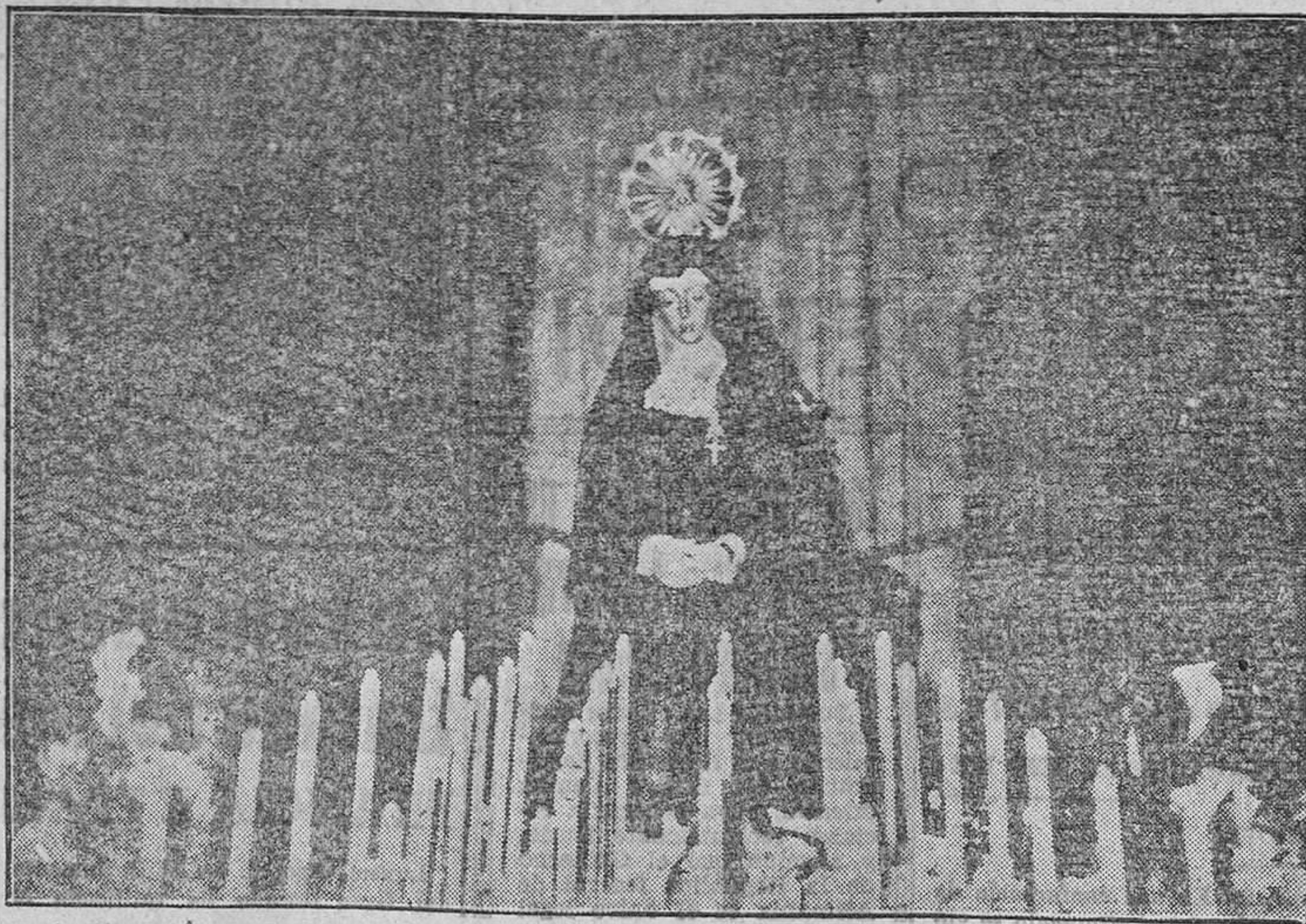
La gran solemnidad de rason está ya aquí, aunque el frío que hace iniciar a la primavera recién estrenada de a la ciudad un aire como decembrino. Con todo, la Semana Santa comienza pasado mañana y el domingo, con el desayuno, nuestros lectores recibirán el tradicional número extraordinario, que este año constará de ocho páginas, más un suplemento de diez, con portada a tres tintas. El número completo, de 24 páginas, se venderá al precio de DOS PSETAS y nuestros suscriptores lo recibirán completamente gratis.