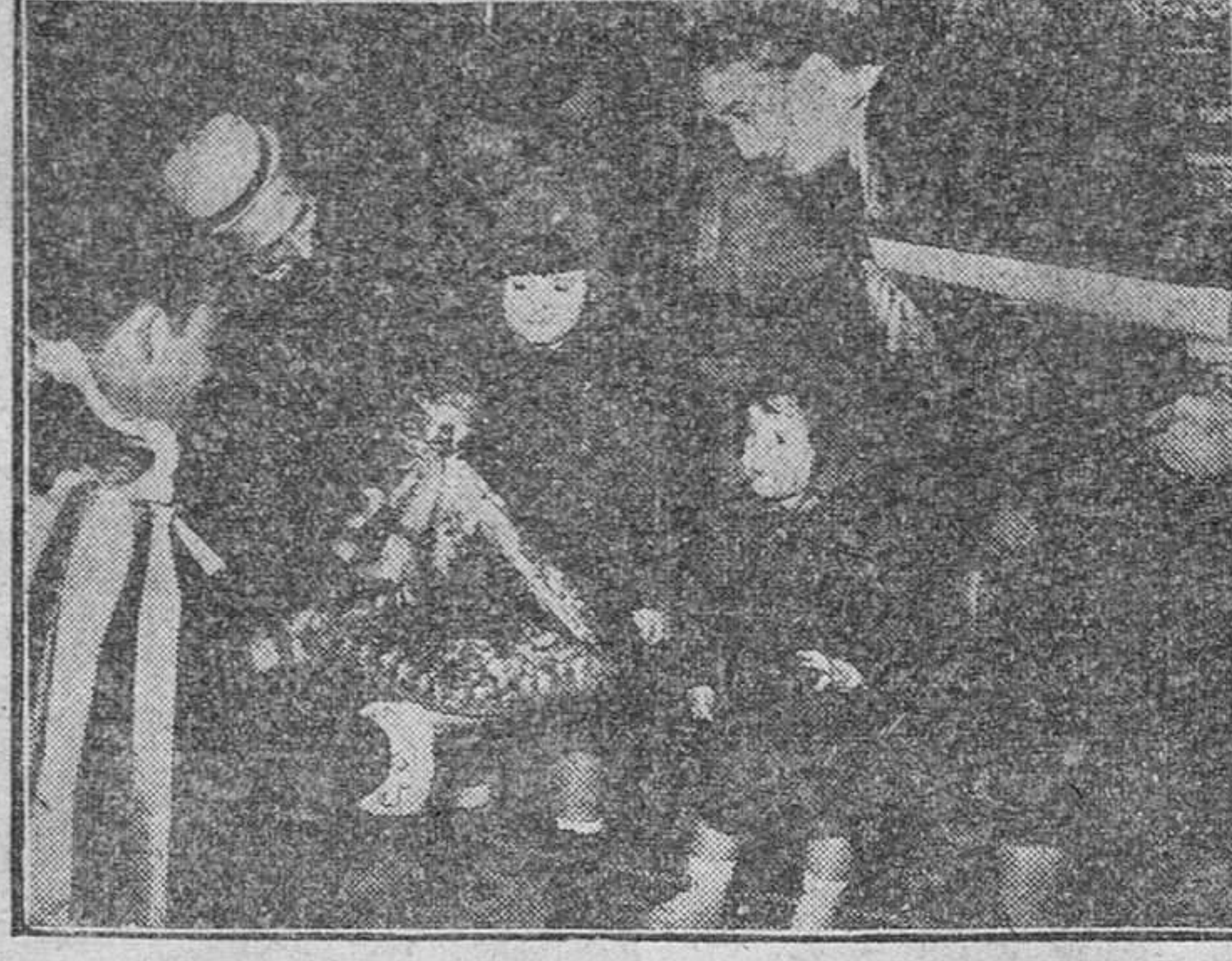
Ha terminado el Concurso Nacional de Tunas Universitarias del S.E.U. Antes de abandonar Madrid, la de Cúlvado visitó en el Palacio de El Pardo a la esposa y nietas de S. E. el jefe del Estado, ante las que dio un concierto. En la foto, los componentes de la Tuna ofrecen a las nietas del Caudillo regalos.