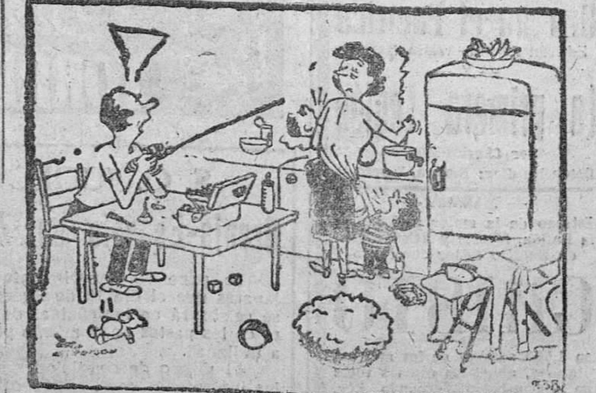
—No me extraña que te aburras: lo que necesitas es compartir en algo.