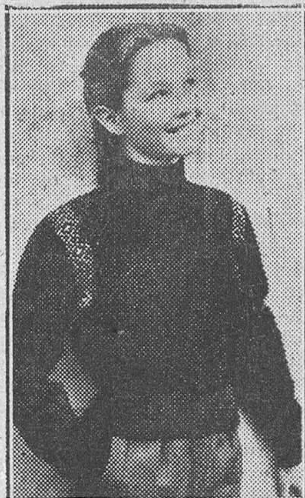
Un modelo de "jersey", muy apropiado para el deporte de nieve