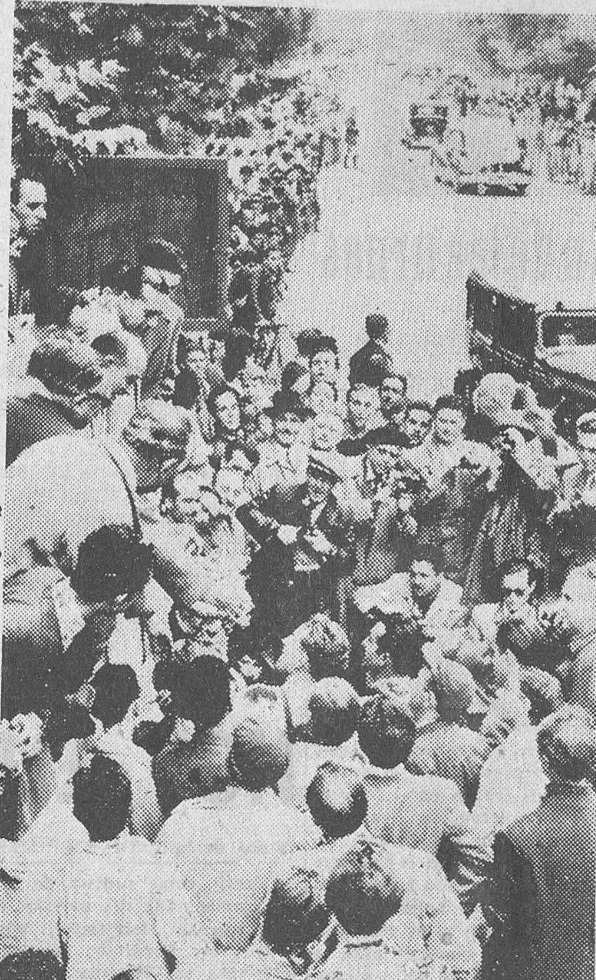
MADRID.—El equipo catalán, ganador del Campeonato de España de Ciclismo por Regiones en su VIII edición, en el momento de recibir los trofeos.