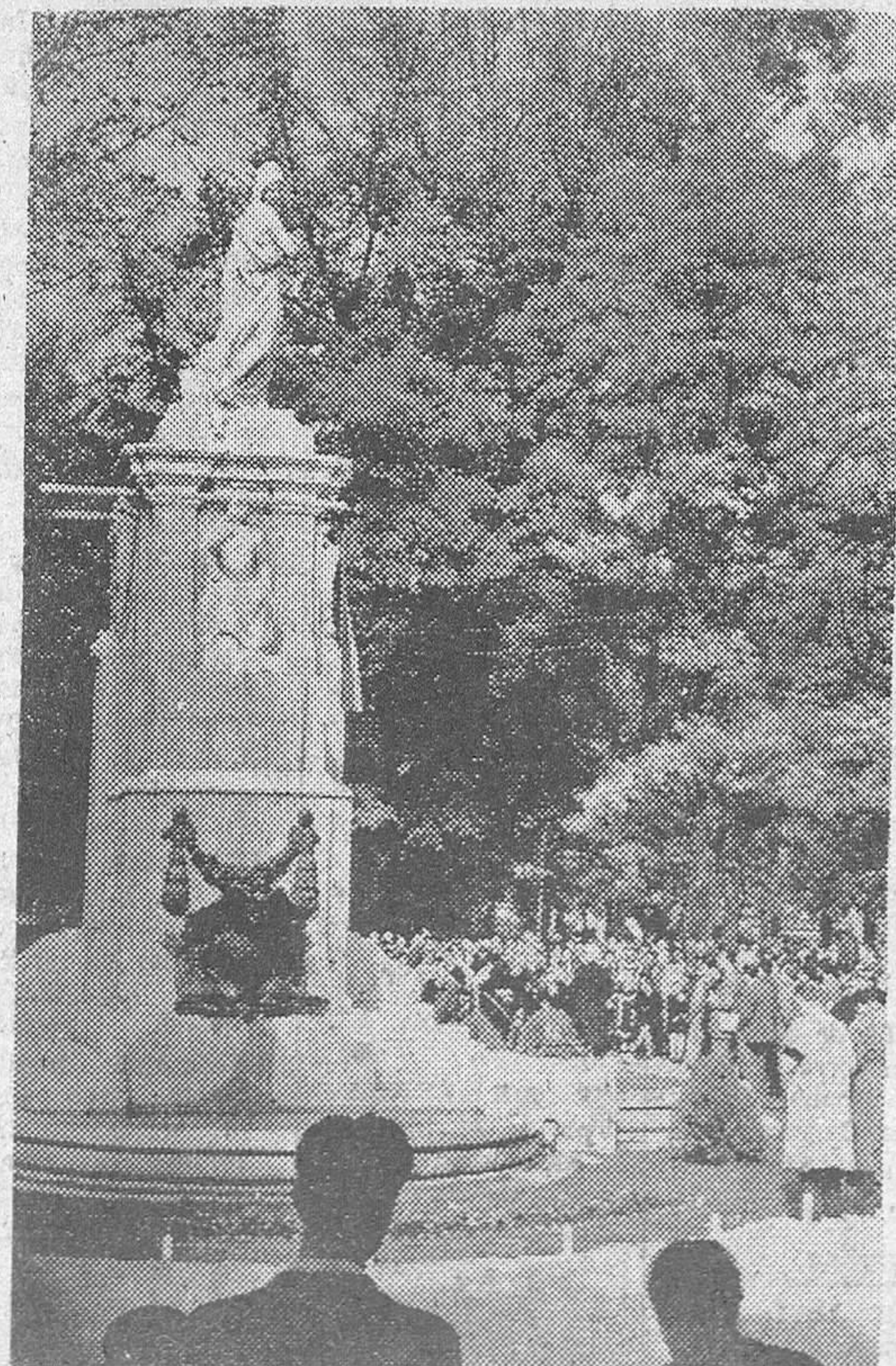
MADRID.—Monumento erigido a Cuba por el Ayuntamiento de Madrid en el paseo de coches del Retiro, para conmemorar el 460 aniversario de su descubrimiento.