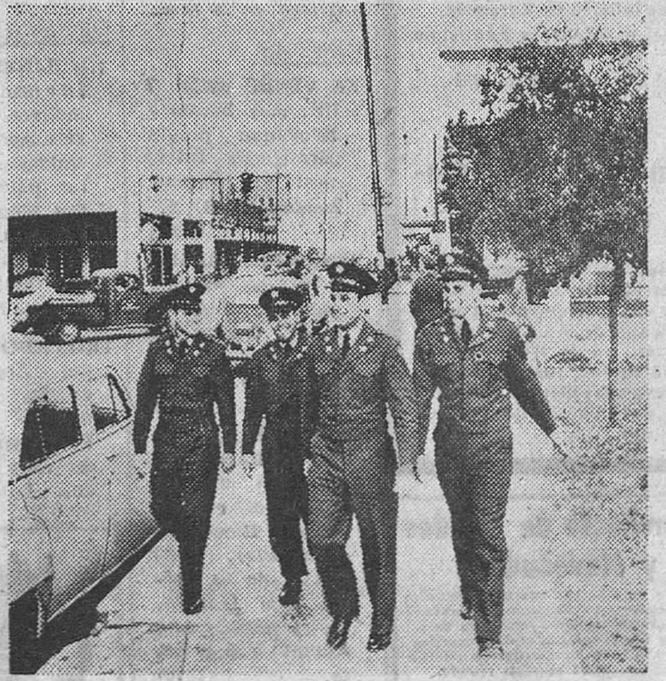
NUEVA YORK.—Hoy aquí a los cuatrillizos Perlonc disfrutando juntos de un permiso de fin de semana en la unidad de tanques donde prestan sus servicios.

La joven Narriman Sadek pudo disfrutar muy poco tiempo de su egregia postura de reina. Aquí aparece probándose el vestido que después vestió de novia: un precioso traje que al decir de las notas de sociedad era de seté blanco confeccionado en París y que costó varios millones de francos. Ahora Narriman es una reina destronada que tendrá que vivir en un país extraño. Su famoso equipo nupcial tendrá que atravesar aduanas y tal vez se ajará al contacto de profanos y democráticas manos... ¡Poco le duró su cetro a la bella Narriman!