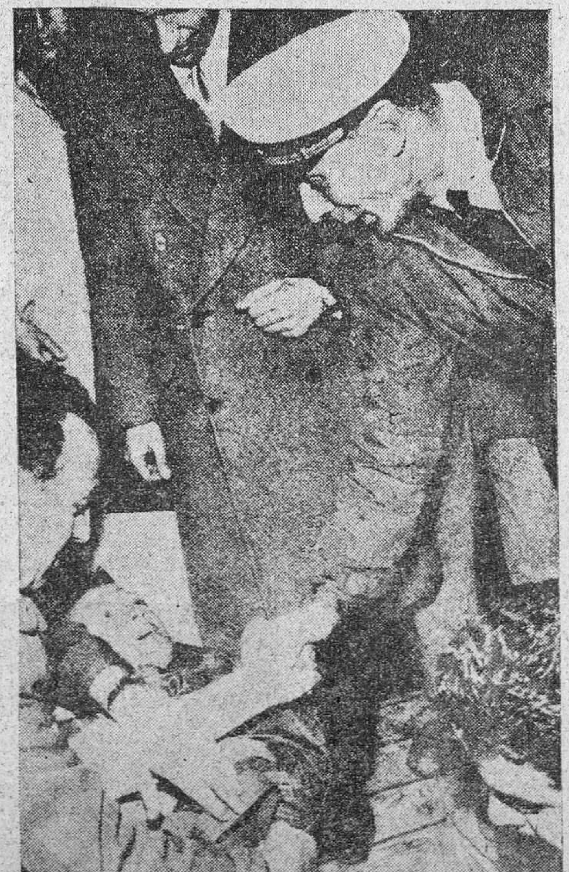
Momentos antes de ser desembarcado del «Celio», buque italiano que lo recogió extenuado en alta mar, el piloto francés del reactor que días pasados se estrelló en el Mediterráneo saluda en aguas de Barcelona a su salvador, el capitán del antedicho barco italiano.