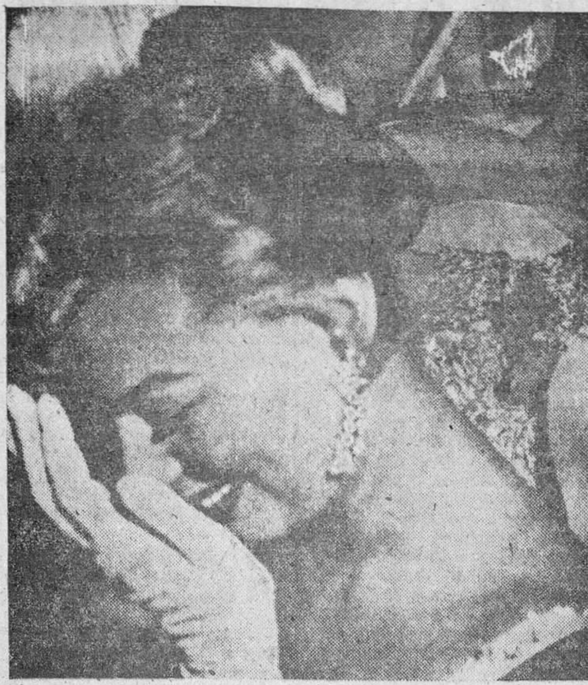
Se ha estrenado en Italia la tercera versión de la serie "Pan, amor y...". El director de esta película no es Comencini, sino Dino Risí y el pueblo, en lugar de ser Sagliena es Sorrento, pueblito que universalizó una canción y que se halla enclavado en la costa napolitana. Vittorio de Sica hace también el papel de comandante, pero esta vez no de "caraviniere", sino de la guardia municipal. Sofia Loren, que encarna el principal papel femenino, en sustitución de su rival Gina Lollobrigida, el de una joven y guapa viuda que se dedica a la venta de pescado. Está a punto de ser desahuciada de su domicilio—"Pan, amor y... casa mía"—y esto da lugar a una serie de divertidas situaciones. De Sica, como en las otras dos películas, hace el papel de fracasado otoñal galanteador. A quien da calabazas la Loren y se consuela con una muchacha, a quien en el pueblo tildan de beata y cuyo papel está encarnado por Lea Padovani.

ESTADOS QUE CREEN Y ESTADOS QUE NO CREEN EN DIOS