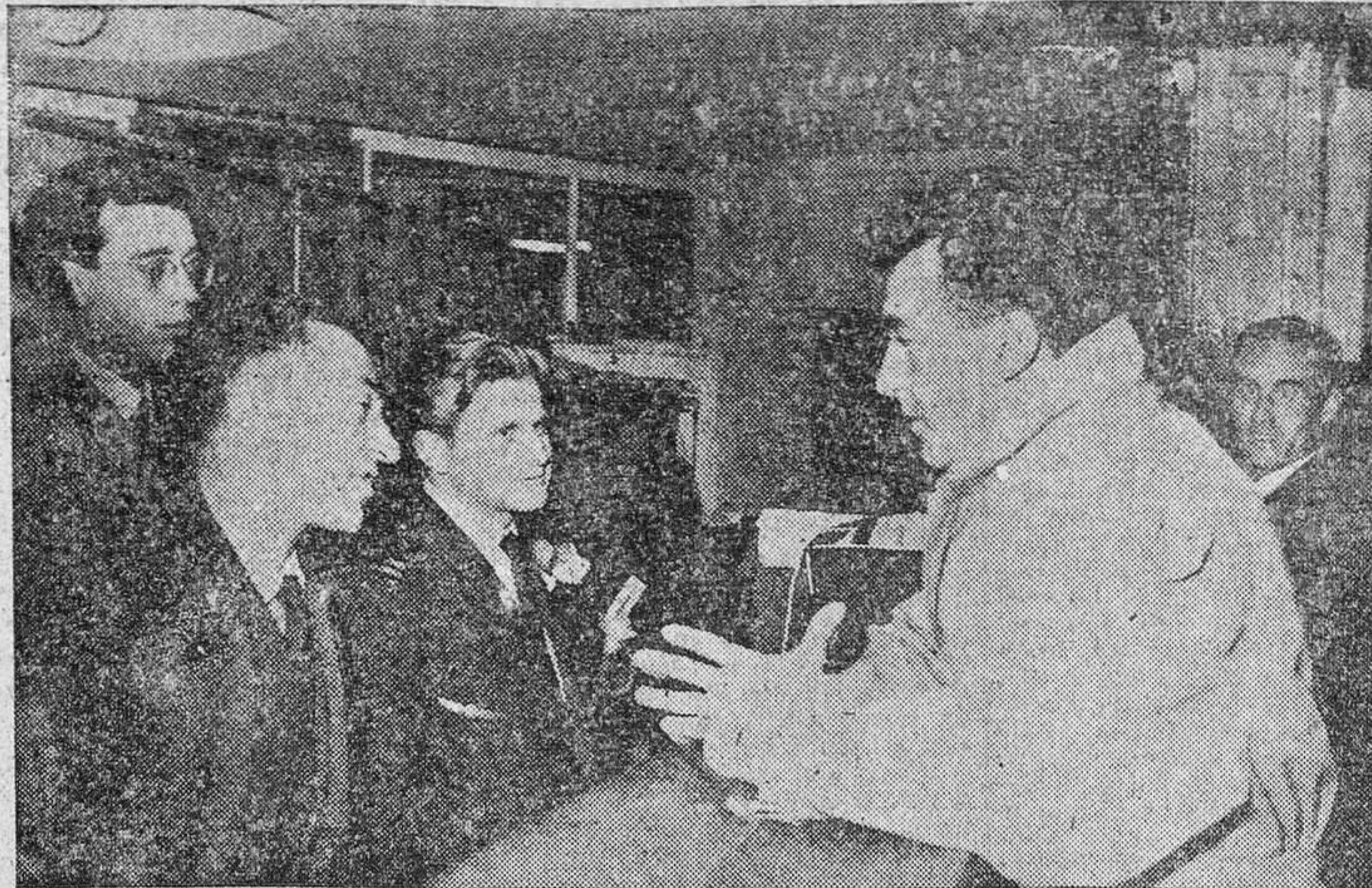
Aeropuerto de Barajas.—El ciclista francés, Louise Bobet, ha llegado a Madrid procedente de la capital de Francia acompañado de su esposa. El campeón se dirige a Canarias para descansar con vistas a la próxima temporada.