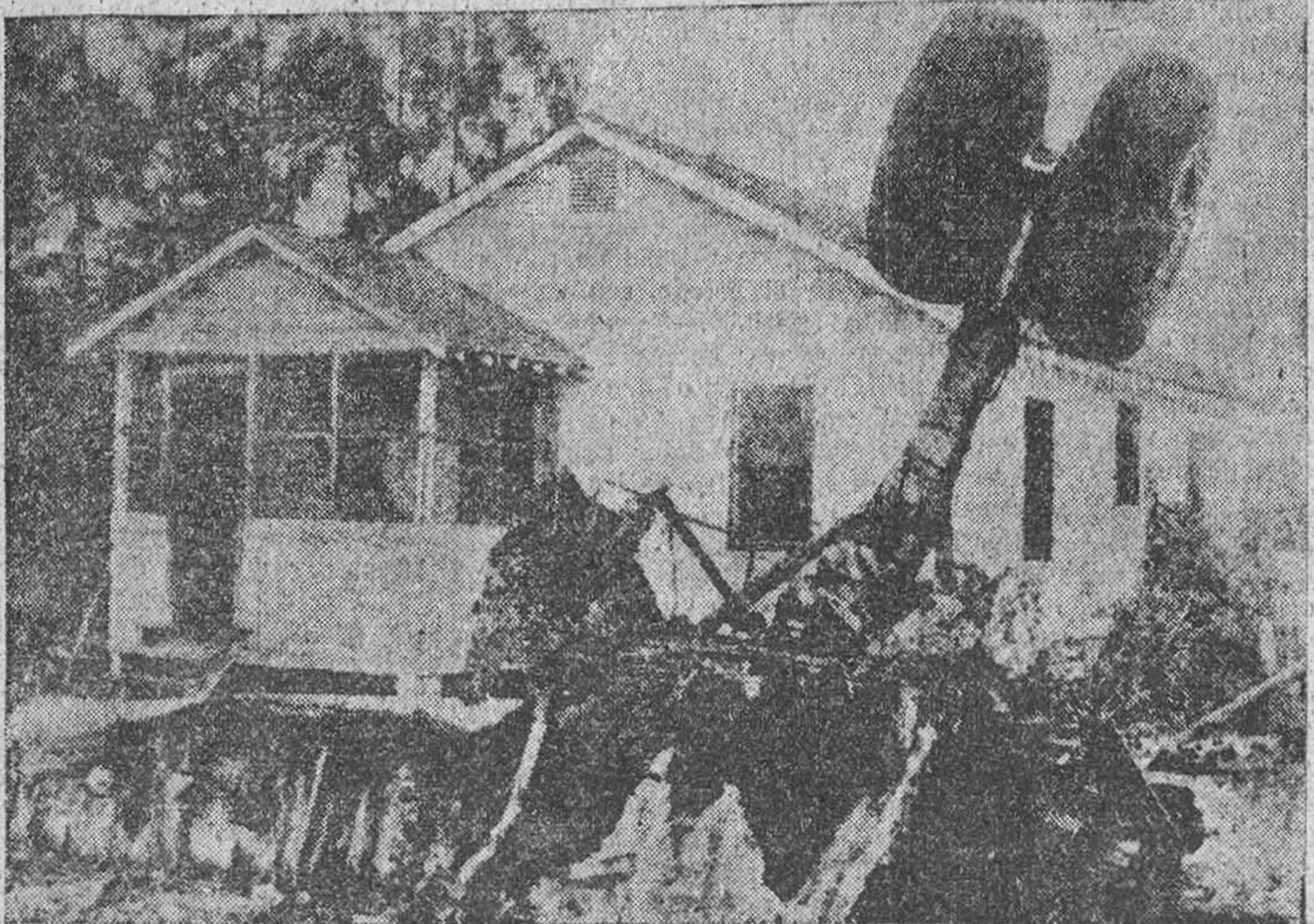
Así quedó literalmente empotrado en el jardín, un avión que se estrelló en las inmediaciones del aeropuerto de Jacksonville, Florida (Estados Unidos). Periclitó los diecisiete ocupantes del aparato.