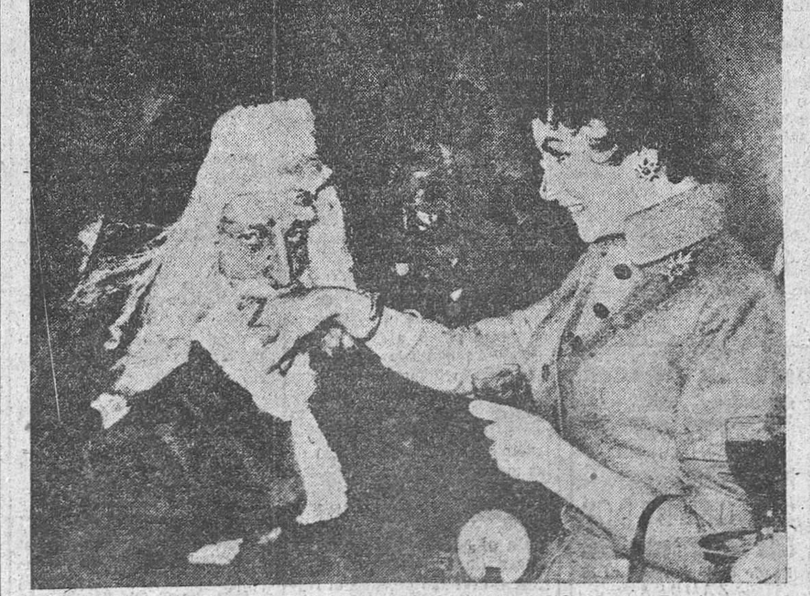
La popular y bellísima «Lollo» recibe el homenaje rendido de un Papa Noel, al que se le ve con exceso el camuflaje. La fotografía se obtuvo en el curso de una fiesta celebrada en Roma en honor de los niños pobres.