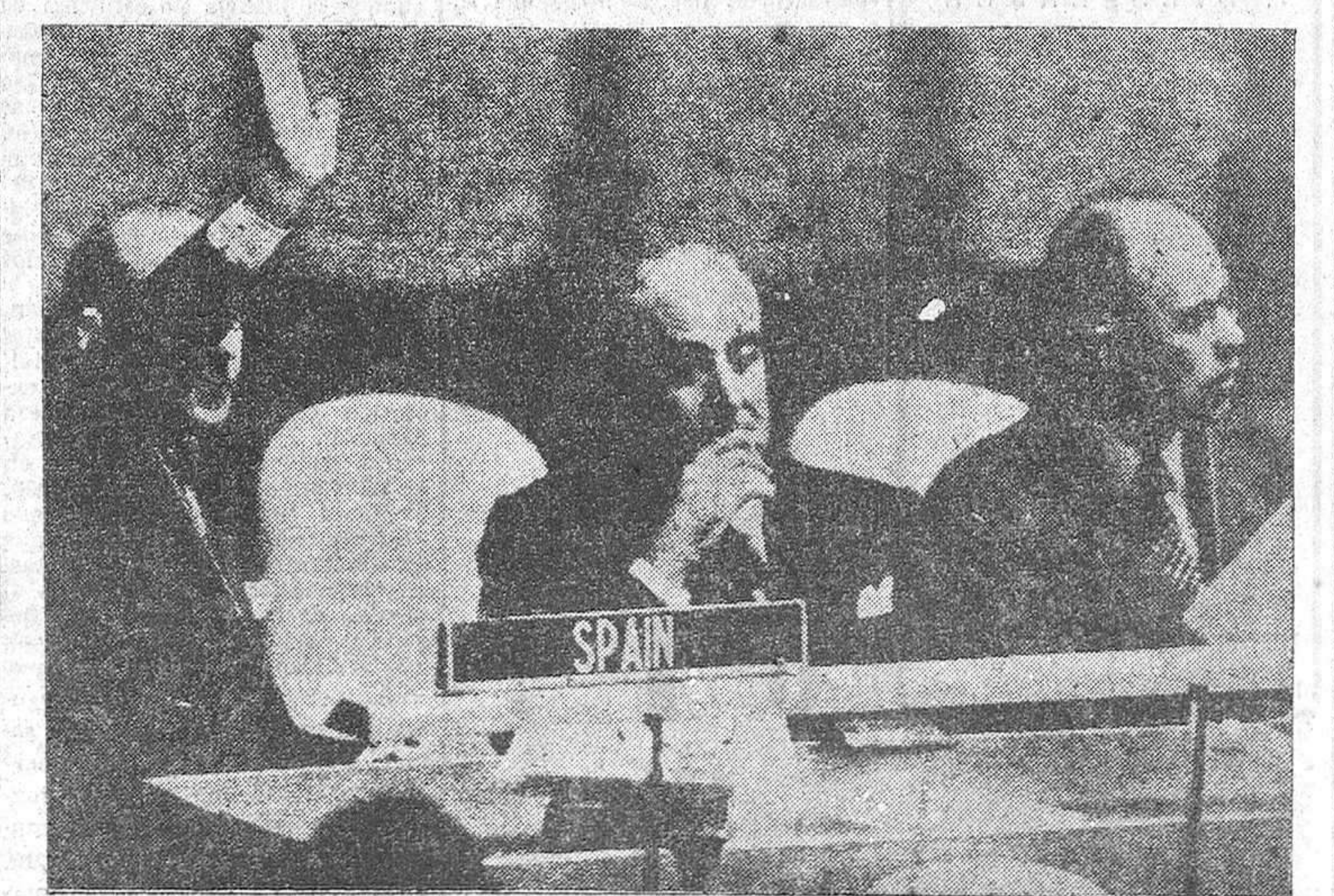
José Sebastián de Erico, delegado español en la O. N. U., levanta la mano para votar en nombre de nuestra Patria por vez primera en las Naciones Unidas. A su lado aparece José María de Areilza, embajador de España en los Estados Unidos.