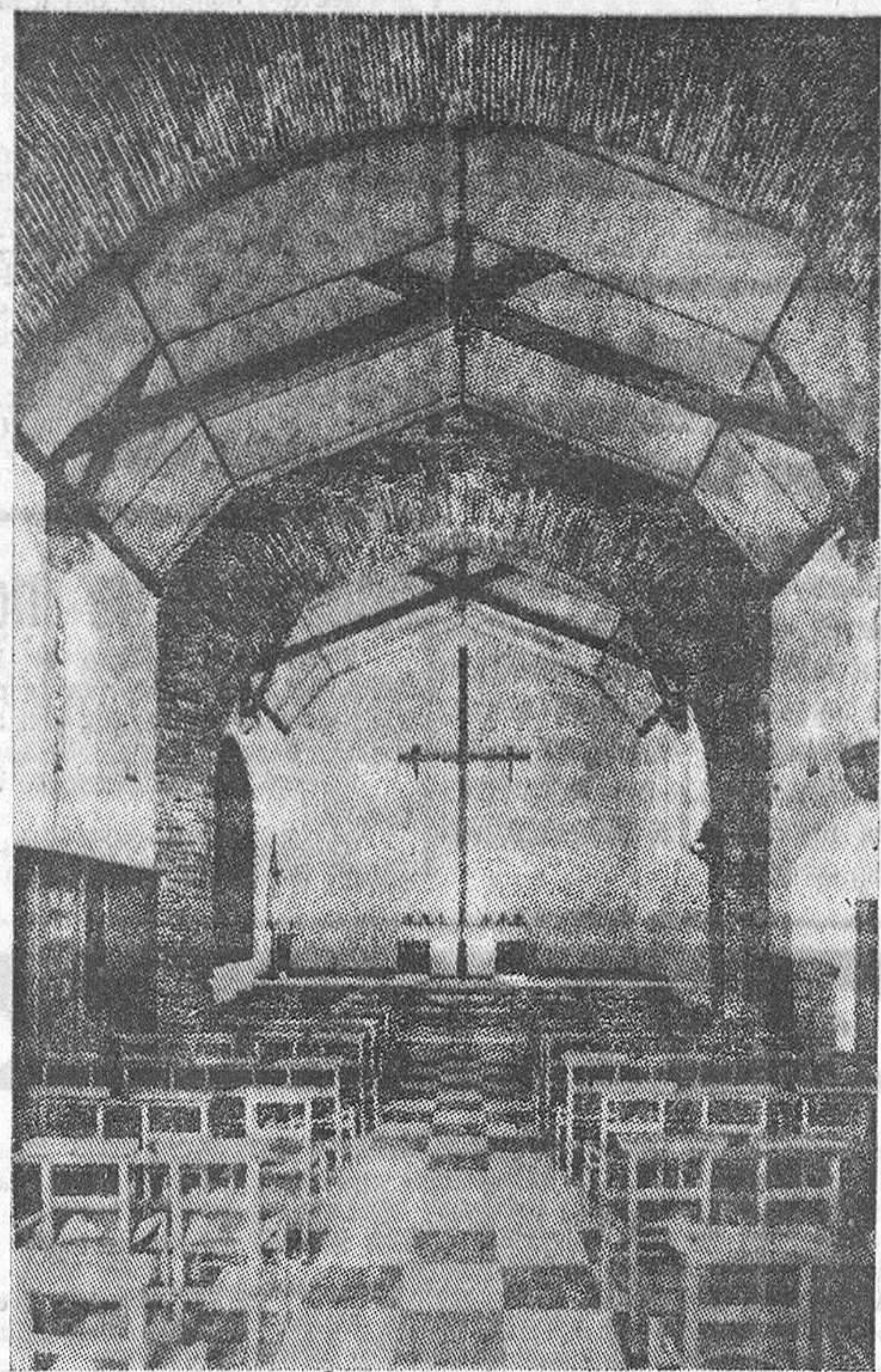
Las modernas iglesias francesas llaman la atención por su extrema simplicidad. En el altar, nada que dis-traija la atención. Todos los detalles, hasta el último clavo, son pensados por el arquitecto en función del conjunto. En la "foto", la capilla construida por M. Henri Enguehard, para el Carmelo de Angers.

He visitado gran parte de esas parroquias a que hace alu-sión Sánchez Aliseda. Tambien