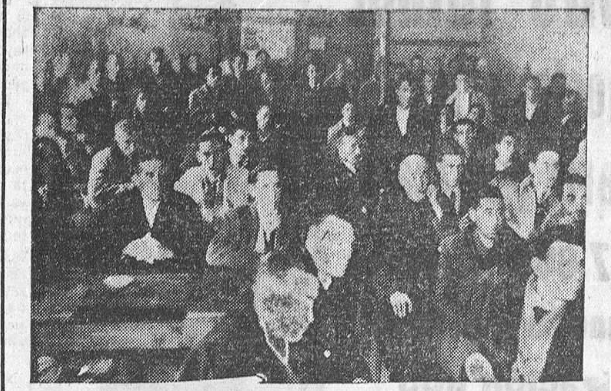
Aspecto de la Asamblea celebrada en Mayorga de Campos.

El pasado viernes, en Medina del Campo, y el domingo en Mayorga, Villalón y La Unión de Campos, se celebraron las últimas Asambleas de las Secciones Sociales de las Hermandades encuadradas en las Delegaciones Comarcales de las citadas localidades, quedando cerrado con ellas este primer ciclo de Asambleas de Hermandades, llevado a cabo por la Vicesecretaría Provincial de Ordenación Social de Valladolid. A ellas asistió, presidiéndolas, el vicesecretario de Ordenación Social, juntamente con un letrado asesor de la C. N. S., el presidente de la Sección Social de la C. O. S. A. y los mandos sindicales de cada Delegación Sindical en las cuales se celebraron las indicadas Asambleas. En ellas, por el camarada