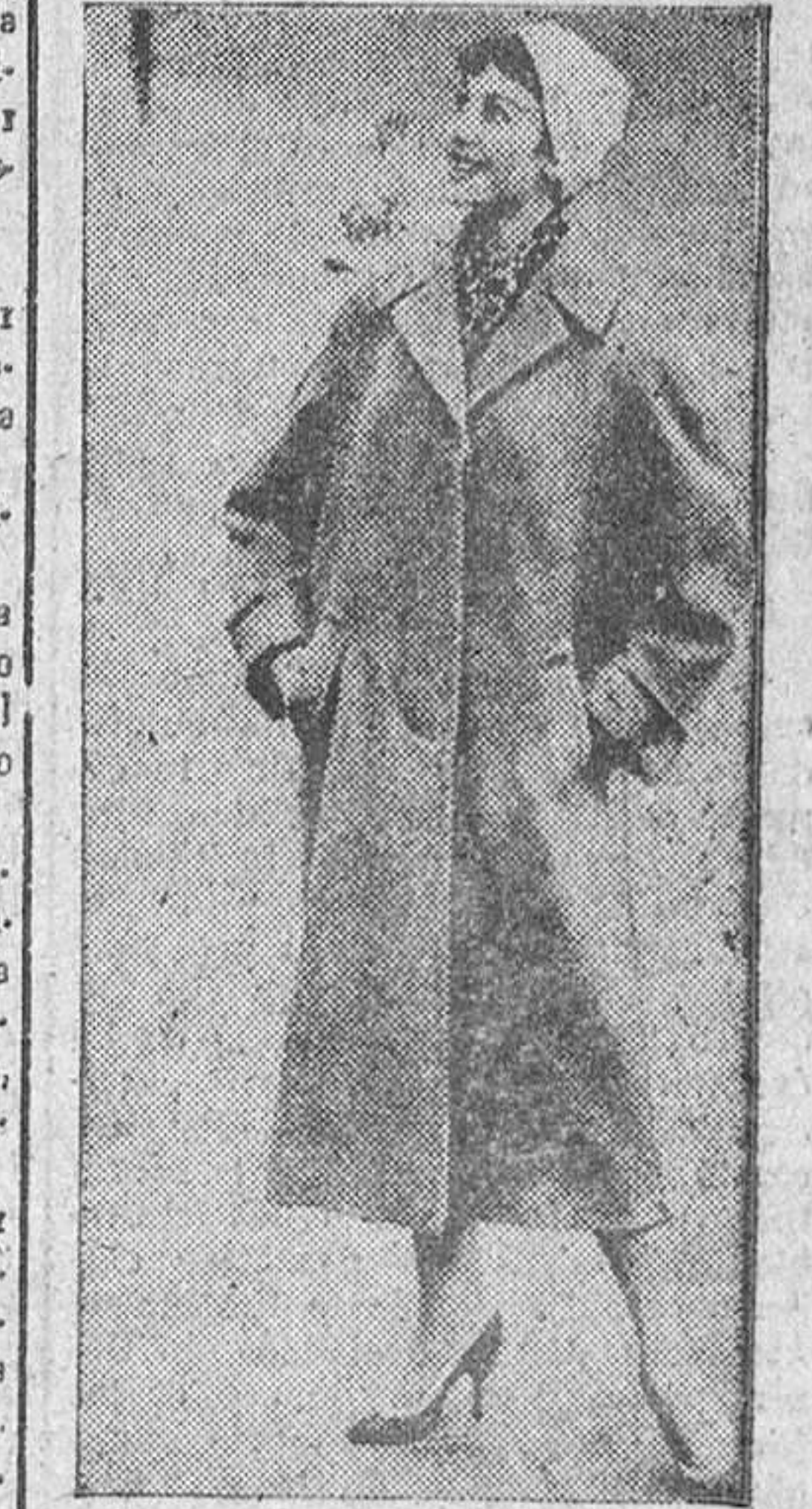
También los abrigos se compran a plazos...

El fenómeno general de la venta a plazos, que en otras tierras alcanza la mayor amplitud (pues se venden a plazos las vacaciones quincenales, el viaje de bodas, la entrada del estadio, la dentadura postiza y