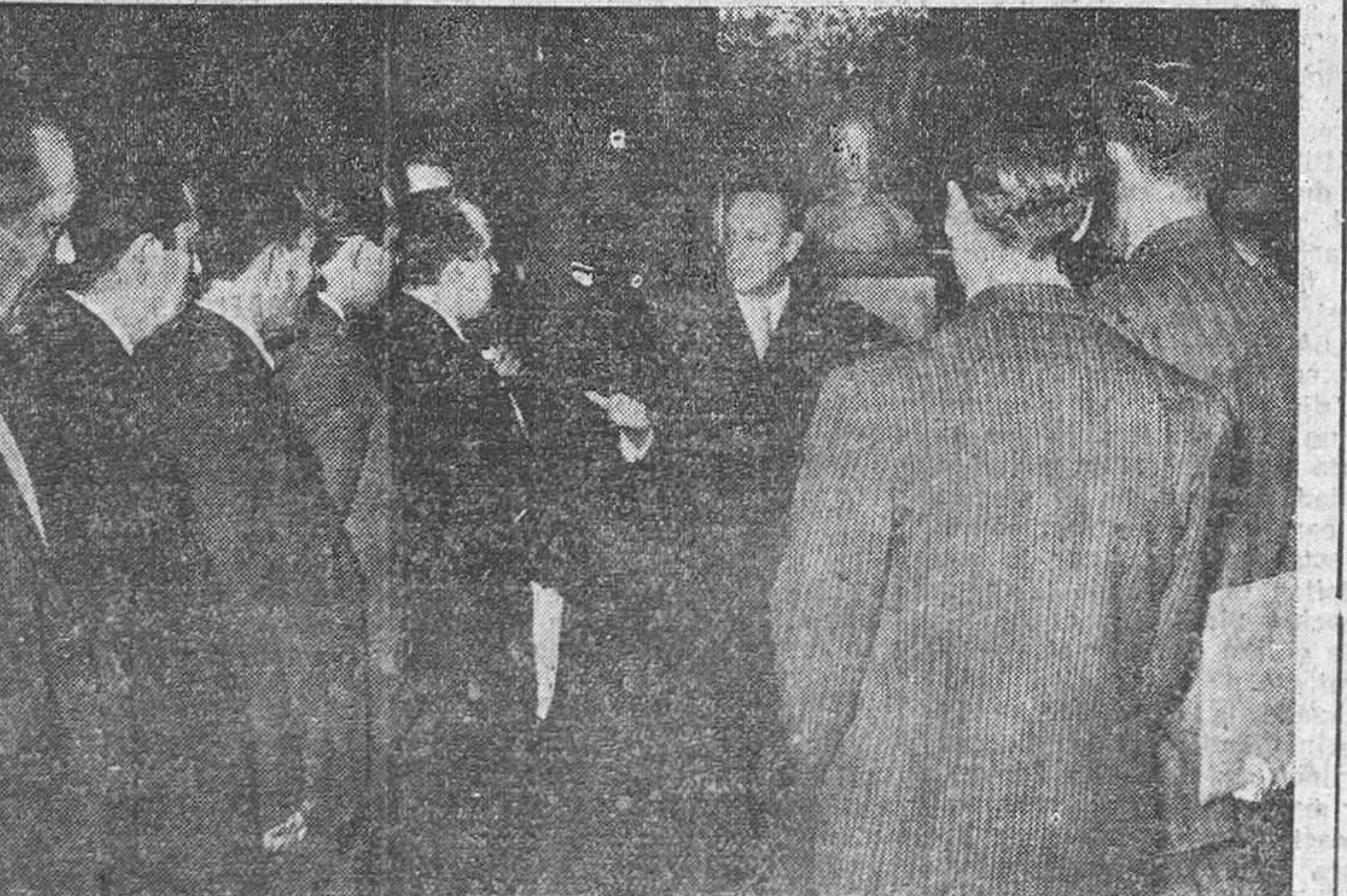
MADRID.—La Comisión de mineros de Almadén que se encuentra en Madrid fué recibida por el ministro secretario general del Movimiento, con quien aparecen en la fotografía.