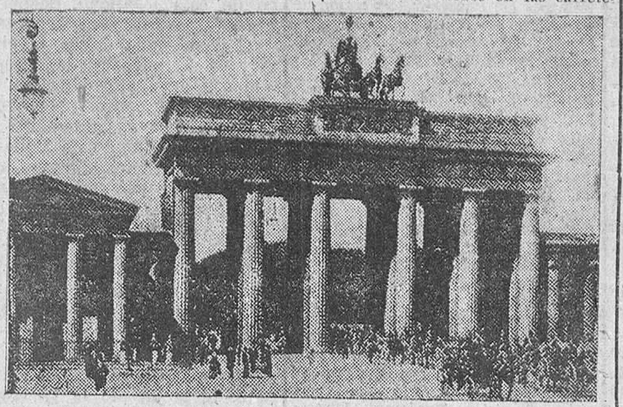
Puerta de Brandenburgo

Otro eslabón carretera que está en el proceso de ser considerado por el Gobierno egipcio es aquel que unirá Suez con Arabia Saudí. Este camino tendrá una extensión de cuatrocientos kilómetros.