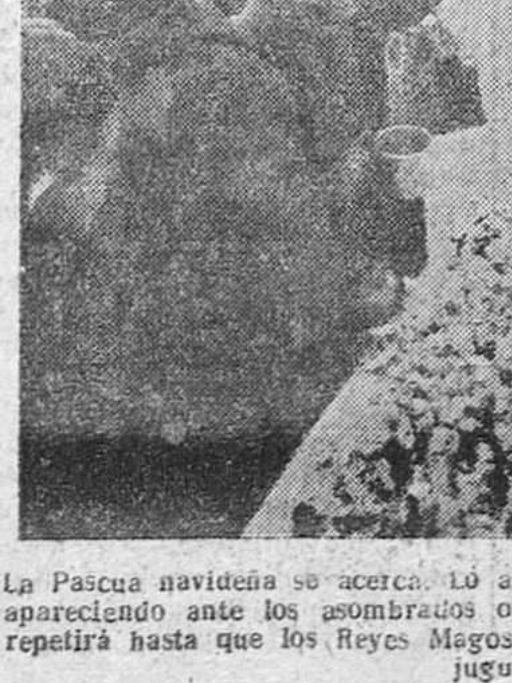
La Pasqua navideña se acerca. Lo anuncian los Belenes que ya están apareciendo ante los asombrados ojos de la chiquillería. La estampa se repetirá hasta que los Reyes Magos dejen su ilusionado cargamento de juguetes.