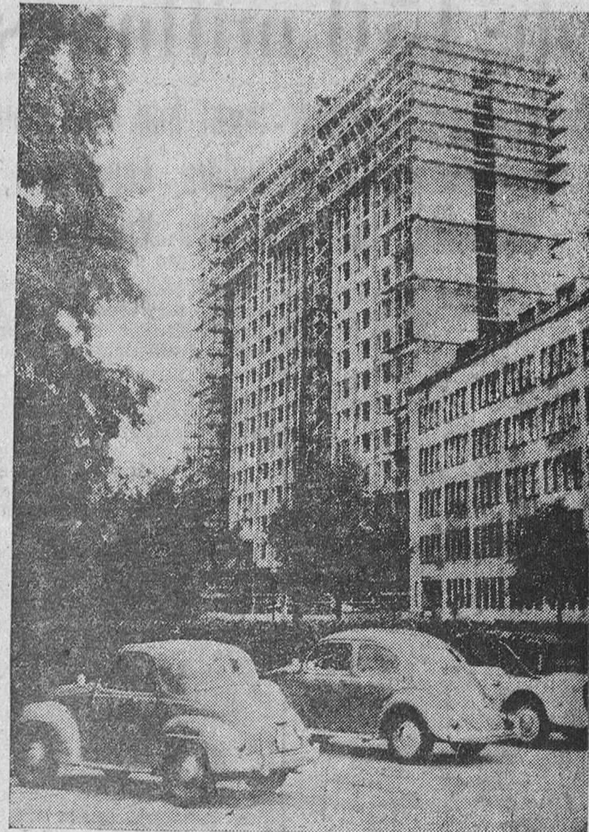
Reconstrucción de Berlín

Berlin. TEMPELHOF no es un nombre fácil de olvidar para el viajero que llega actualmente a Berlín. Es posible, que muchos se lo expliquen, sencillamente, por su simple sonoridad—sonoridad que los españoles, dicho sea de paso, la hacen todavía más fuerte, en su empeño tradicional de confundir la «s» alemana con nuestra «j». Pero no es por cuestiones lingüísticas por lo que Tempelhof puede considerarse como el centro y símbolo de la vida del Berlín de hoy, sino fundamentalmente porque es la única puerta de salida y entrada que tienen los berlineses para ponerse en contacto con el mundo exterior. Siendo además una puerta en la que parecen reunirse siempre los símbolos de la dramática existencia que les toca vivir ahora a los habitantes de la antigua capital alemana.