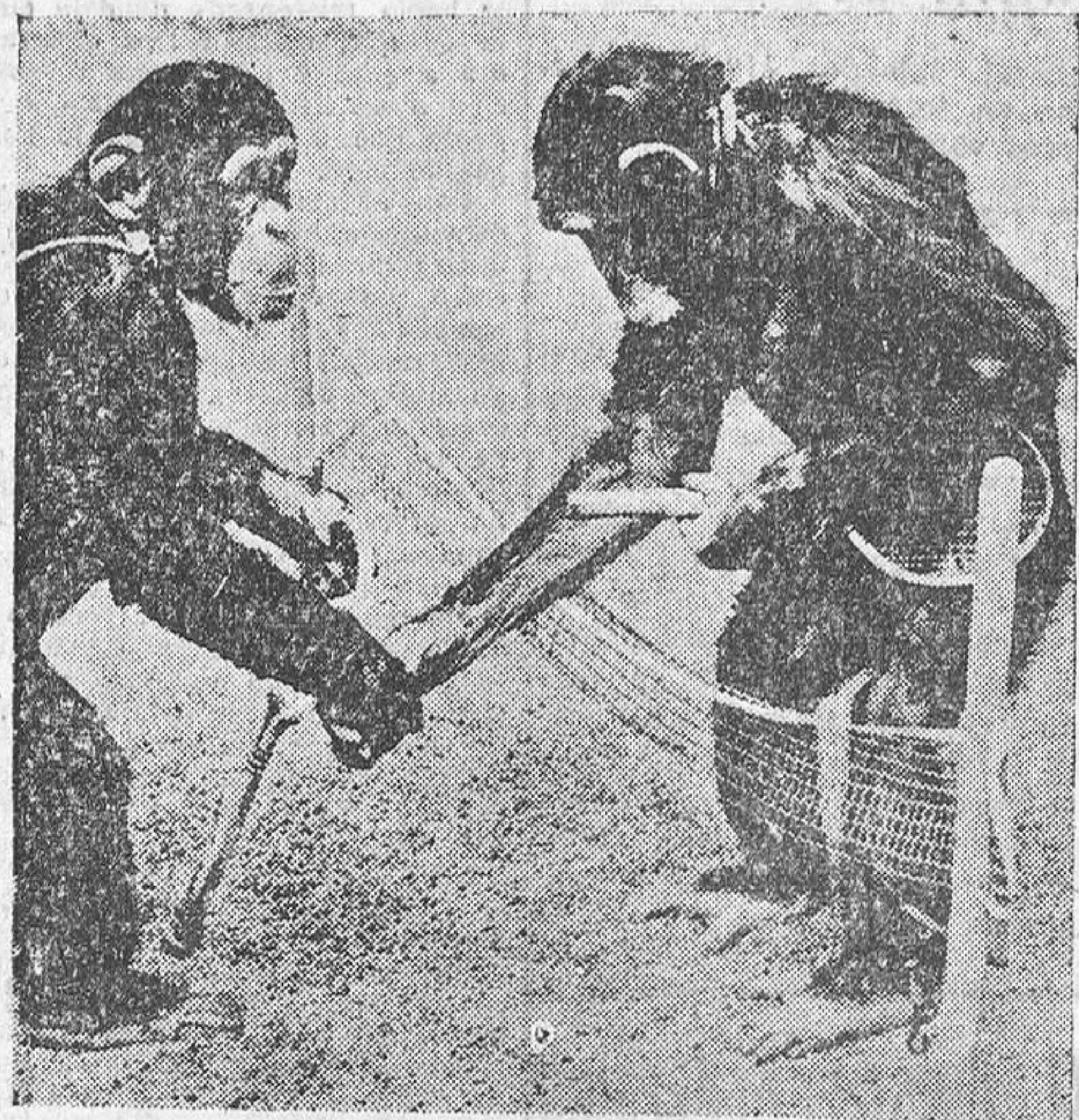
Estos monos han tenido más suerte que otros muchos de sus hermanos, sacrificados en múltiples ocasiones en favor de la ciencia.

Algunas pruebas podrán parecer terribles, pero nunca esériles