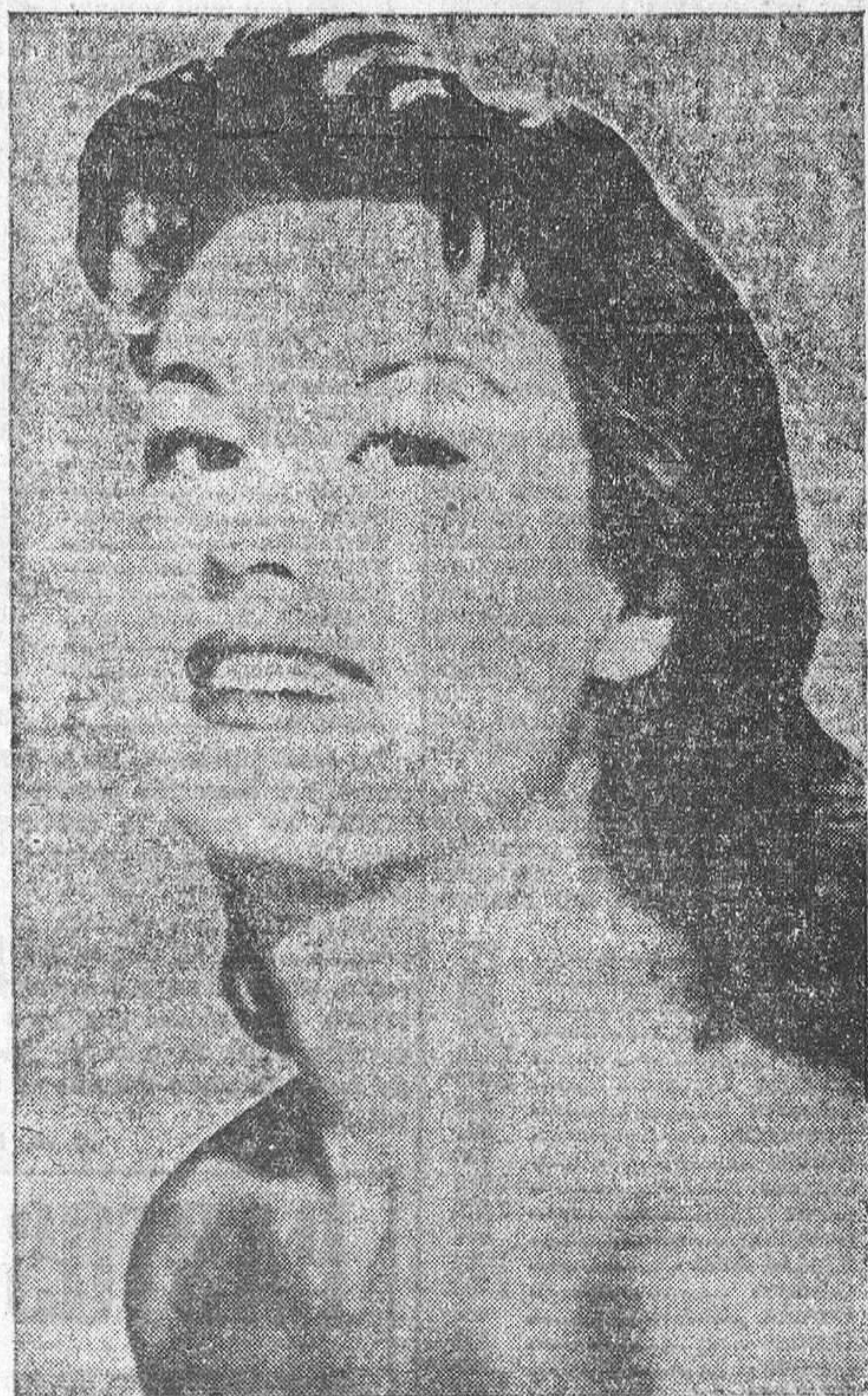
Emma Penella ha llegado a Lisboa para participar en la nueva Semana de Cine Español.