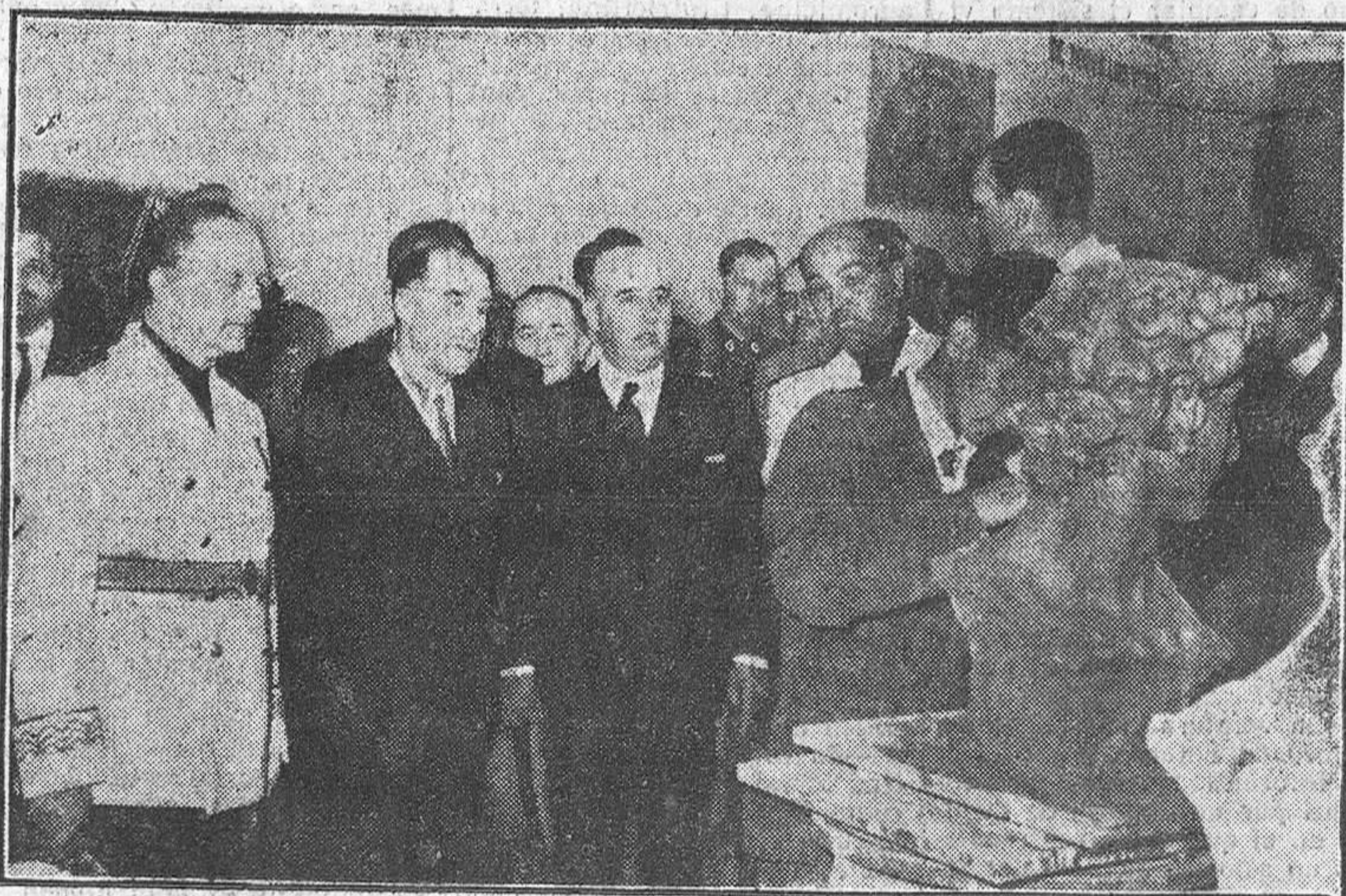
MADRID.—Sus Excelencias los Jefes de Estado de Portugal y España, acompañados de otras personalidades, durante su visita a la Institución sindical "Virgen de la Paloma".

La Empresa Nacional de Autocamiones y el Instituto Nacional de Técnica Aeronáutica