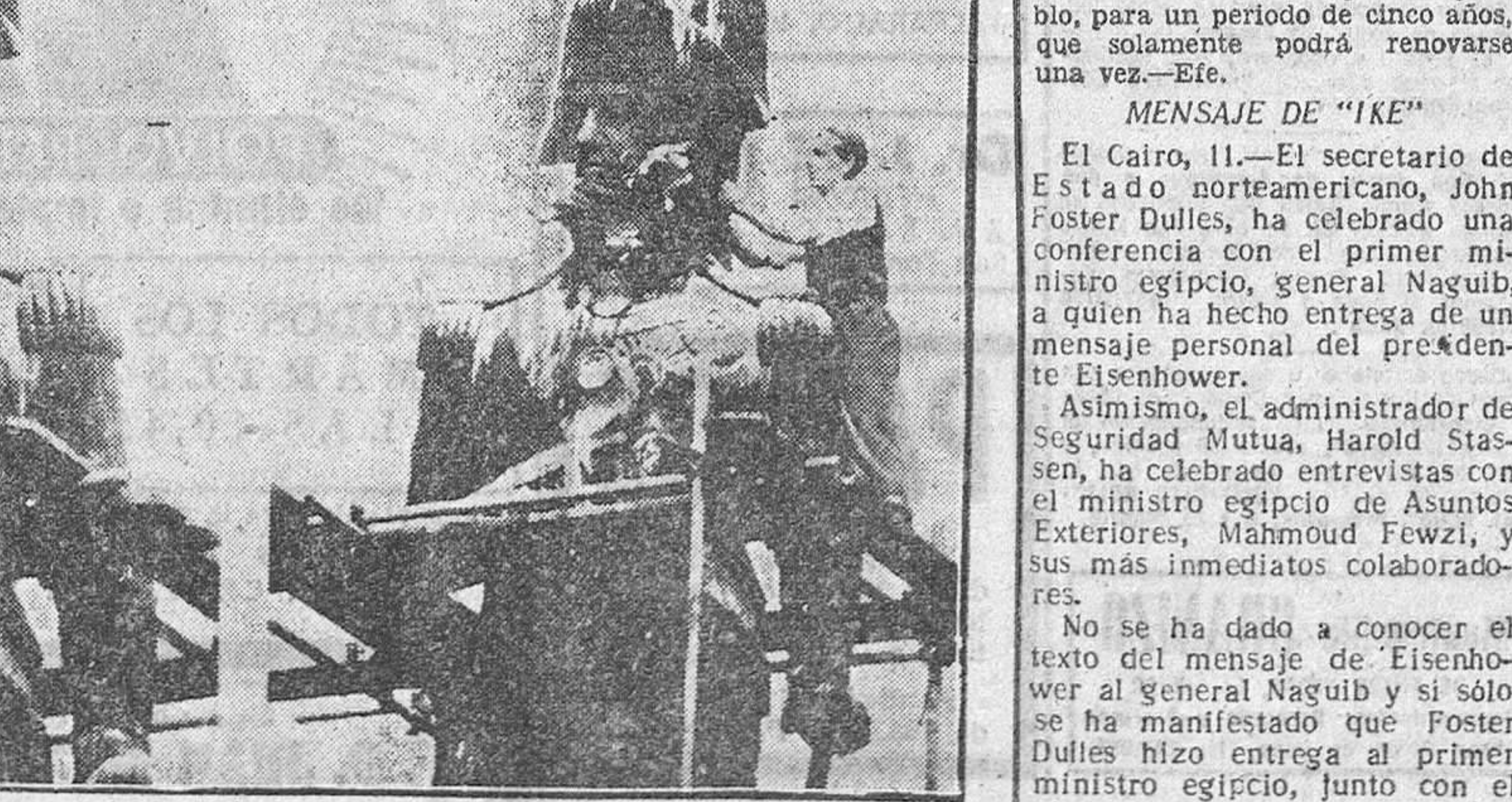
LONDRES.—A la izquierda puede apreciarse como la negra bandera con la calavera y las tibias cruzadas —la enseña de los piratas— envuelve la cabeza de la estatua de Nelson que figura en la parte superior de la columna levantada en Trafalgar Square. A la derecha, dos funcionarios proceden a desenmascararla de tan oprobioso trapo. El hecho ha sido calificado por los ingleses de atrevida burla.

El Cairo, 11.—Al término de la entrevista celebrada por el secretario norteamericano, John Foster Dulles, y el primer ministro egipcio, general Mohamed Naguib, el primero de ellos ha facilitado un comunicado que dice lo siguiente: "Hemos llegado a la conclusión de que la solución sería la plena soberanía egipcia, con una retirada gradual de las tropas extranjeras que la garantizan, arreglado todo de tal forma que la importante base de la zona del Canal, con sus depósitos y toda clase de recursos, quede a la disposición, para su utilización inmediata, del mundo libre, en caso de una futura guerra".—Efe.