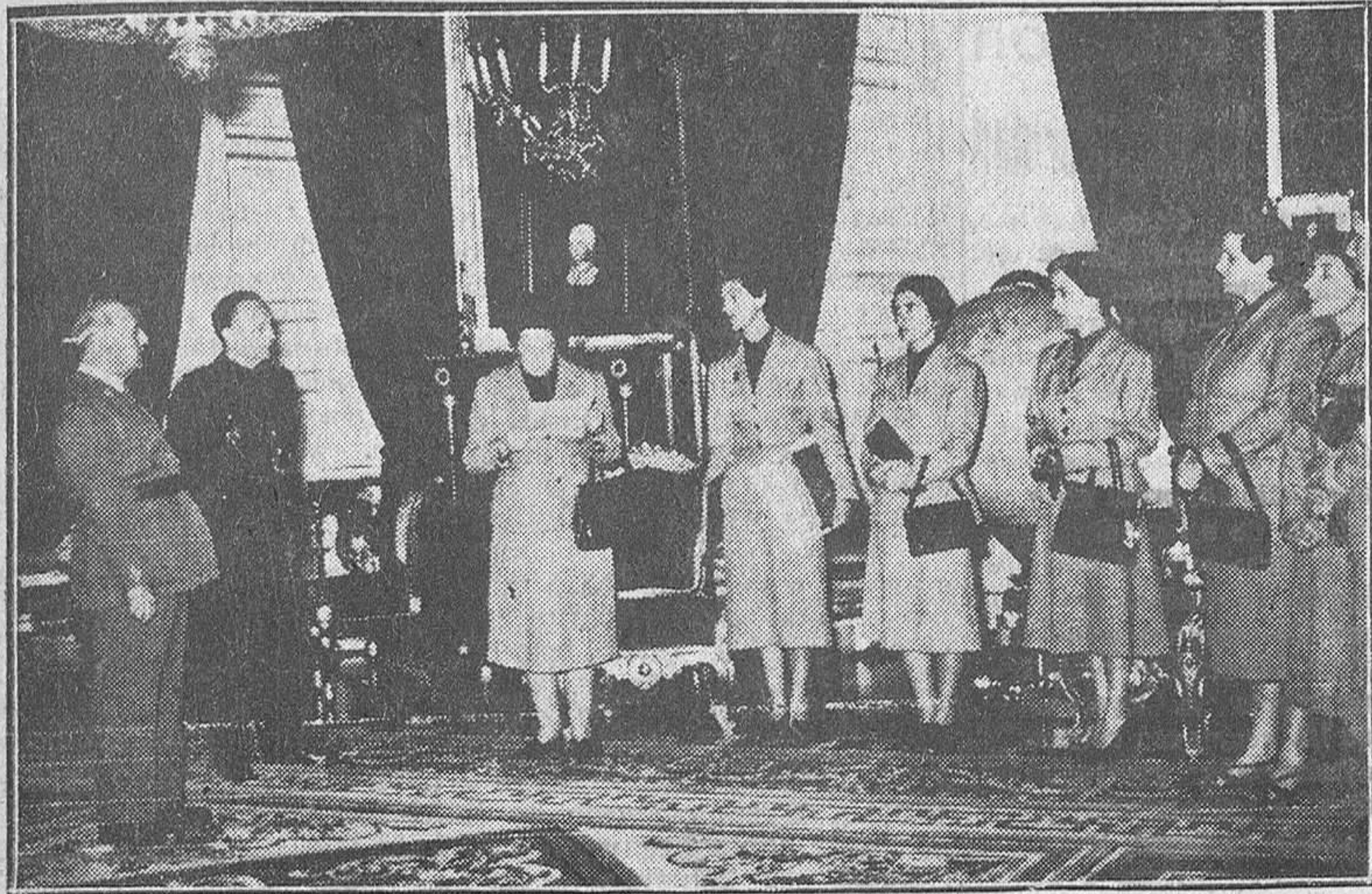
MADRID.—Su Excelencia el Jefe del Estado durante la audiencia concedida a un grupo de mandos de la Sección Femenina, acompañado del ministro Secretario General del Movimiento y de la delegada nacional, Pilar Primo de Rivera