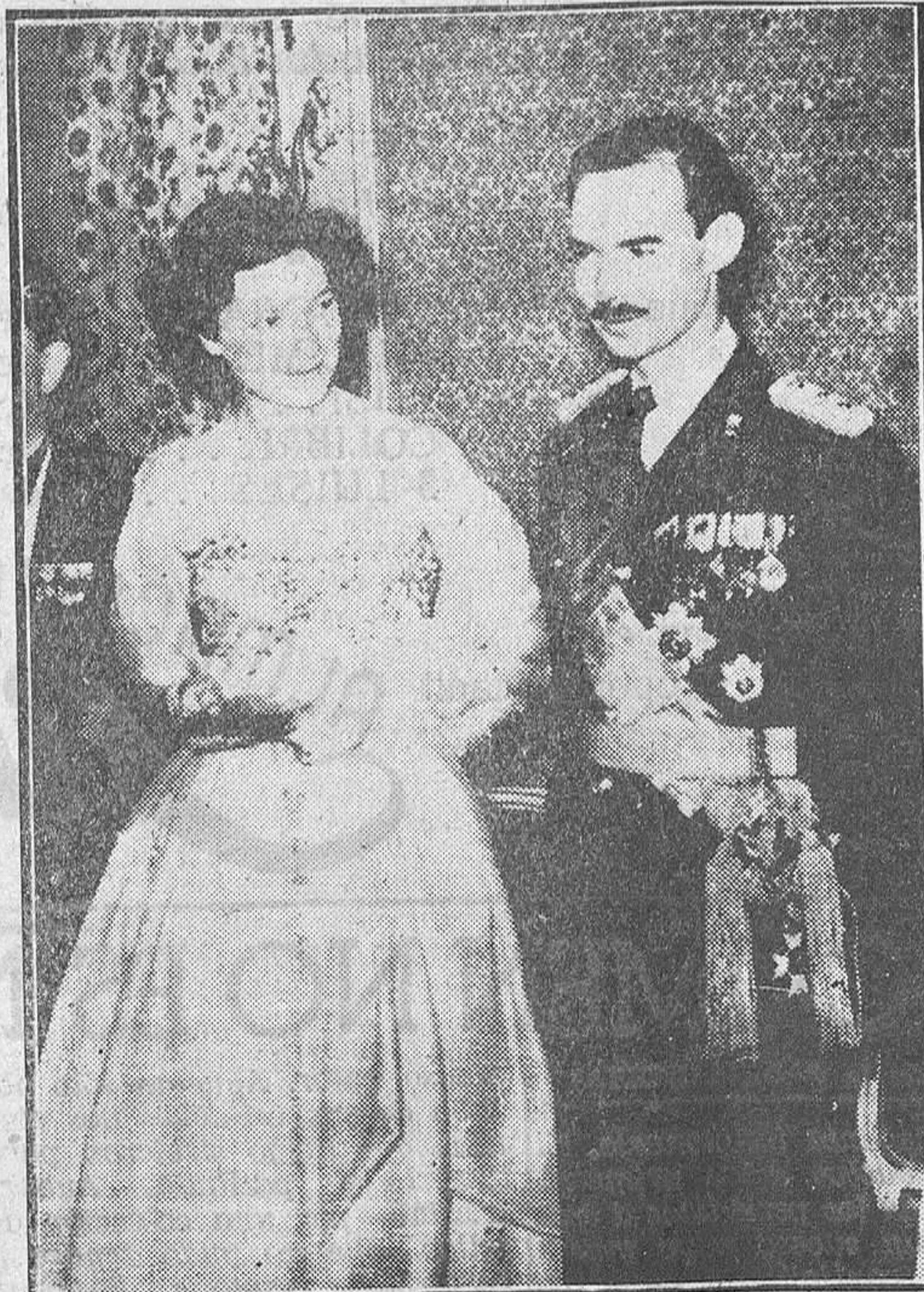
Sus Altezas Reales el príncipe Juan de Luxemburgo y la princesa Josefina Carlota de Bélgica.

Josefina Carlota de Bélgica contrajo matrimonio con Juan de Luxemburgo