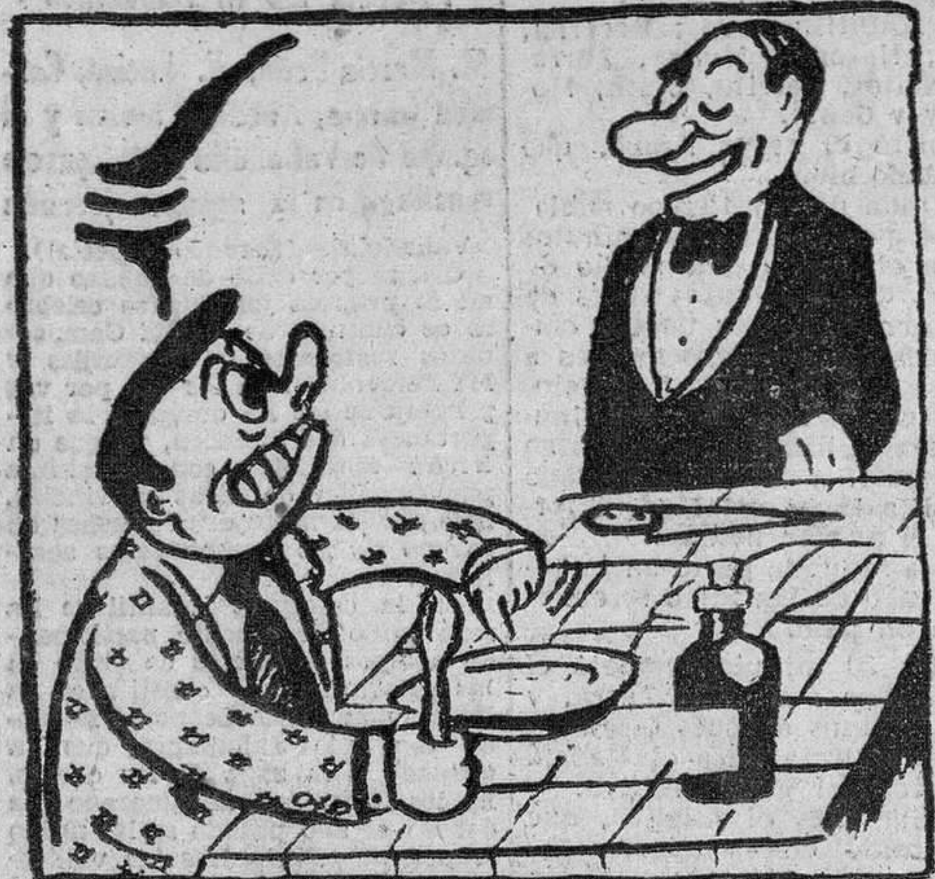
Me gustaría saber qué clase de bichos tenía esta sopa... Caballero, aquí se viene a comer y no a ilustrarse...