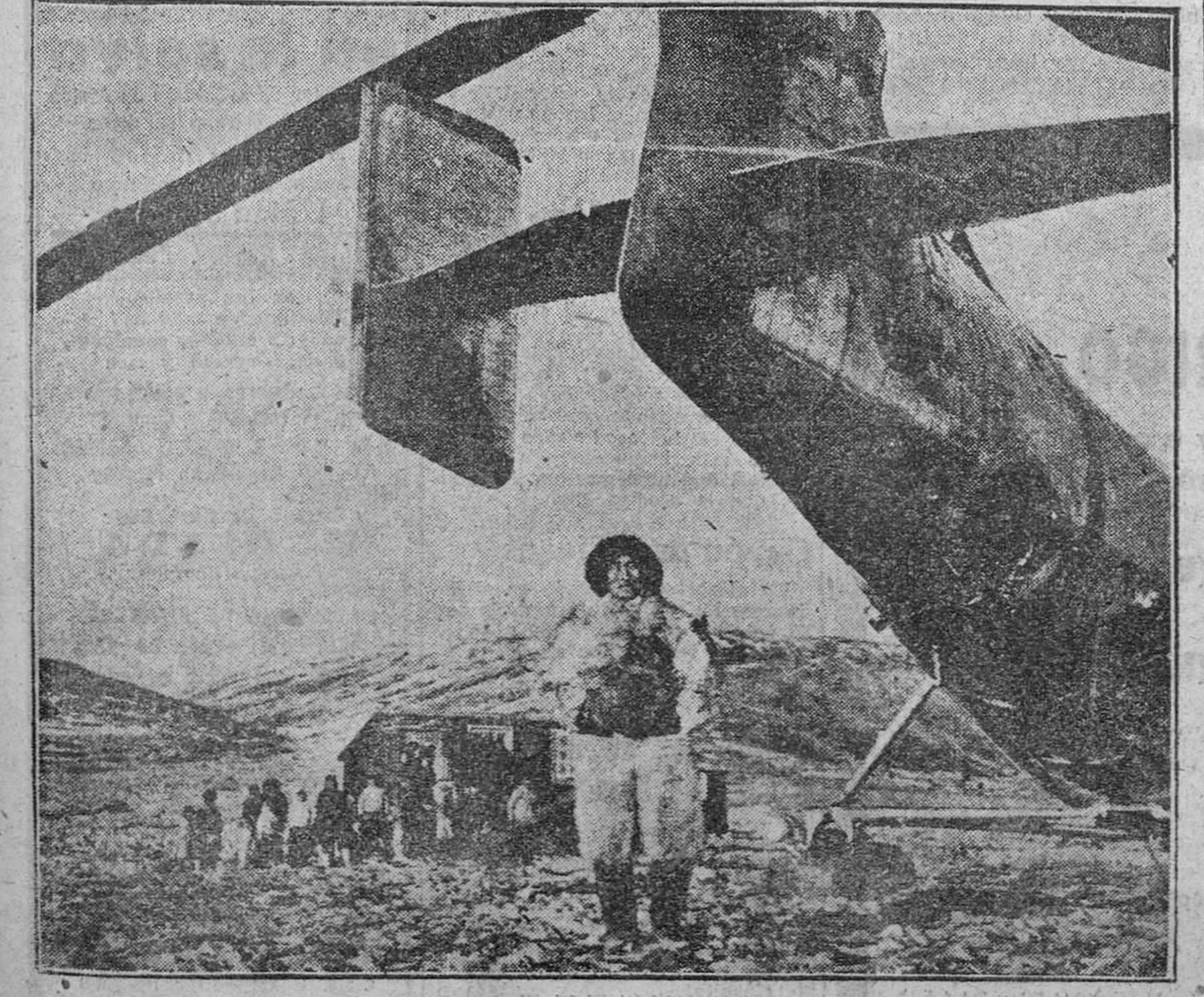
Un helicóptero norteamericano aterriza en las cercanías del campo polar Artico. El grupo de esquistas, del cual se adelanta el jefe de familia, muestra su admiración ante el acontecimiento.