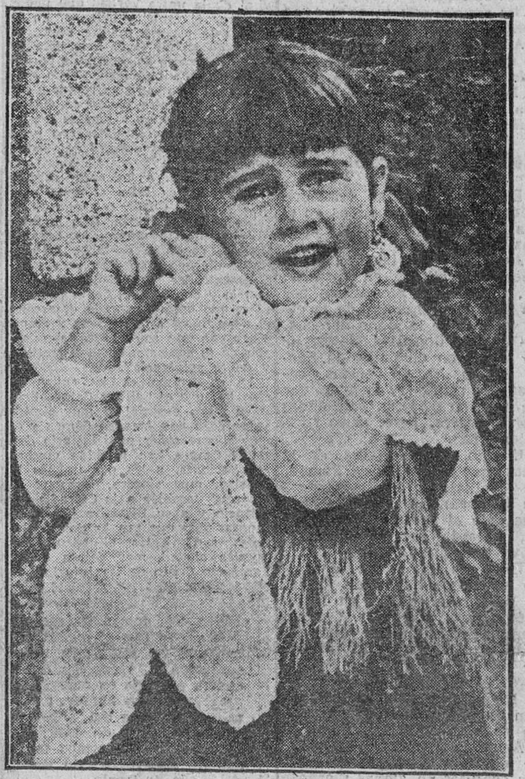
La nieta del Jefe del Estado, luce graciosamente el traje típico gallego con que, al igual que su hermanita, ha sido obsequiada por el coro «Cantigas d'Terra», en La Coruña.

Obsequio a las nietas del Jefe del Estado