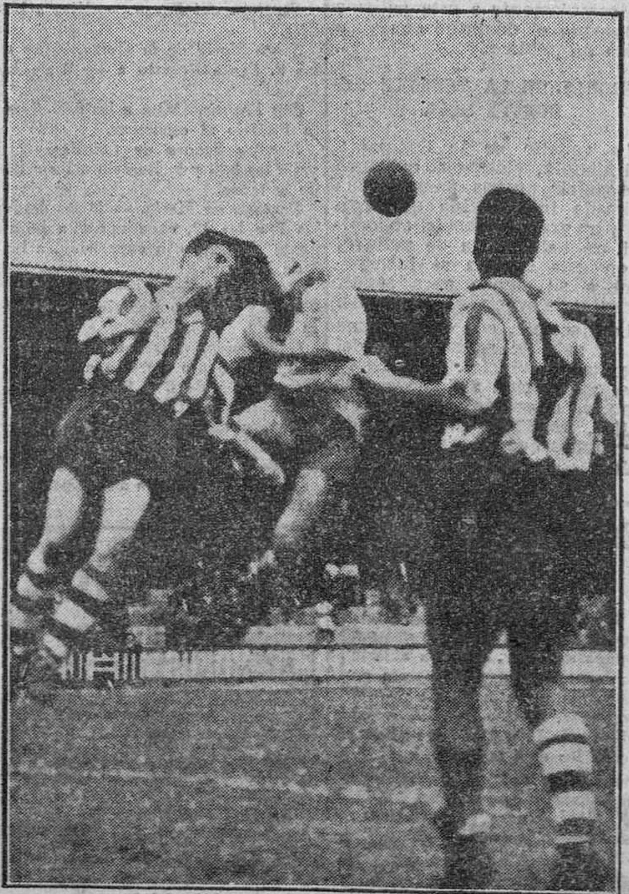
El momento del encuentro Europa-Delicias-Atlético de Zamora. El equipo izquierdo del visitante enfrenta el remate, a elestandose una defensa zamorana. Gano el Europa por 5-1.