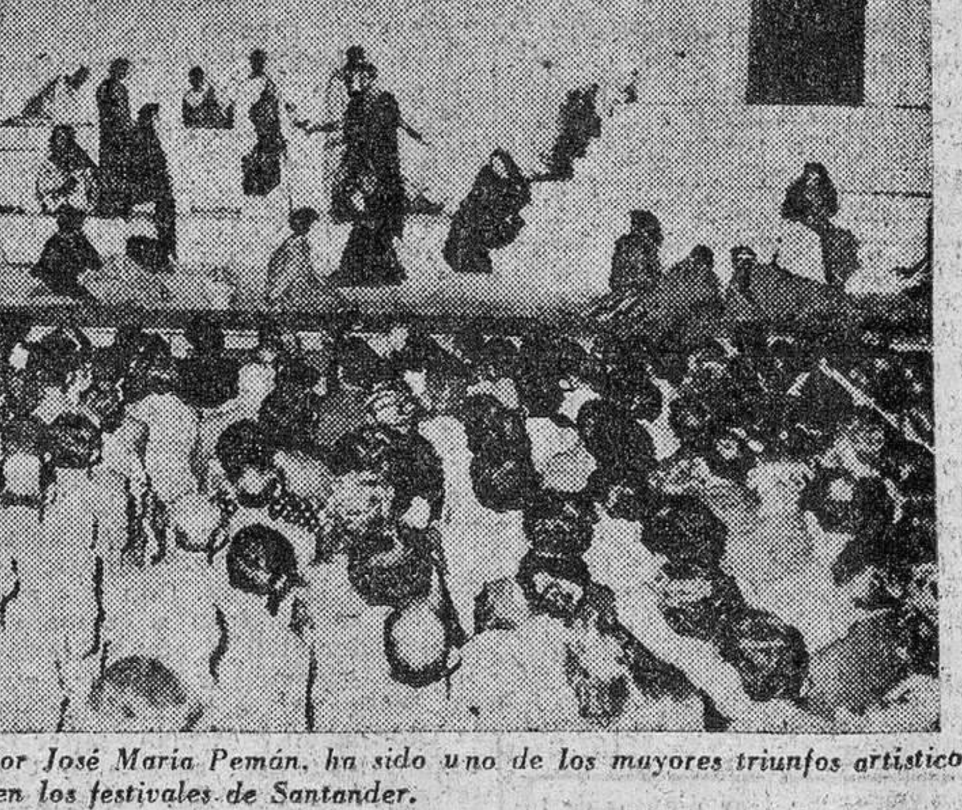
«Edipo, Rey», de Sófocles, adaptada por José María Pemán, ha sido uno de los mayores triunfos artísticos en los festivales de Santander.

Se clausuran los últimos turnos de las Residencias para productores de las Residencias para productores