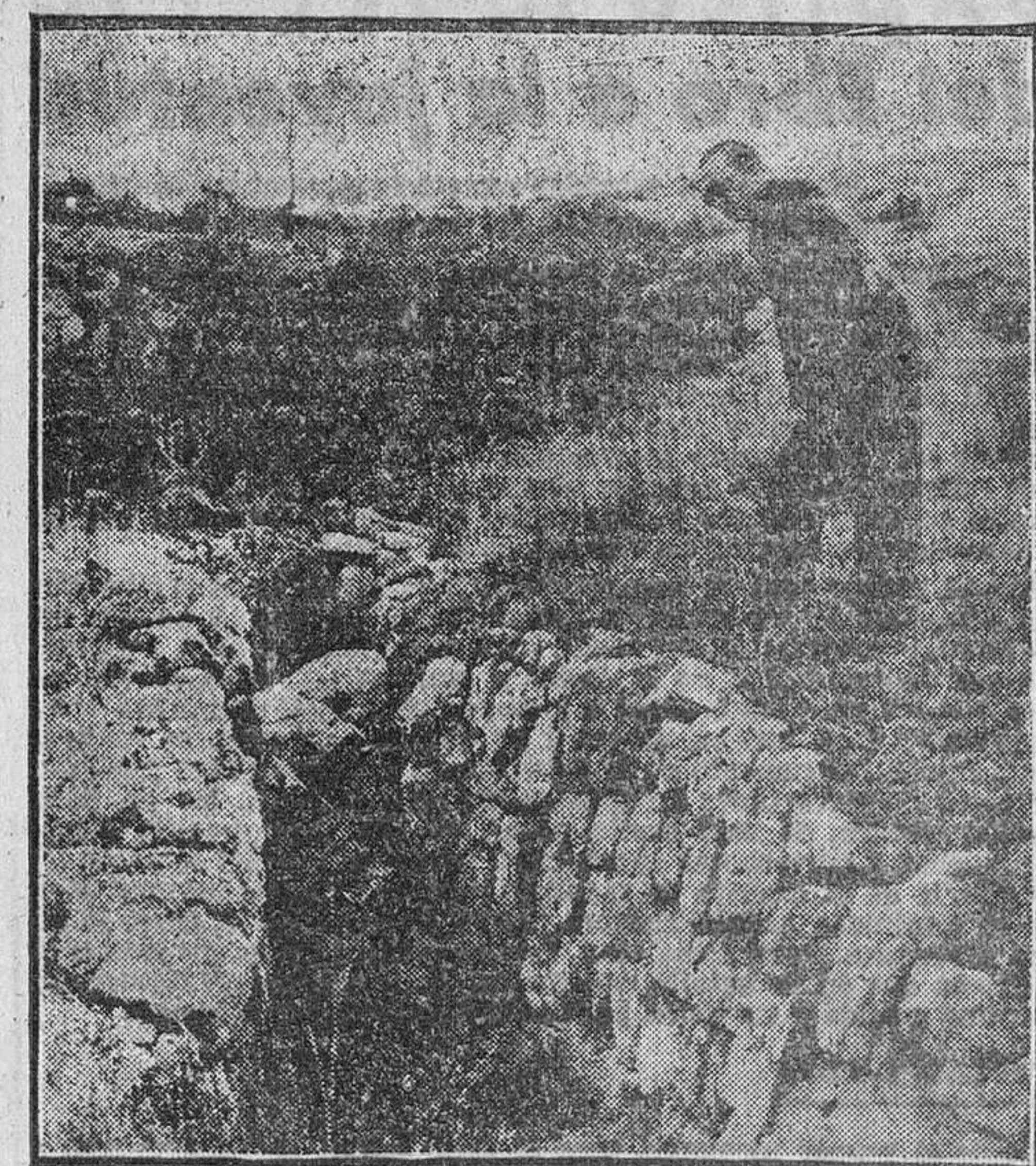
El autor de este reportaje junto a la cueva de Valorio.

¡Católicos! Mañana es el primer viernes de mes. Haced una fervorosa comunión preparados por una buena confesión. No olvidéis la gran promesa del Sagrado Corazón de Jesús, que dijo a Santa Margarita María de Alacoque: «Yo prometo, en el exceso de la misericordia de mi Corazón, que mi amor todopoderoso concederá a todos los que conculgen nueve primeros viernes de mes seguidos, la gracia de la perseverancia final; no morirán en mi desgracia y mi Corazón será su refugio seguro en aquel último momento.»