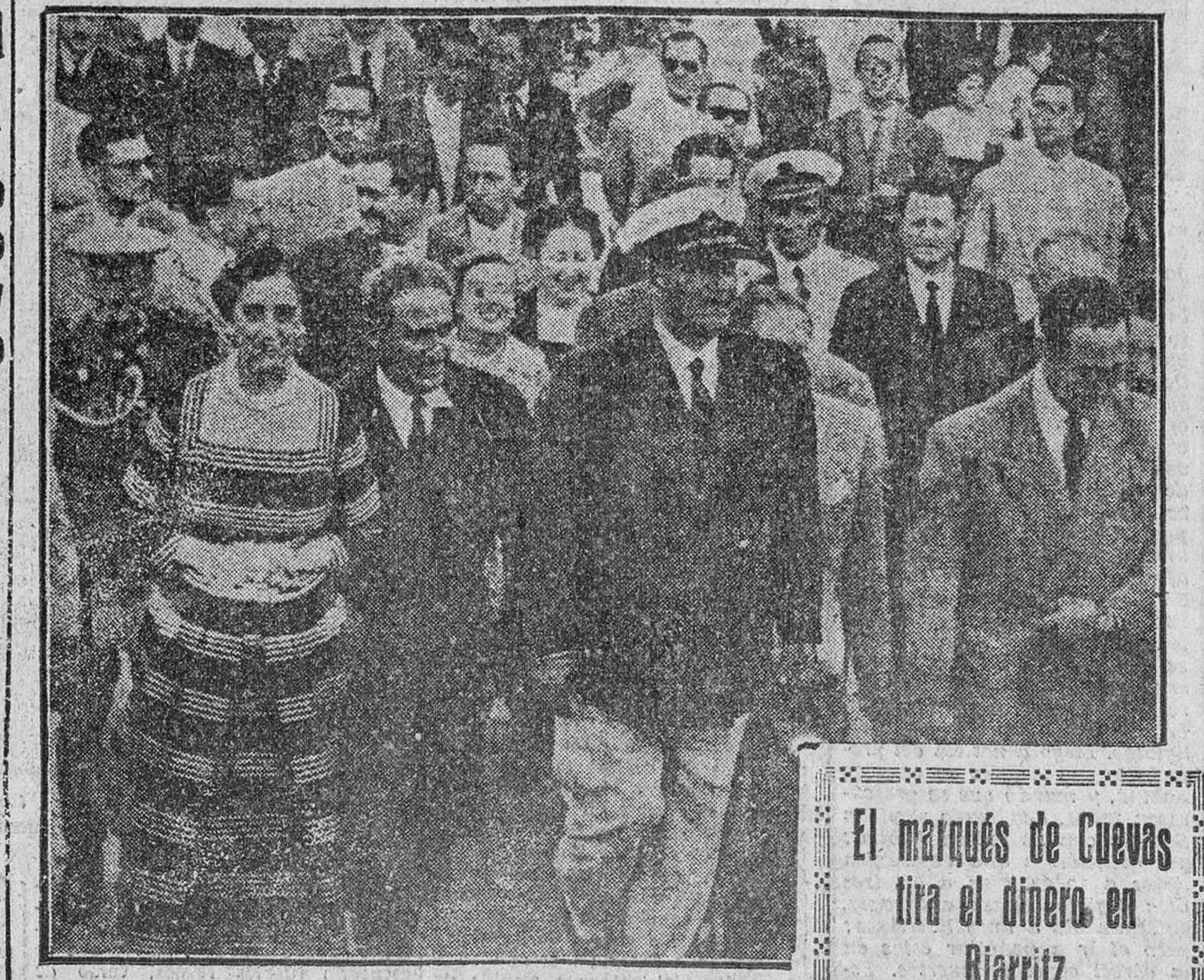
Su Excelencia el Jefe del Estado y su esposa durante su visita a la romería de Santa Margarita, donde fueron aclamados por el pueblo coruñés.