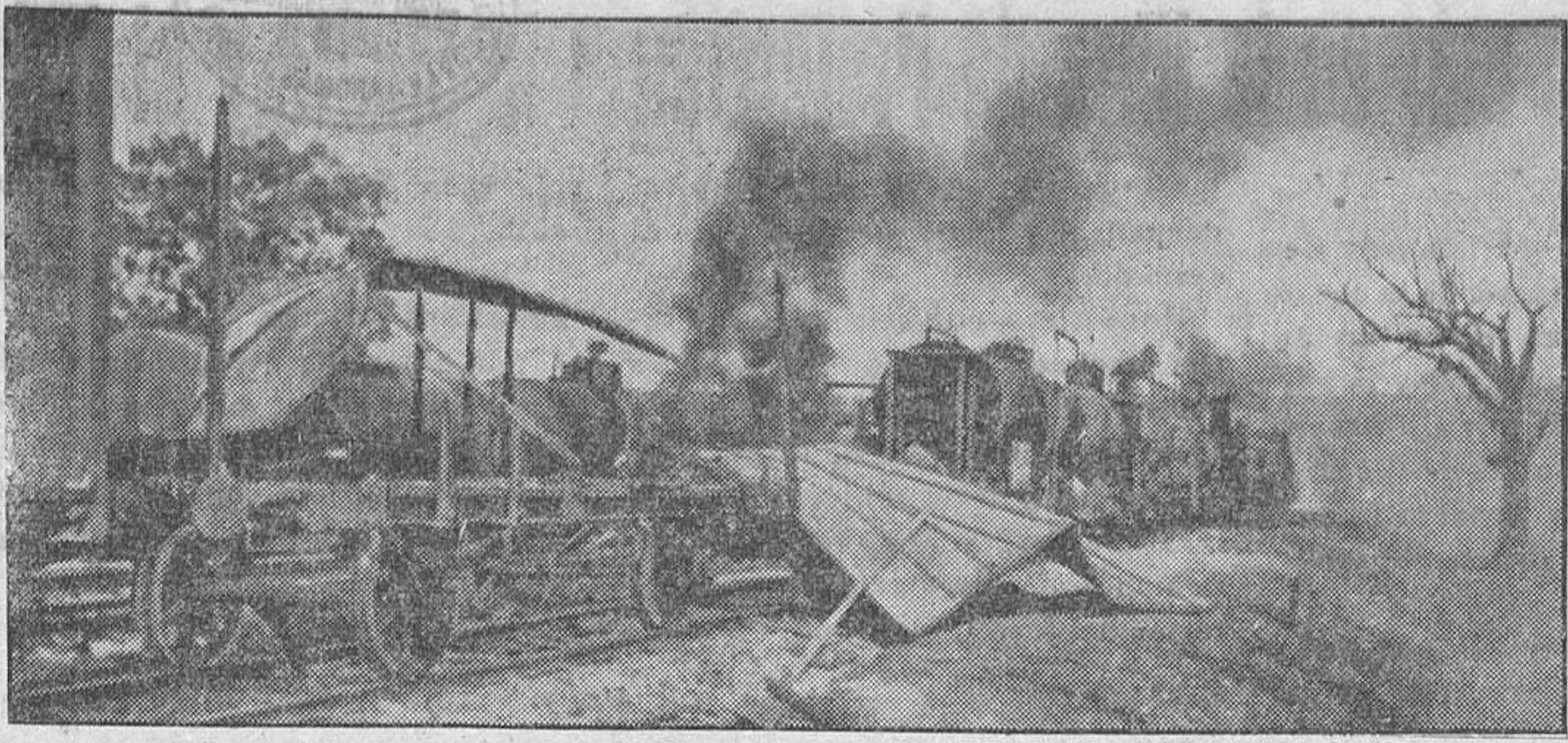
TRENES de transporte soviéticos destruidos por la aviación alemana.

Washington, 2.—Con motivo de la fiesta del trabajo en los Estados Unidos, el presidente Roosevelt, ha pronunciado un discurso radiado en el que dijo, entre otras cosas: «A todos los que creen que Hitler está bloqueado y parado ha de advertirseles que esto no deja de ser una suposición muy peligrosa. En una guerra, cuando el enemigo parece avanzar más lentamente que el año anterior, es cuando va a atacar con fuerzas renovadas. Hay que poner fin para siempre a la amenaza de conquista mundial y acabar también con toda paz basada en el compromiso con el mal». Después de referirse a la posición norteamericana y del envío de armamentos «a todos los frentes de lucha», declaró: «Los Estados Unidos han ayudado a todos los trabajadores a conseguir alcanzar la posición digna que les corresponde, no debiéndose esto a la casualidad, sino al proceso revolucionario de la democracia. Como el trabajo realizado sería eliminado, es éste el grupo el que se juega más en la derrota. Hemos hecho mucho ya, pero es preciso que hagamos infinitamente más. Contra la violencia que ha sido desencadenada por Hitler sobre la tierra, nosotros debemos poner todo lo que sea preciso para vencerle.»—Efe.