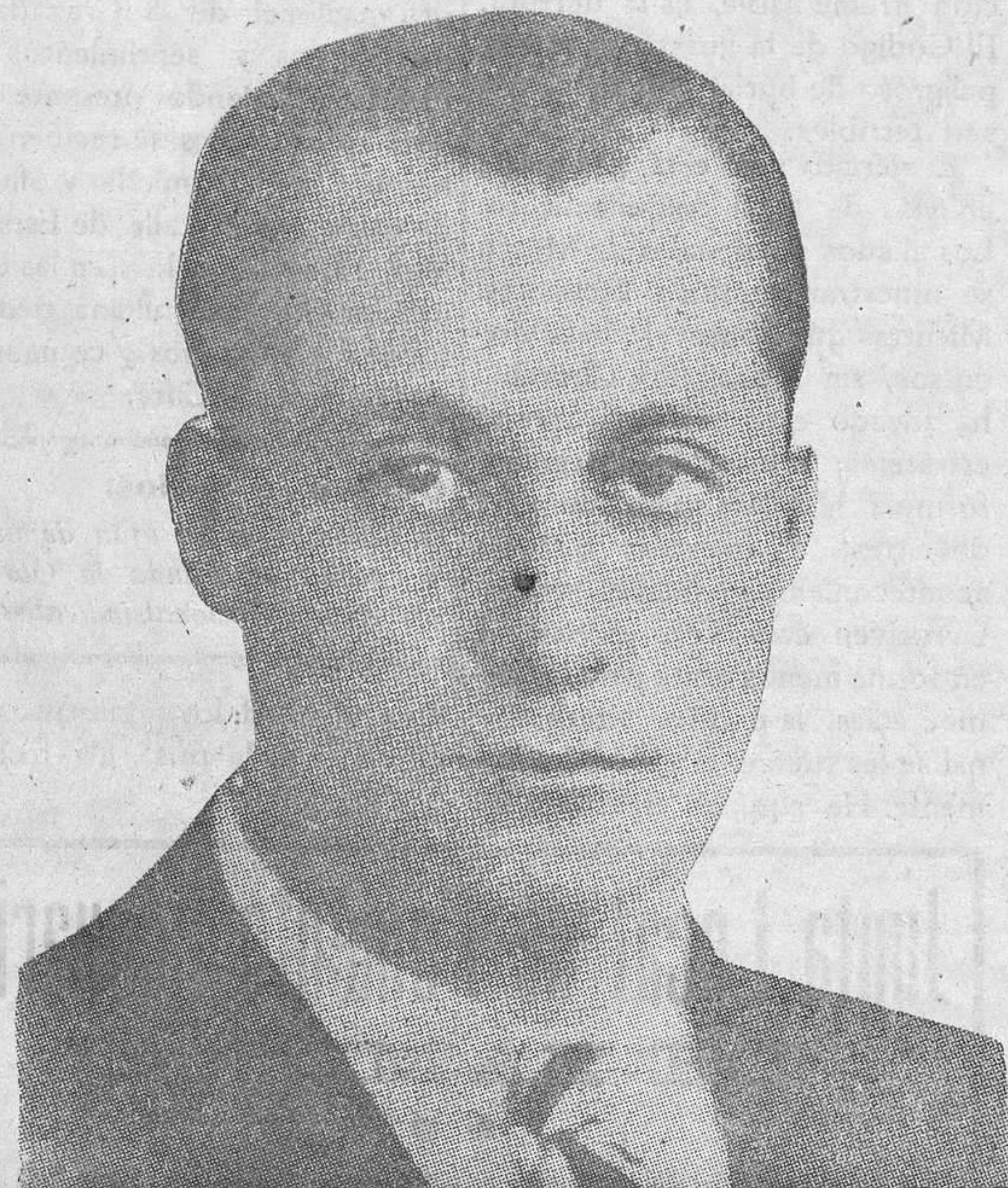
En esta fecha dolorosa del 20 de noviembre, aniversario de la muerte de José Antonio, el Sindicato Español Universitario, su obra predilecta, rinde a la memoria del Fundador su homenaje más sentido. Pero mejor que las palabras cantan los hechos. Nosotros seguiremos siempre en la lucha por las ideas y la doctrina que José Antonio marcara.

HOJA EDITADA POR EL DEPARTAMENTO PROVINCIAL DE P. P. Y P. DEL S. E. U.