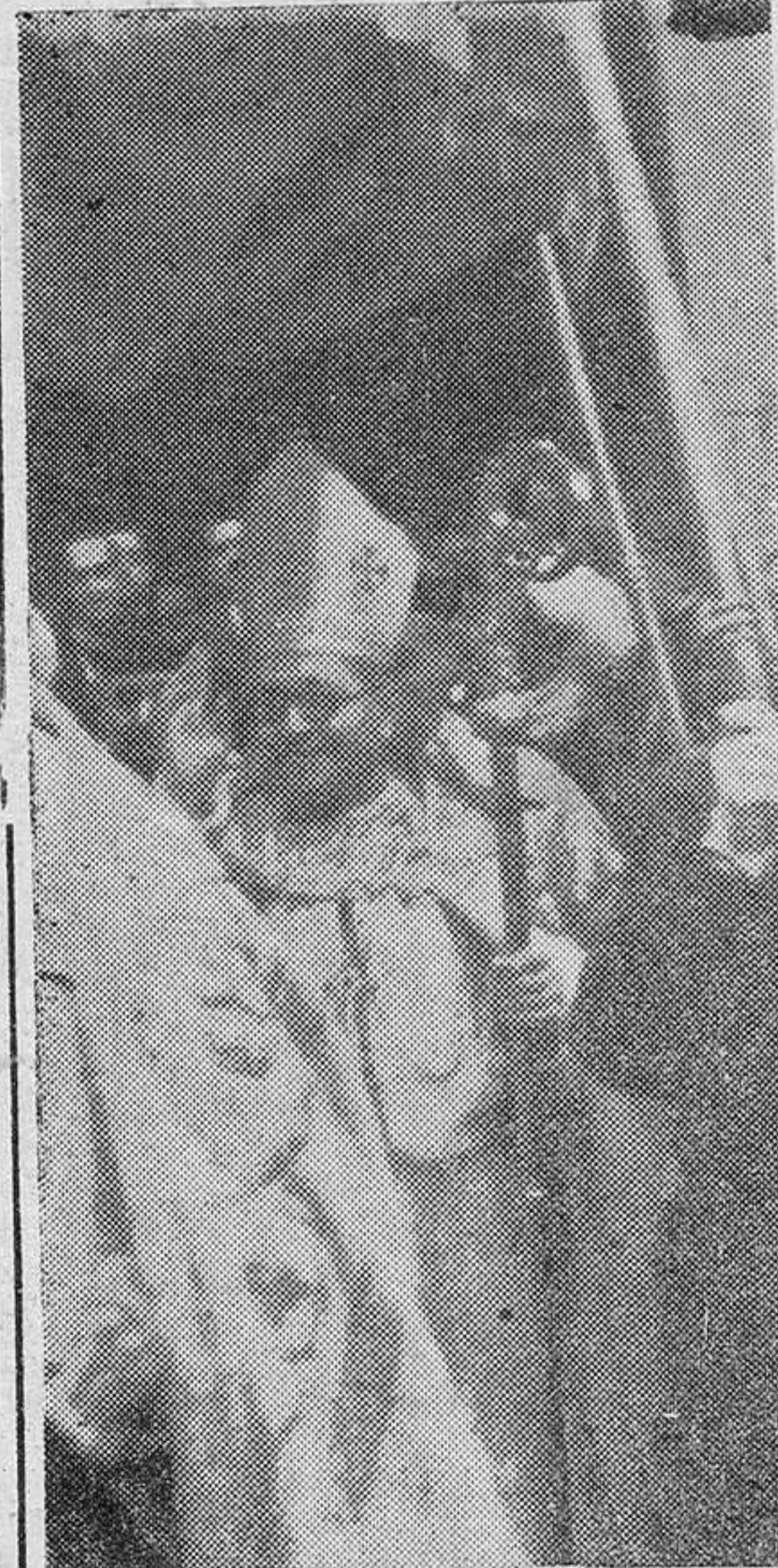
* El señor obispo, revestido de Pontifical y bajo palio, se dirige hacia la Catedral, correspondiendo sonriente a las demostraciones de cariño de los zamoranos.