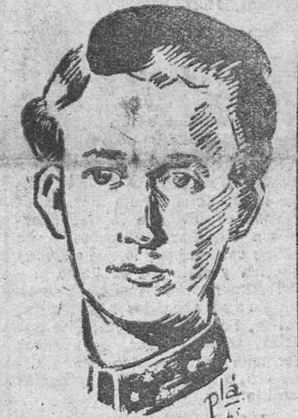
LEOPOLDO DE BELGICA

BRUSELAS, 15. (Urgente).—El rey Leopoldo ha prometido transferir temporalmente sus prerrogativas reales a su hijo Balduino si el Parlamento belga le llama al trono, según dice en el mensaje real radiado esta tarde al pueblo belga.