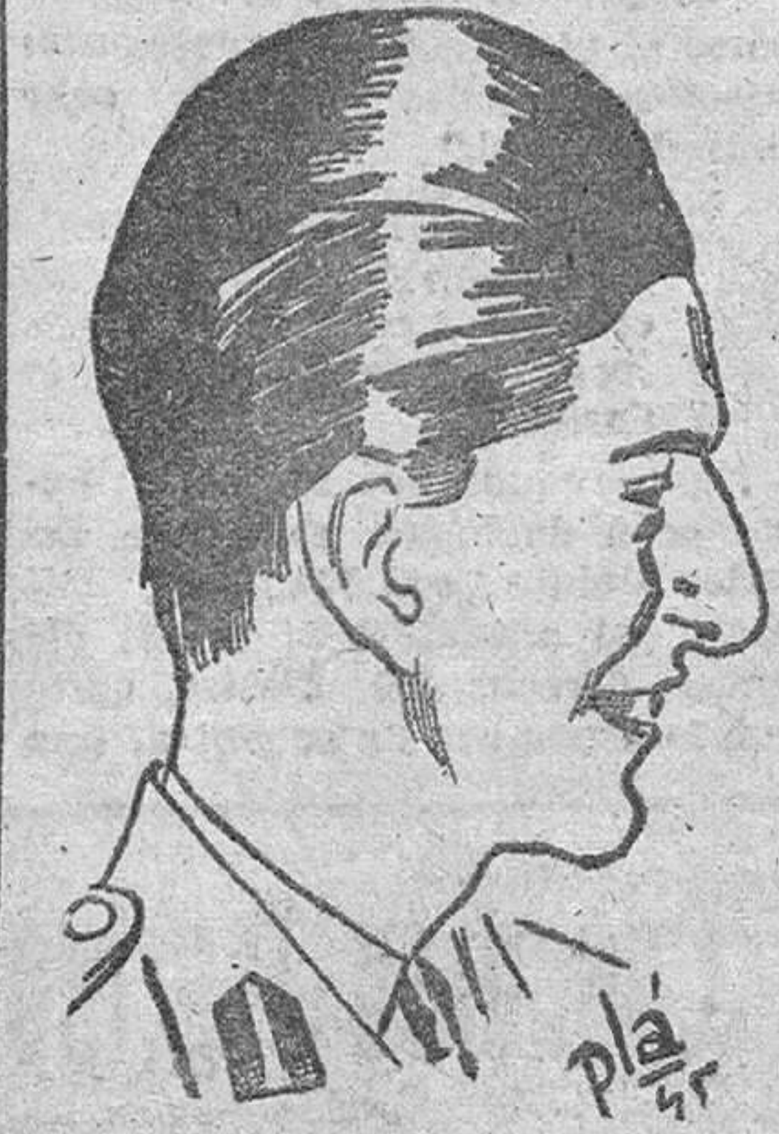
PEDRO DE YUGOSLAVIA