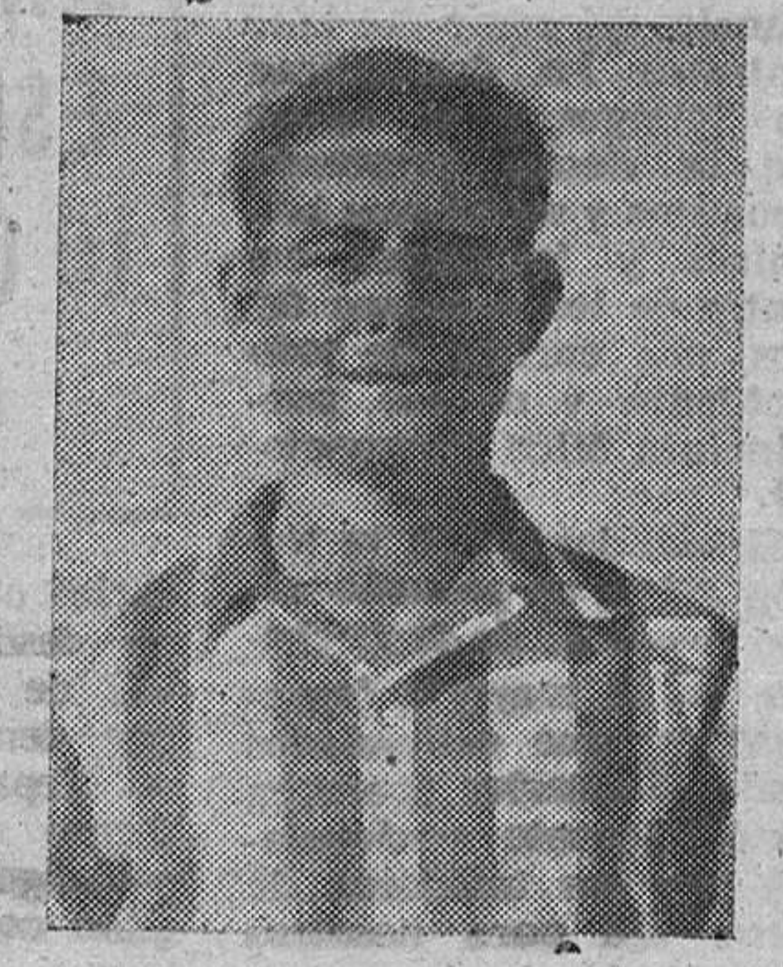
Tano, extremo zurdo del Atlético de Zamora, que no estuvo muy afortunado en Avilés, según nos dicen. Sin embargo él hizo lo que ningún otro rojiblanco podría repetir; un gol. Precisamente el del "honor deportivo" zamorano.