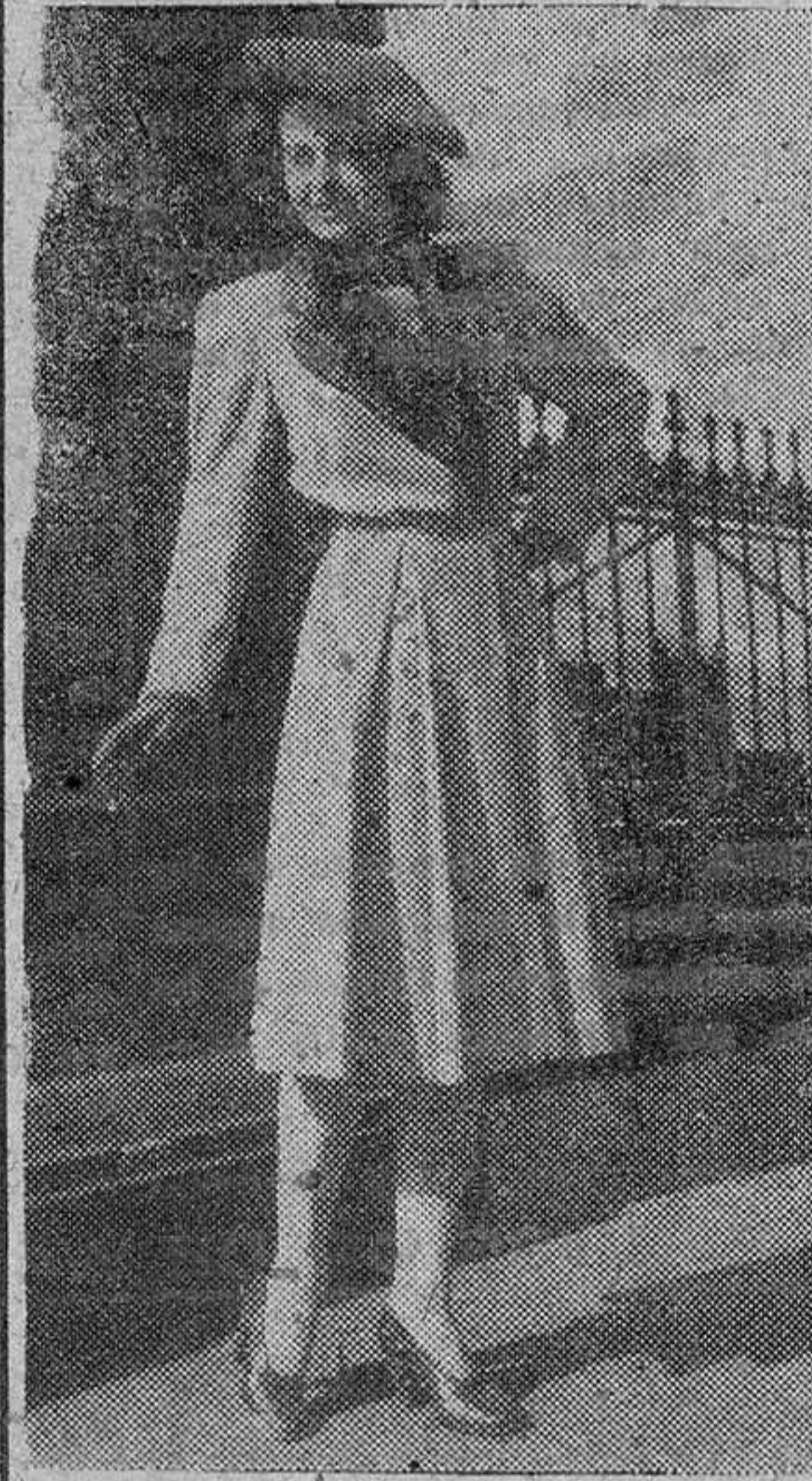
estas, abrigos y abrigos de noche, por el sistema de "las diosas". Los estudios en relación con los vestidos aun continúan.

La propia tienda de departamentos ya está vendiendo trajes "juste, cla-