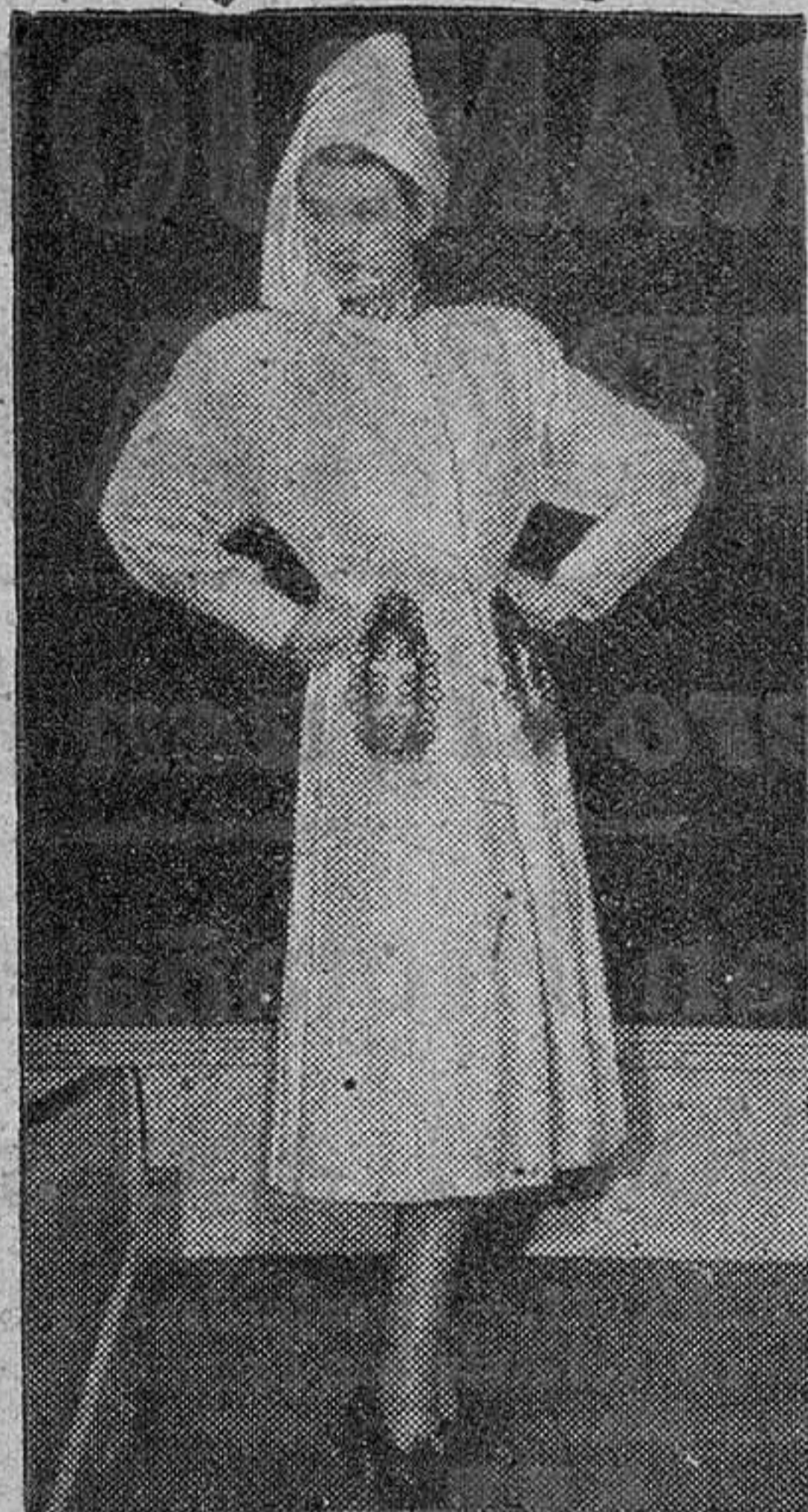
LONDRES. (Servicio de Exclusivas PYRESA. International New Service).

En Inglaterra las damas ya no tienen cuerpos difíciles.