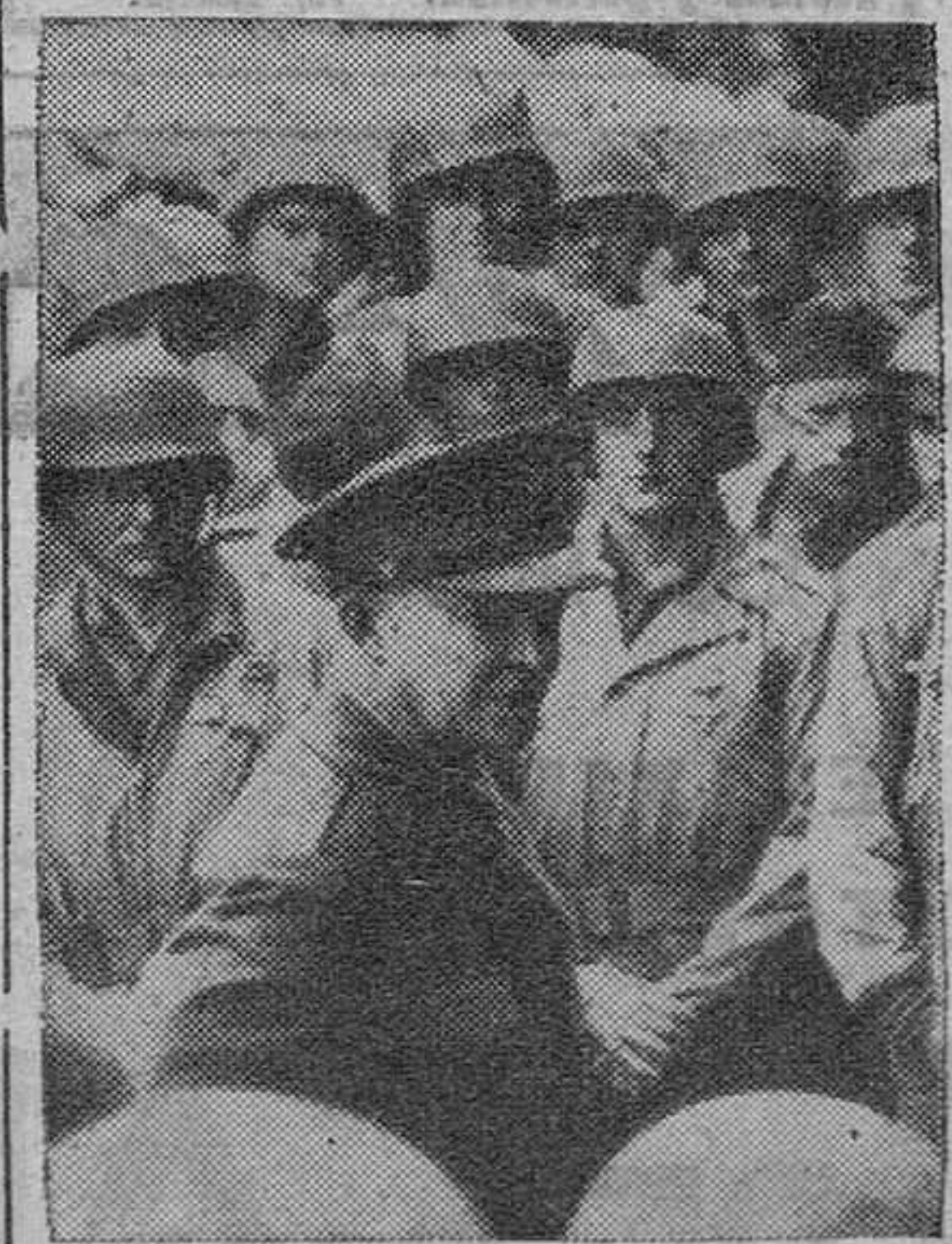
El general Eisenhower dirige la palabra a los soldados de la Primera División norteamericana.