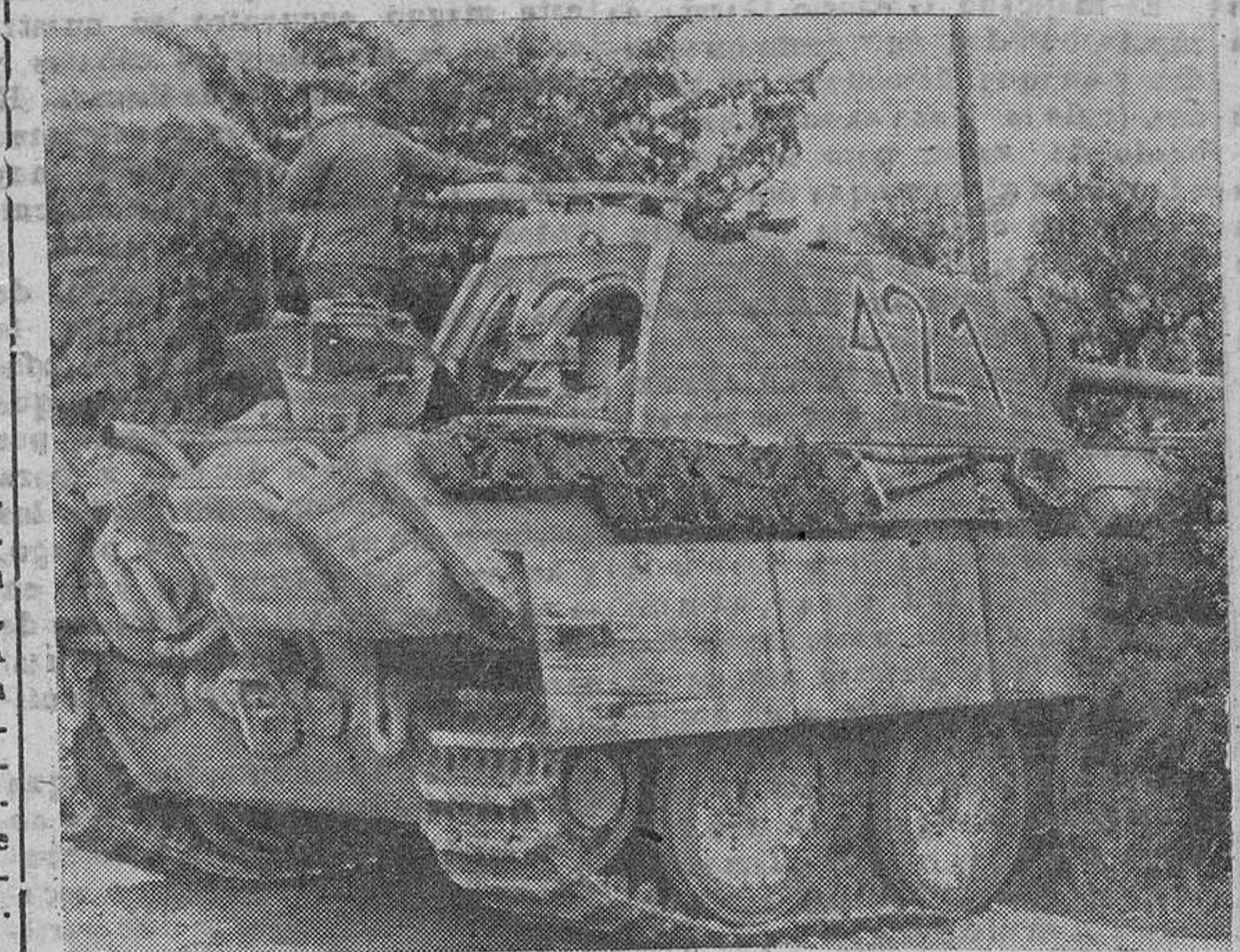
Uno de los nuevos tanques alemanes del tipo «Panther», dotado de una supercarroza que le hace poco menos que invulnerable a los impactos de las piezas anticarro. Este nuevo modelo ha sido ya empleado en los distintos frentes.