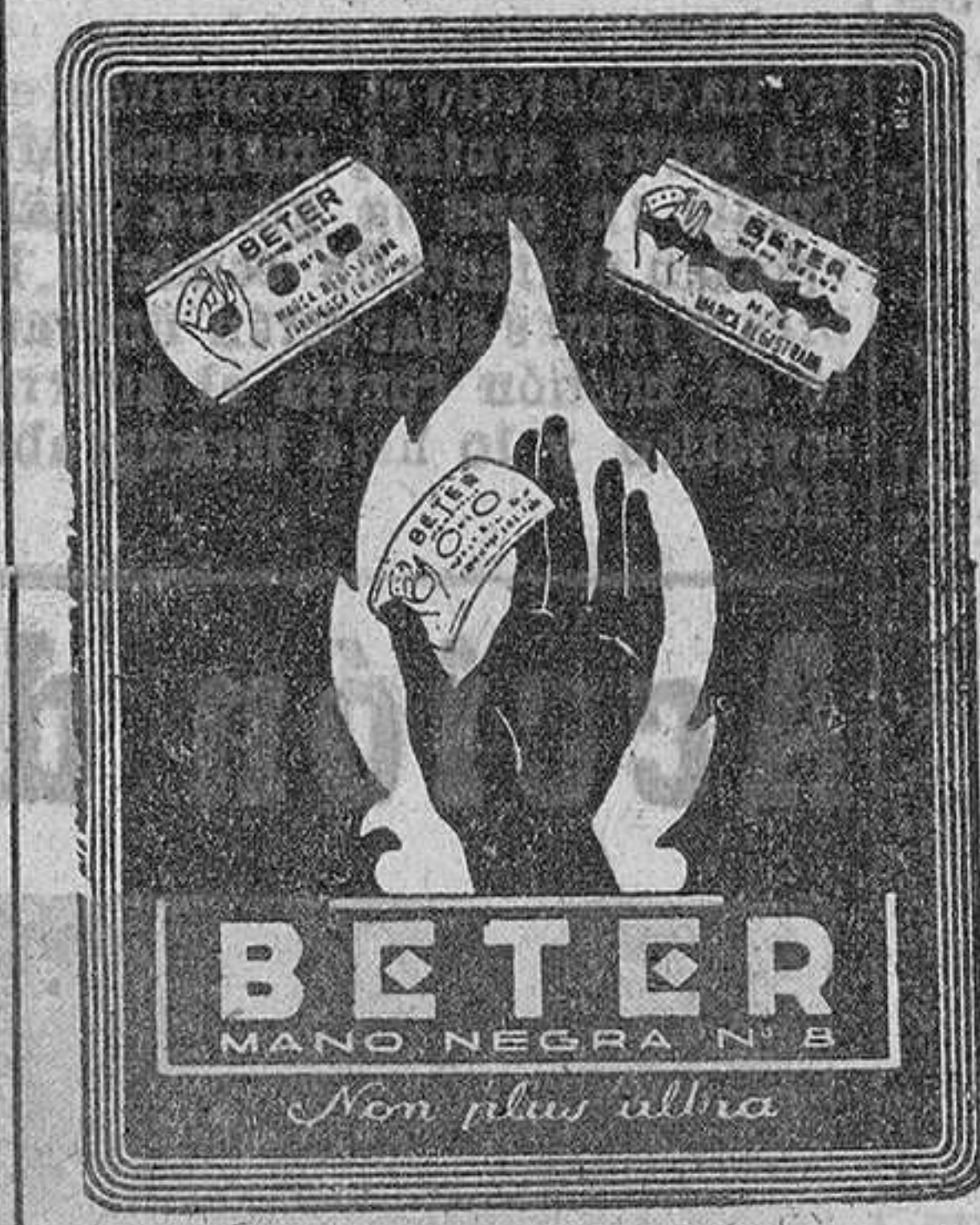
Non plus ultra