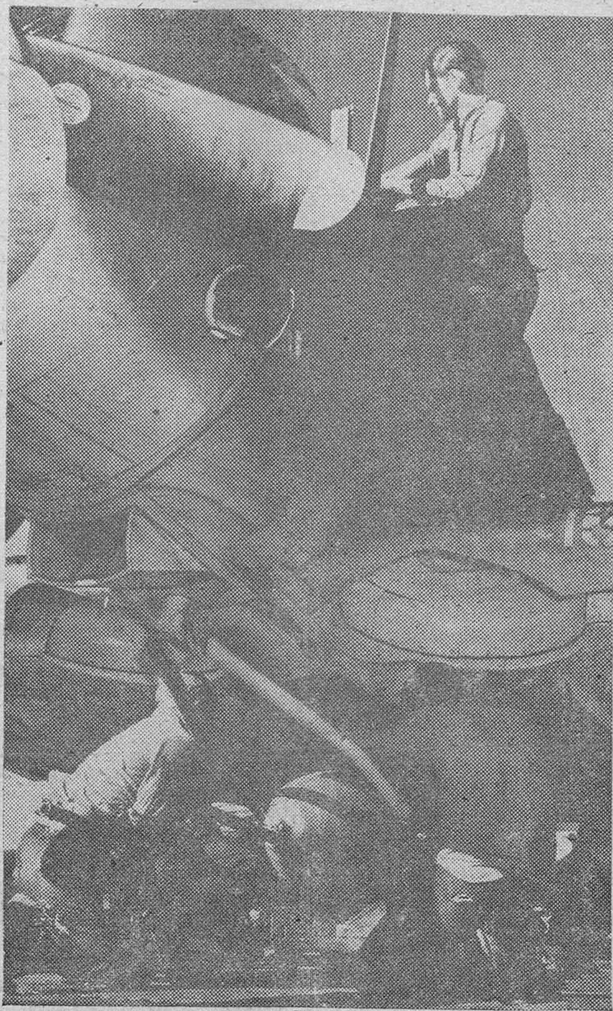
Sobre la cubierta de un portaaviones, los tripulantes colocan una bomba de 500 Kgs. en un bombardero en pleado Dauntless, mientras el capitán, subido en el ala, comprueba los instrumentos de la carlinga, antes de despegar, para atacar a los japoneses.