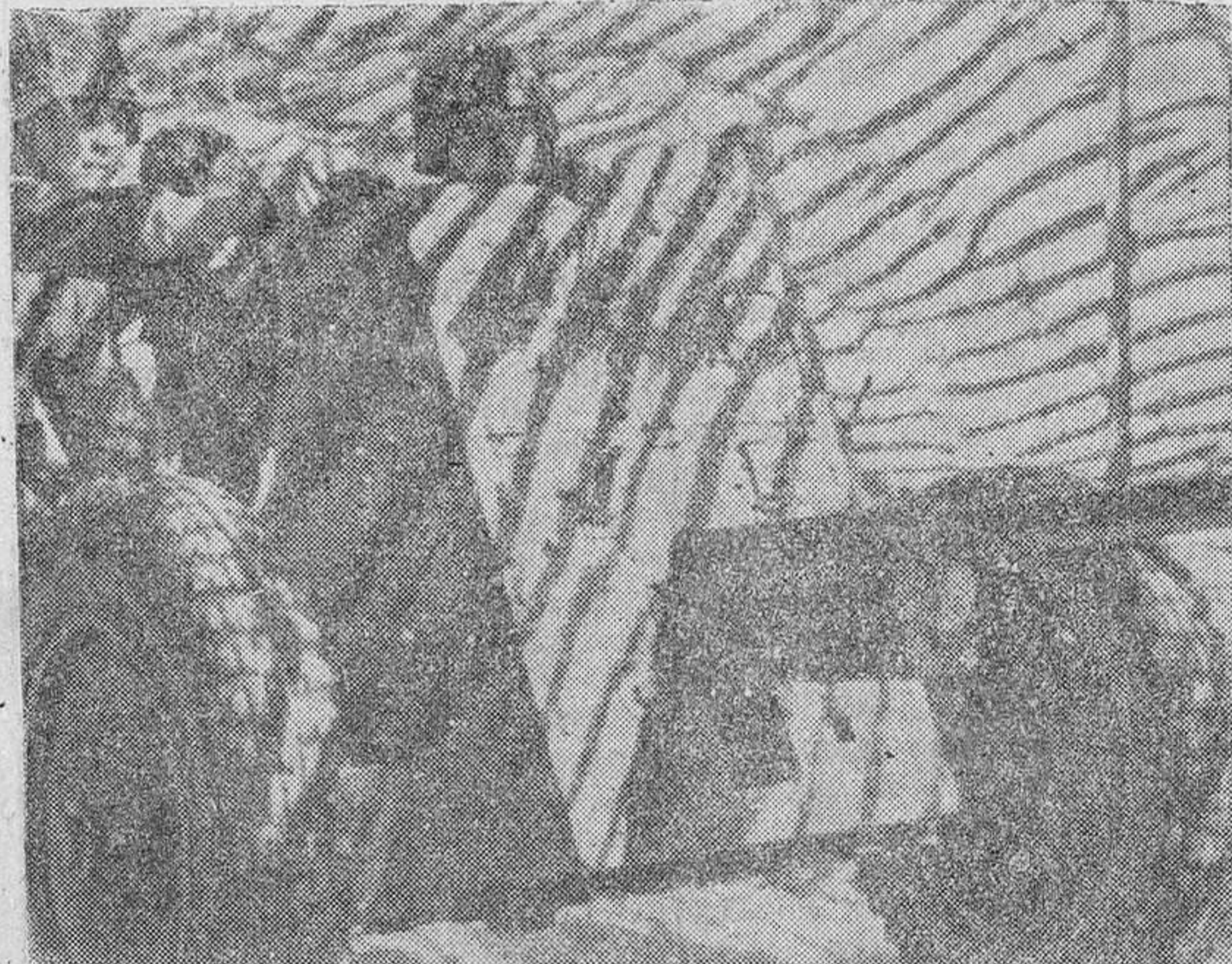
Servidores de un cañón antitanque en el teatro de guerra normando, trasladan su pieza a los lugares de gravedad de las batallas de carros.