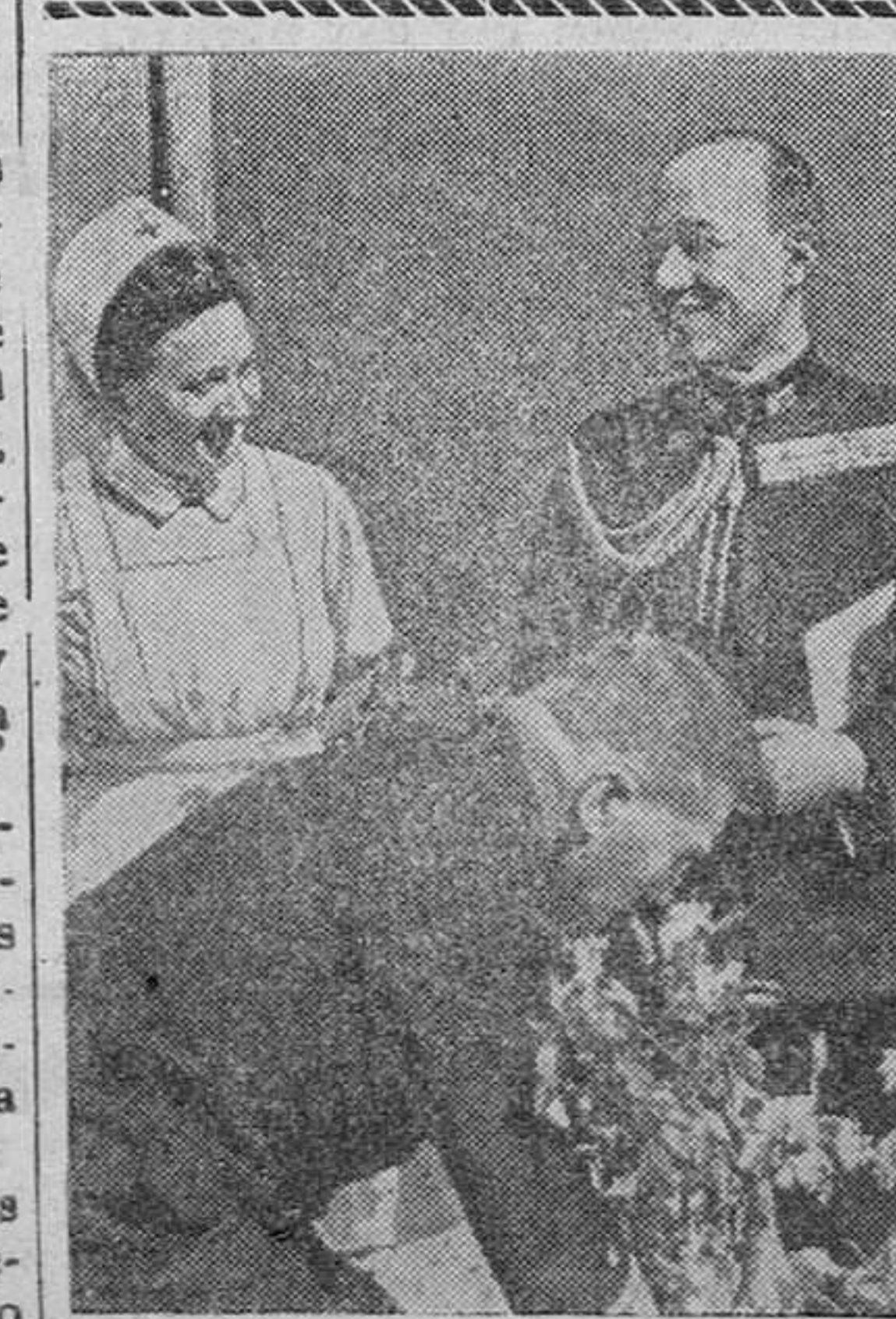
El agregado militar de la Embajada Japonesa en Berlín, Kohima, recibe de manos de una enfermera en la costa del Canal, el símbolo del heroísmo japonés.

Teléfonos de IMPERIO: Administración 1570 Dirección 1576