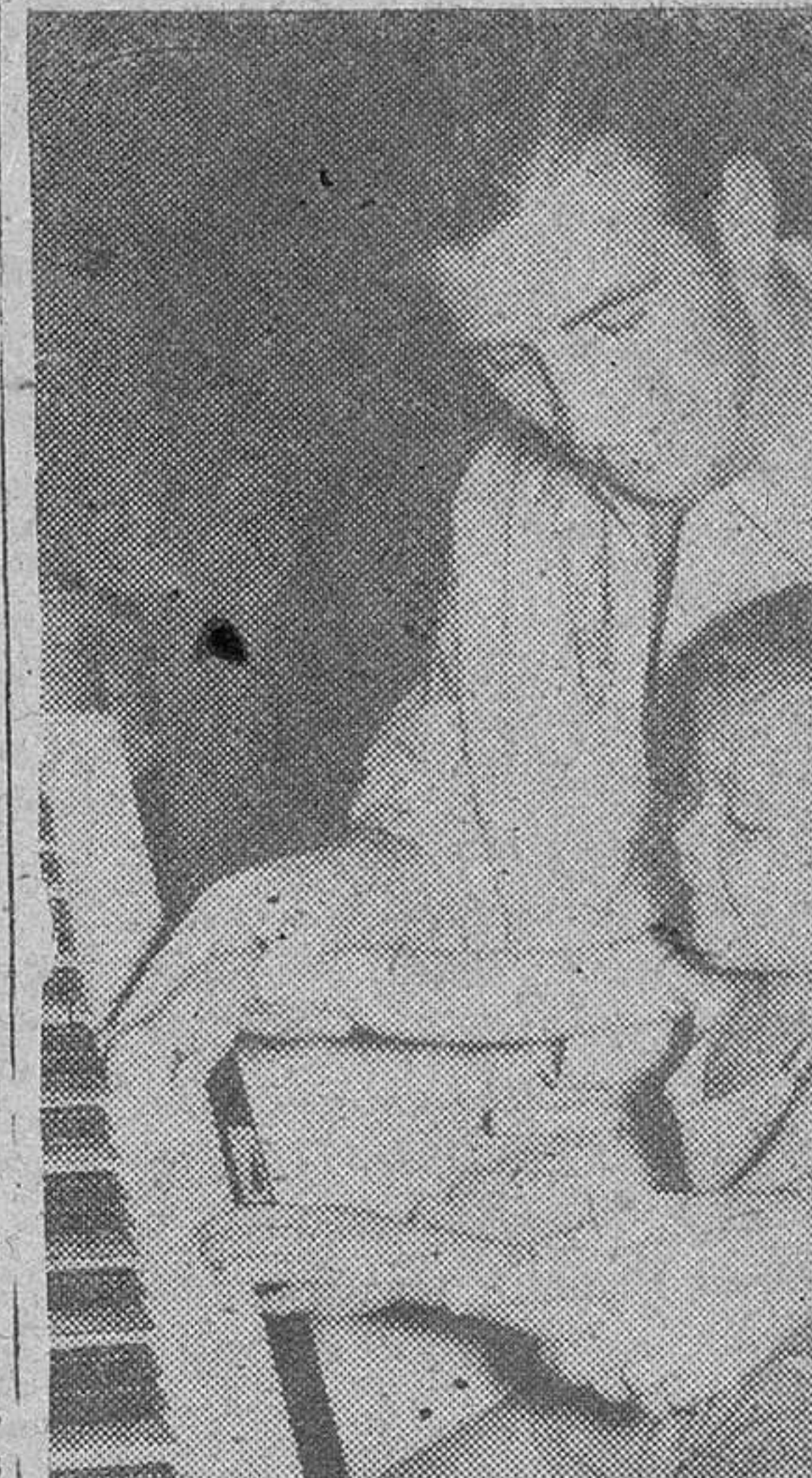
Un huerfanito filipino, sonríe felizmente mientras un soldado americano le lleva las manos sobre un piano en una sala de recreos de la Cruz Roja en Nueva Guinea Holandesa.