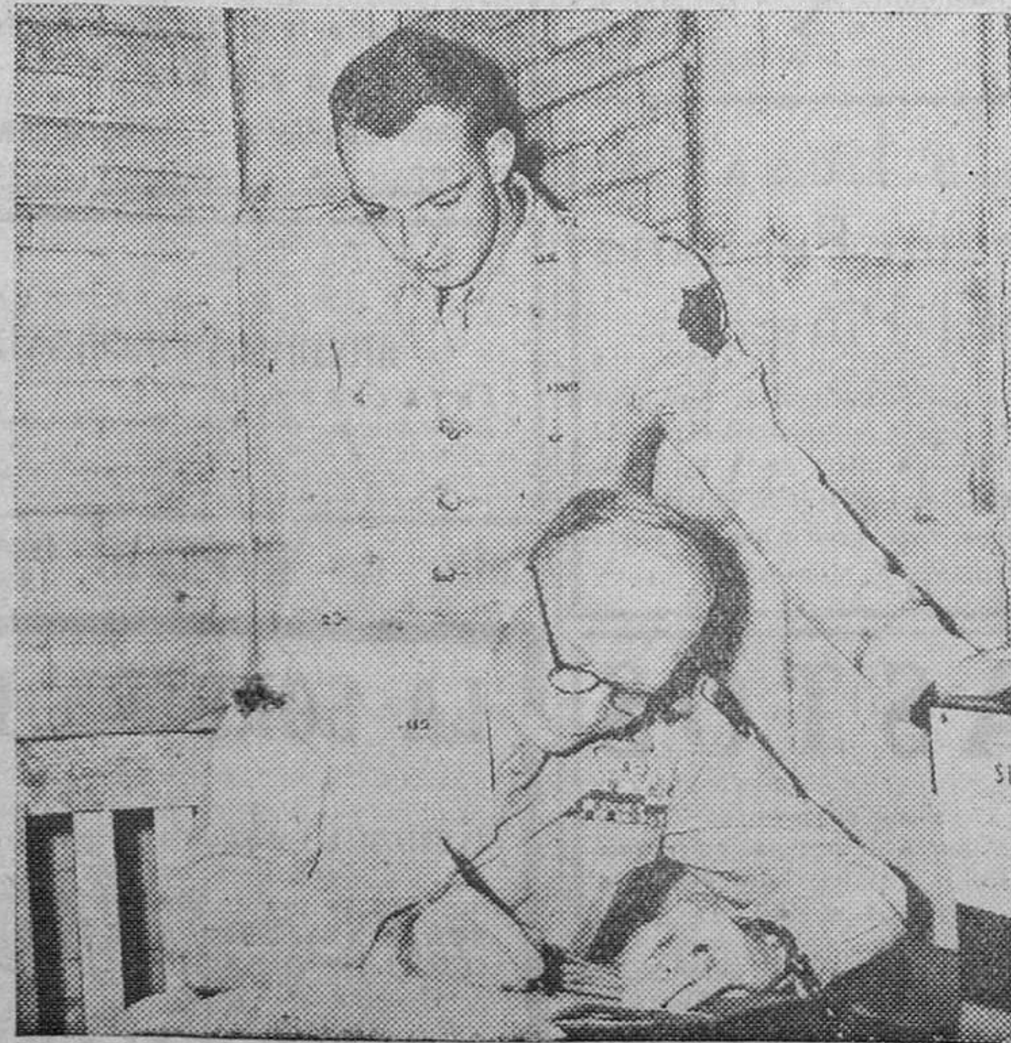
El general Eisenhower firma en el álbum de la Academia militar norteamericana de West Point, durante su visita a ella. Tras él aparece su hijo