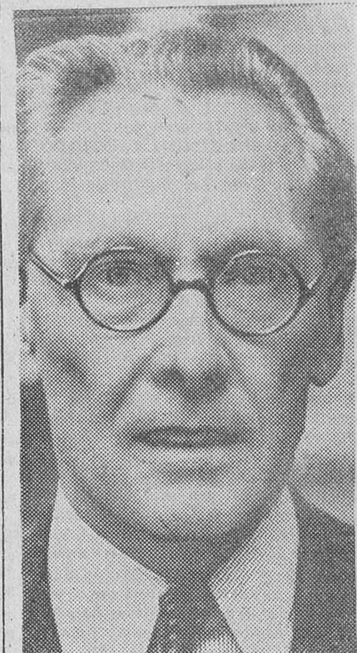
Mister Philip Noel Baker, ministro de Estado británico