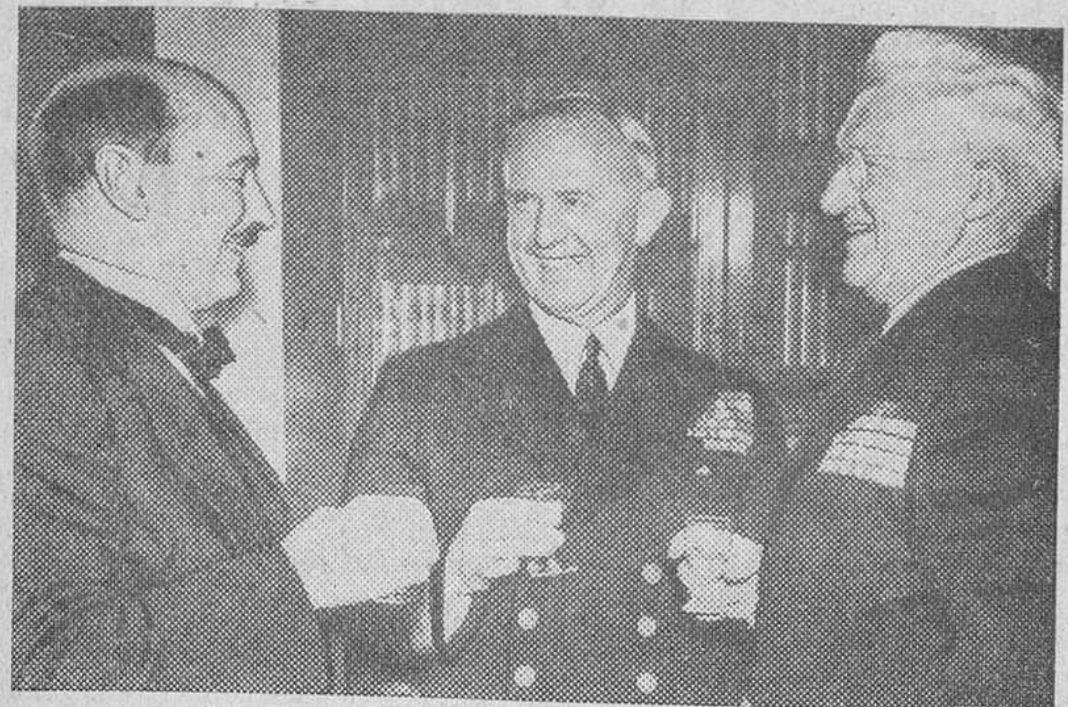
Mister Atlee, con el primer lord del almirantazgo británico y el almirante Stark, durante un brindis celebrado en honor de este último con motivo de su regreso a los Estados Unidos