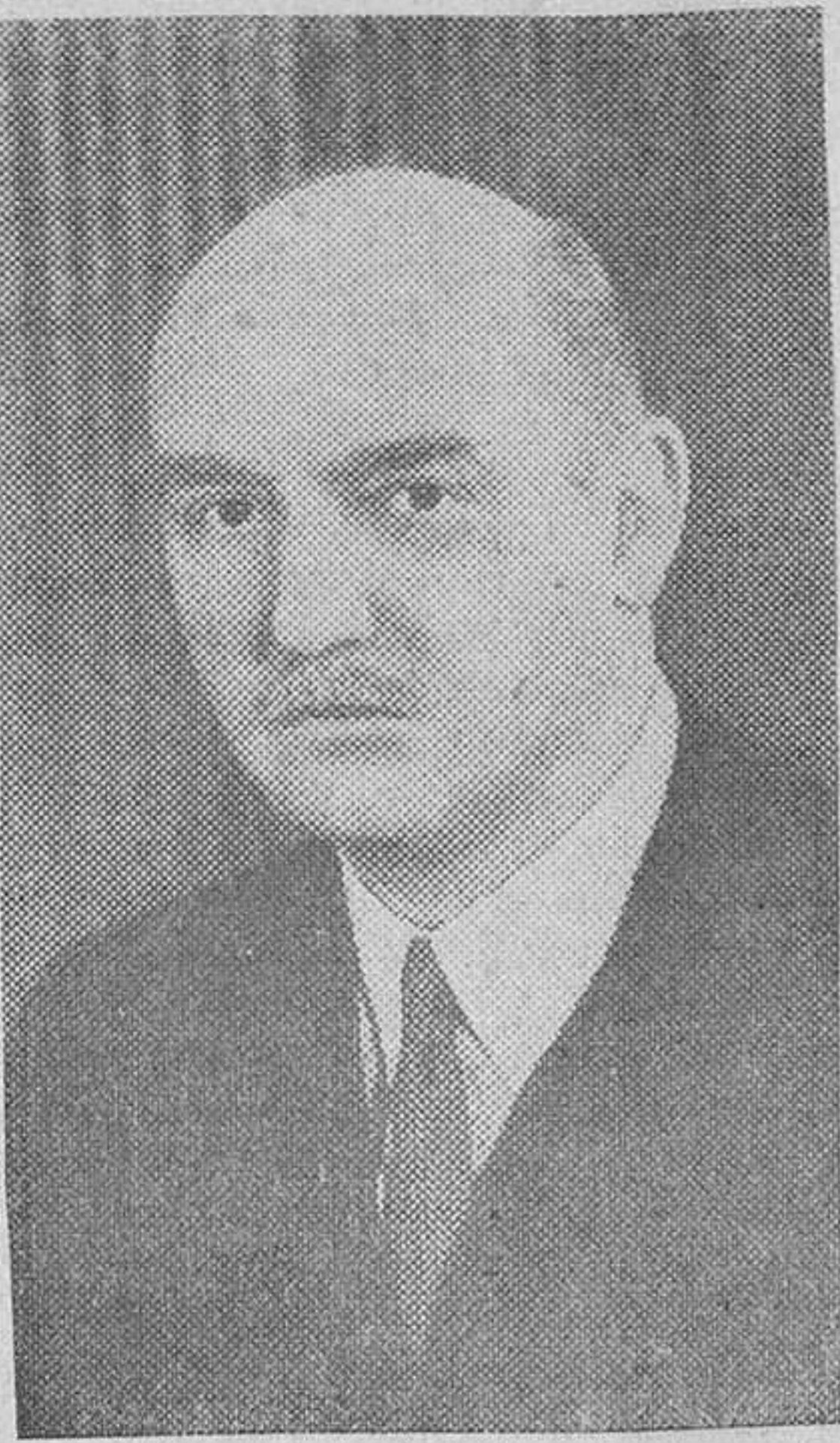
El subsecretario permanente del Aire del Imperio británico, sir Arthur Street.