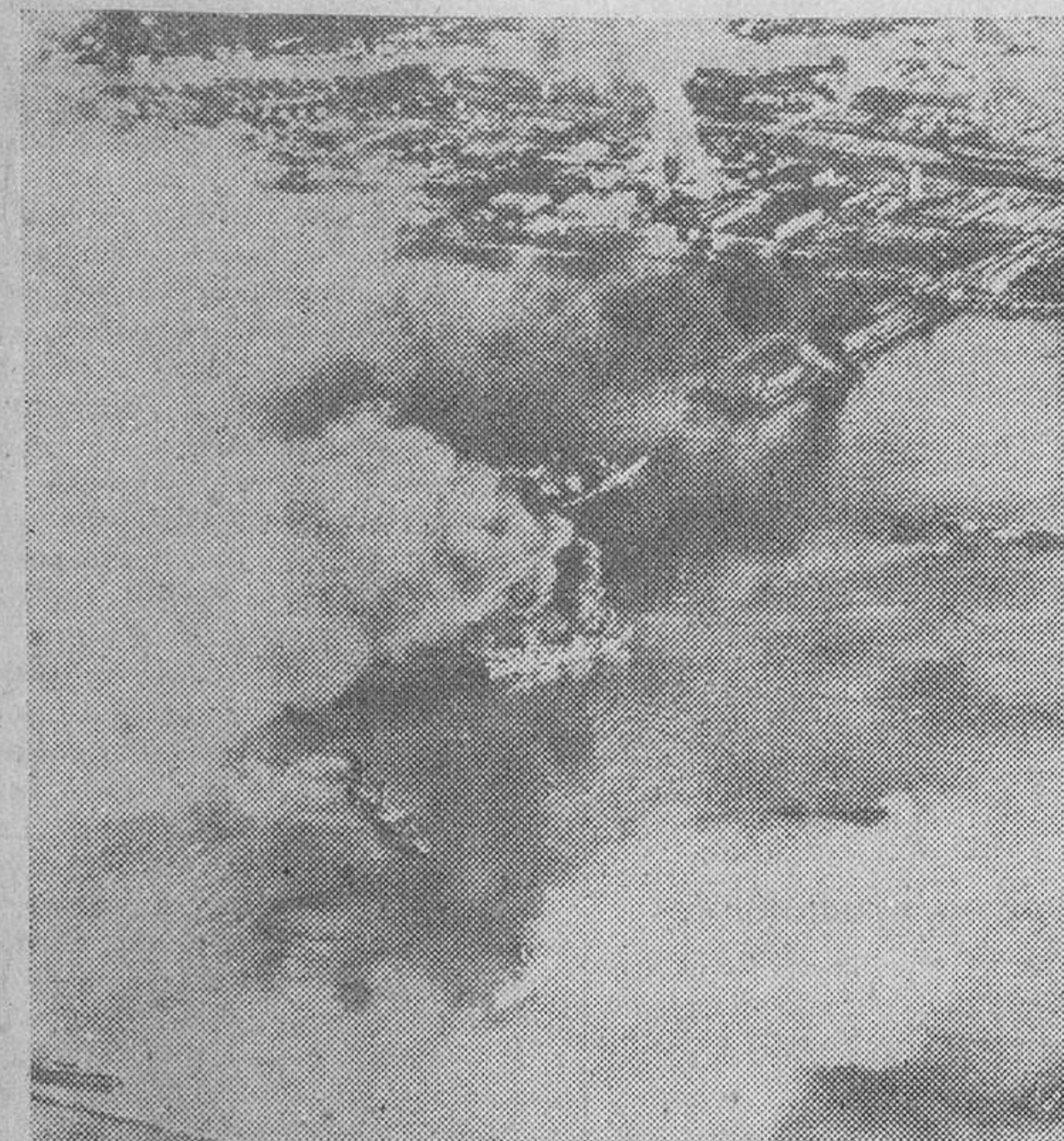
Buques de guerra y transportes japoneses arden en la base naval de Kure alcanzados por las bombas lanzadas por los aviones norteamericanos en sus recientes ataques.

En Kure un gran portaaviones japonés recibió un impacto directo