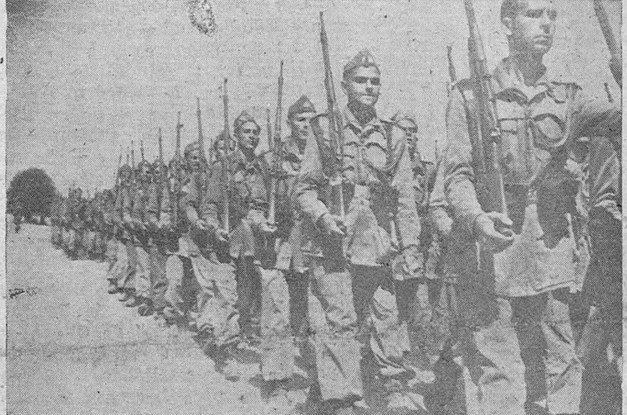
1.300 universitarios juraron el domingo fidelidad a la Bandera en el Campamento de la I. P. S. en Monte la Reina.